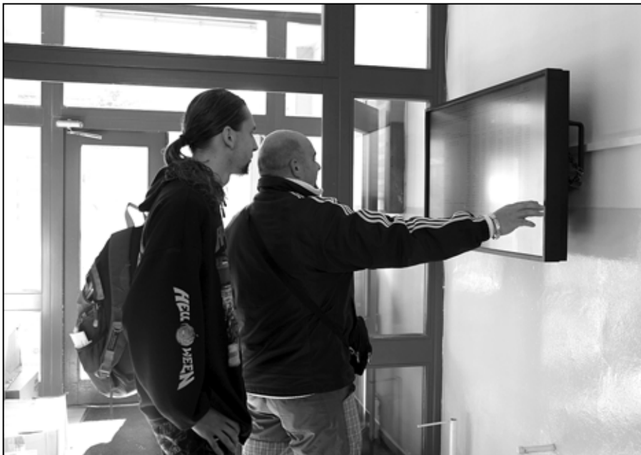
Informačná tabuľa s dotykovou obrazovkou v fahárni rúr.