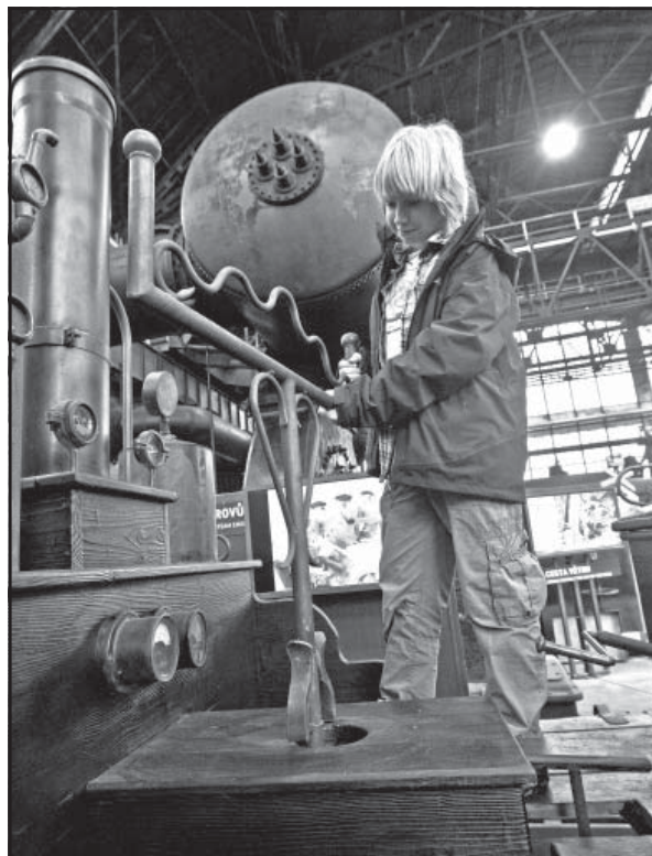
„Malý svet techniky“ je obrovským zážitkom pre deti i dospelých