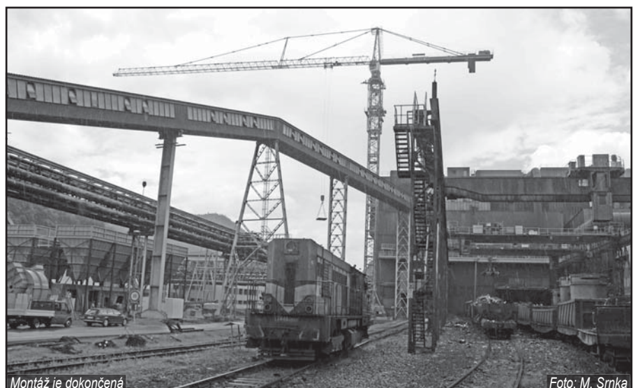
Montáž je dokončená