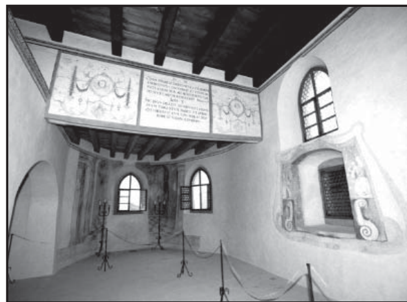
Vašej pozornosti by nemala ujsť celistvo zachovaná renesančná kaplnka. Ministerstvo kultúry SR jej v súťaži Kultúrna pamiatka roka 2008 udelilo cenu Fénix

Na druhej strane, k dispozícii je rodinná vstupenka, zľava pre väčšie skupiny ľudí a držiteľia Regionálnej karty Horehronia majú 20 - percentnú zľavu z ceny vstupného. K dispozícii je jedno parkovisko pred hradným areálom, ktoré je bez poplatku na parkovanie. Na hrad sa dá dostať turistickým chodníkom, pričom cesta zo železničnej alebo autobusovej zástavky trvá do 20 minút. Všetky potrebné informácie sú prehľadne zobrazené