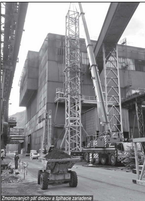
Zmontovaných päť dielcov a šplhacie zariadenie