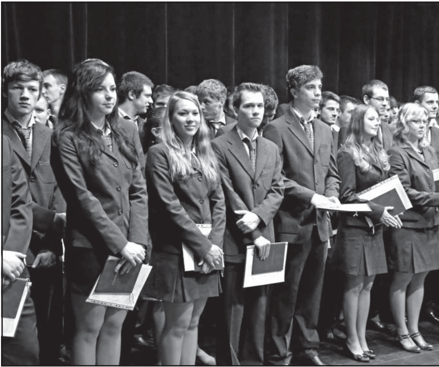
Pripravení vstúpiť do života a prevziať za seba zodpovednosť.