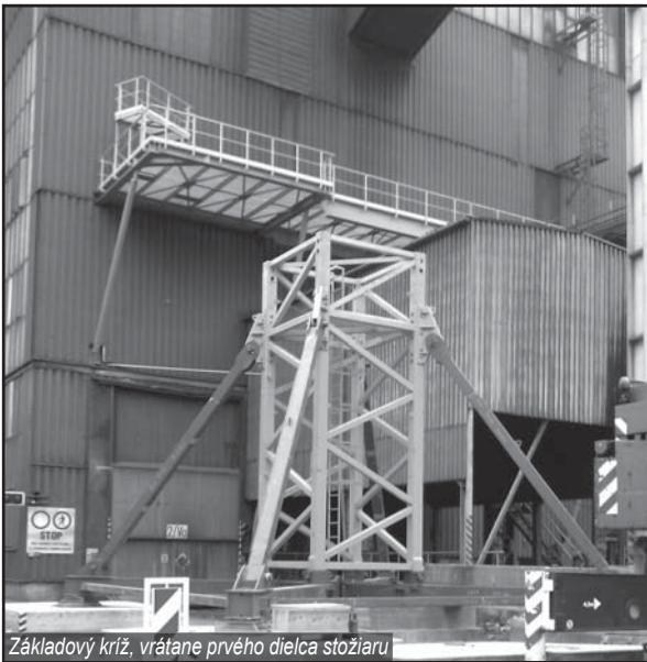
Základový kríž, vrátane prvého dielca stožiaru