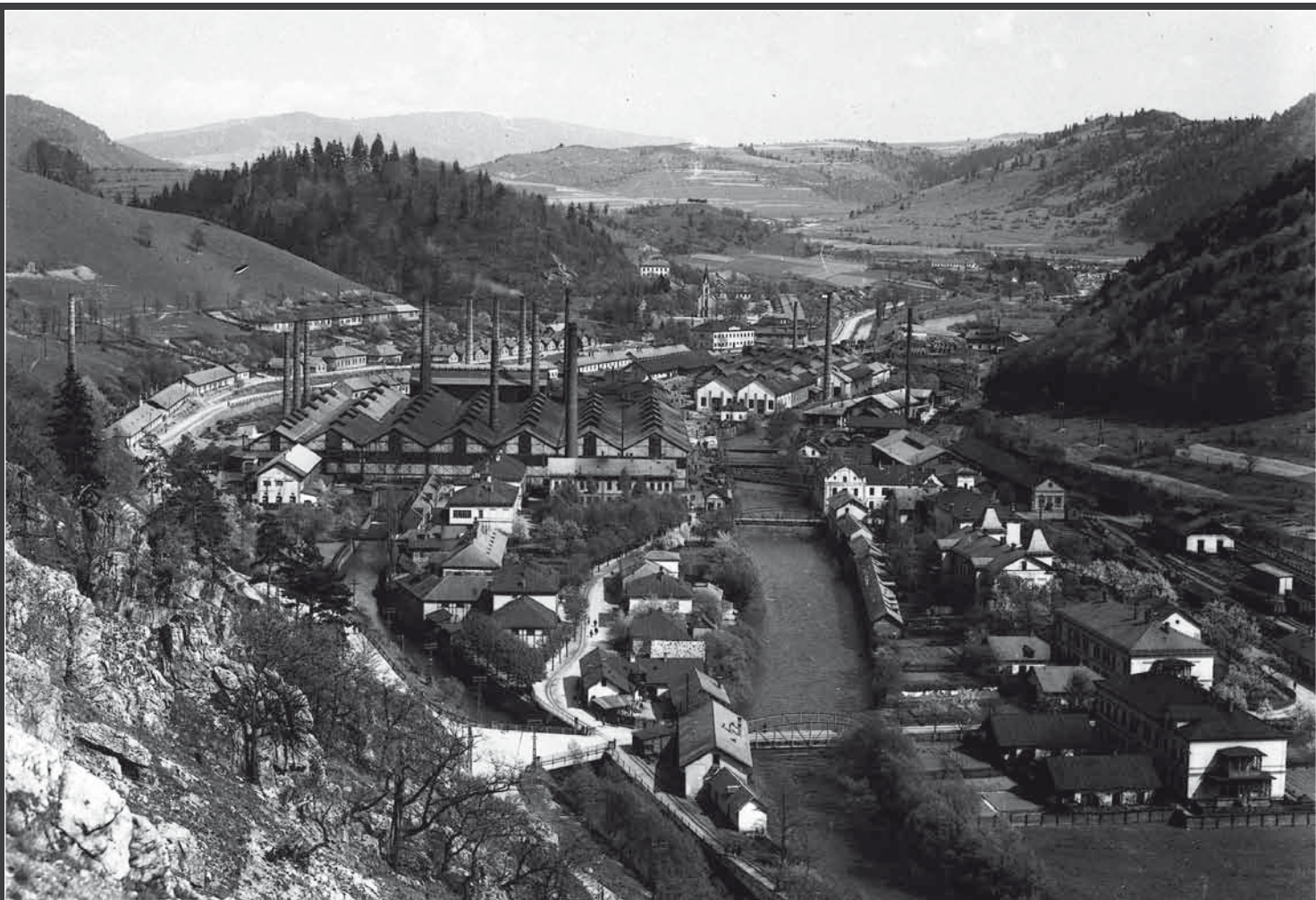
Archívny pohľad na Štátne železiarne a oceľiarne v Podbrezovej z roku 1930...