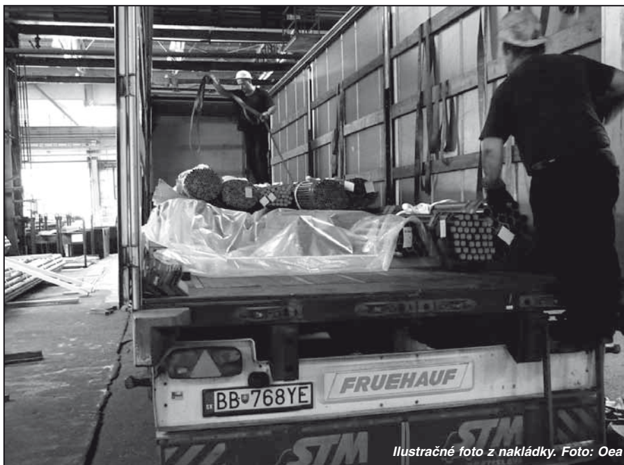
Ilustračné foto z nakládky.

Dostať sa k zákazkám pre obchodníkov ale vôbec nie je jednoduché. Obchodné prípady sú stále zložitejšie. Zákazníci v snahe nakúpiť čo najlacnejšie, hľadajú rôzne „kľučky“ ako nakúpiť tovar bez dane, ušetriť prepravné, prípadne náklady na spracovanie. Každý obchod ale musí byť v súlade s daňovou legislatívou, každý predaj tovaru mimo územia Slovenskej republiky, oslobodený od dane z pridanej hodnoty, musíme vedieť náležite preukázať. Naša práca je aj o hľadani riešení, ako neprísť o zákazky a na druhej strane nevystaviť našu spoločnosť rizi-