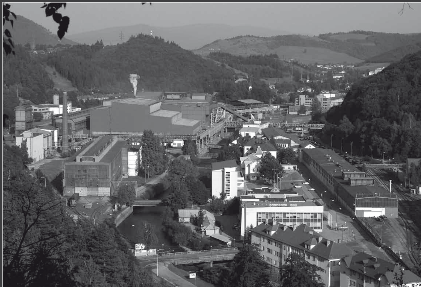
... a súčasný pohľad na Železiarne Podbrezová a.s. — časť starý závod.