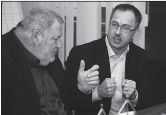
S kandidátom na predsedu BBSK v diskusii o budúcnosti nášho regiónu.

- Región Horehronie je z hľadiska hospodárskej podpory dlhodobo zanedbávaný nielen BBSK, ale aj vládou SR. Patrí medzi regióny s najvyššou mierou nezamestnanosti a prišlo sem minimum investorov, nie je tu vybudovaná infraštruktúra... Zo strany vedenia ŽP je doterajšia spolupráca s BBSK hodnotená ako veľmi zlá. Dôvod, prečo som sa rozhodol osobne podporiť