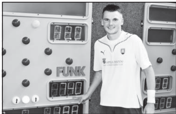
Svetový rekord Zavarku