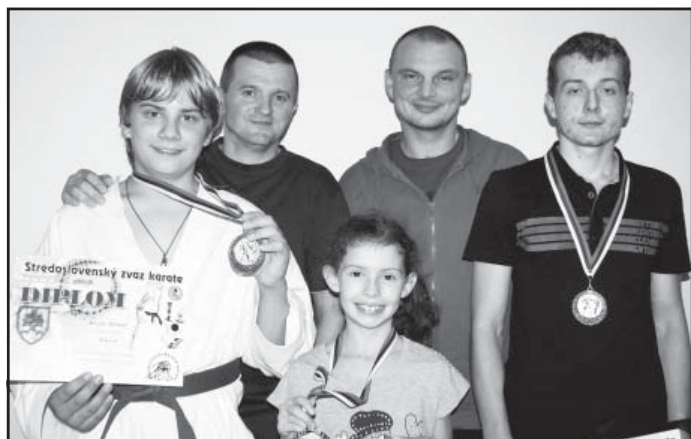
Medailisti otvorených majstrovstiev v karate so svojimi trénermi