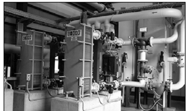
Výmenníky pre využitie „odpadného“ tepla vo výmenníkovej stanici odprášeného oceliarnie

- Energetika pred vykurovacím obdobím vykonala pravidelnú prehliadku a opravy ply-