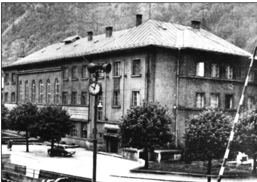
Pod jednou strechou boli sústredené reštauračné služby, spoločenské priestory, kasino a hotel...

Rok 2014 je 70. ročníkom nepretržitého vydávania Podbrezovana. Významné jubileum prípadne na 23. december. Dovtedy bude trvať aj naša čitateľská súťaž. Dozviete sa v nej mnoho nových zaujímavostí a keď budete texty pozorne čítať, nájdete v nich aj odpoveď na otázku. Kupón si vystrihnite a vypíšte údaje, aj správnu odpoveď a do desiatich dní od vydania pošlite do redakcie. Pravidlá umožňujú použiť trikrát náhradný kupón. Na konci bude zaujímavá odmena, ktorá môže byť práve vaša.