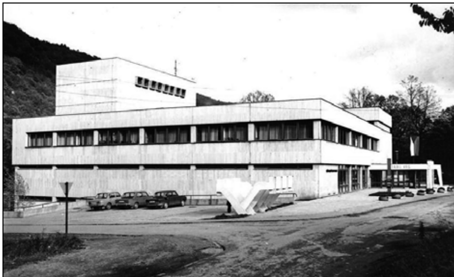
Dom kultúry po otvorení.

Strediskom spoločenského života na Skalici bol Kaliského hostinec, ktorého atrakciou bola