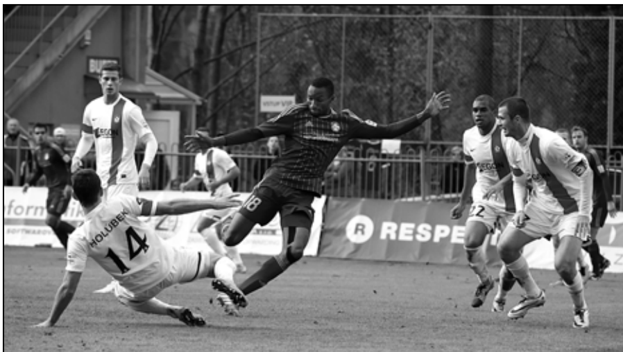
S lídrom tabuľky sme odohrali vyrovnaný zápas.