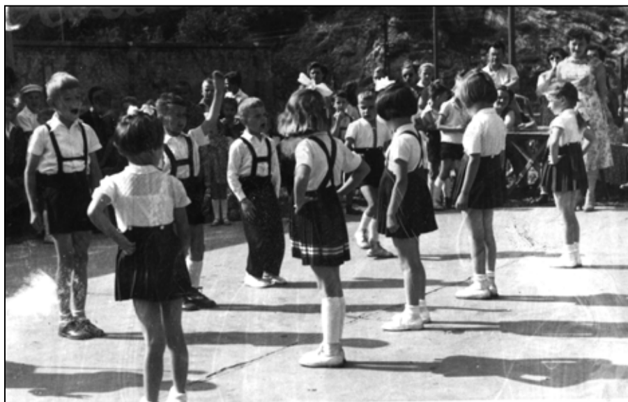
Z vystúpenia detí na nádvorí Robotníckeho domu.

aj hudobná skriňa. Počas letných mesiacov sa spoločenský život v Podbrezovej sústreďoval v parku. O hudobný sprievod sa staral dychový, sláčikový a tamburášsky orchester, ktorých účinkujúci boli zväčša zamestnanci železiarní. Až do skončenia druhej svetovej vojny počtom obyvateľov malá osada Podbrezová poskytovala vďaka vybudovaným spoločenským a kultúrnym zariadeniam široké možnosti rozvoja záujmovej činnosti.