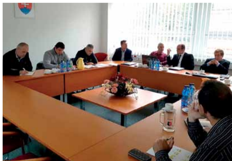
V plnom pracovnom nasadení.

Pilotná spolupráca medzi ŽP VVC a Transmesou na počítačom modelovaní ťahania rúr s vnútorným špirálovým rebrovaním