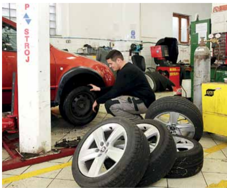
Výmena pneumatík je dnes prioritou.