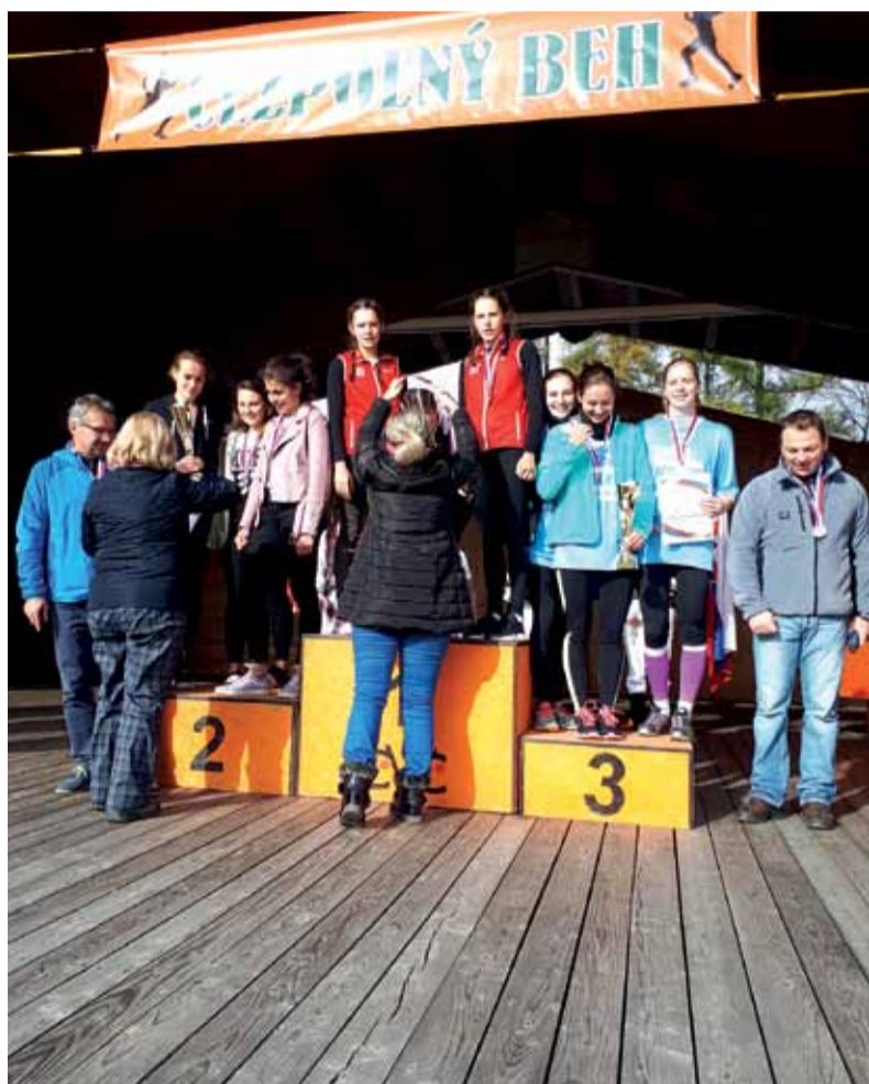
Ocenenie víťazného družstva