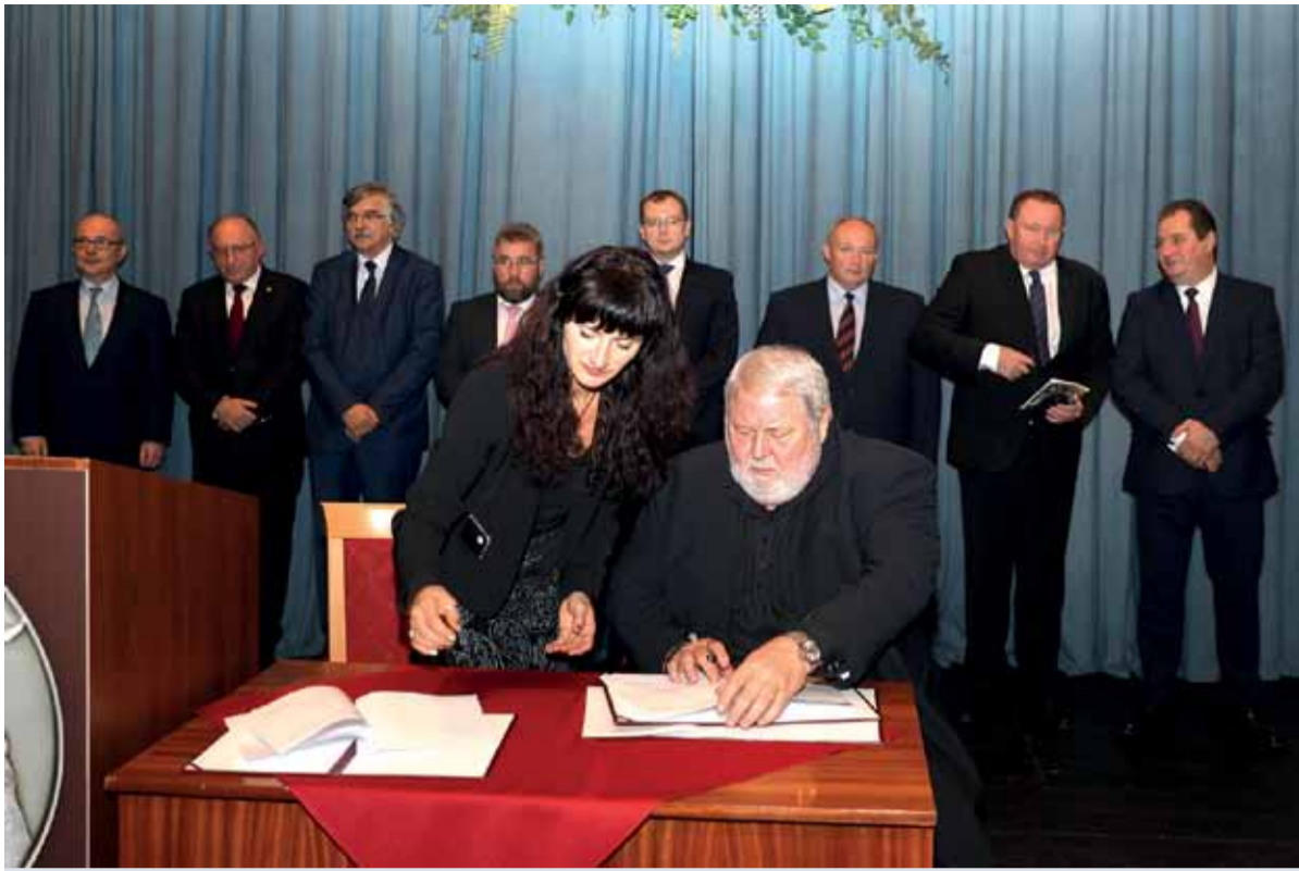
Pri podpise memoranda...