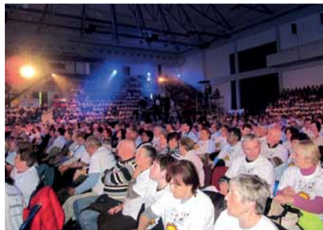
Železiari na koncerte