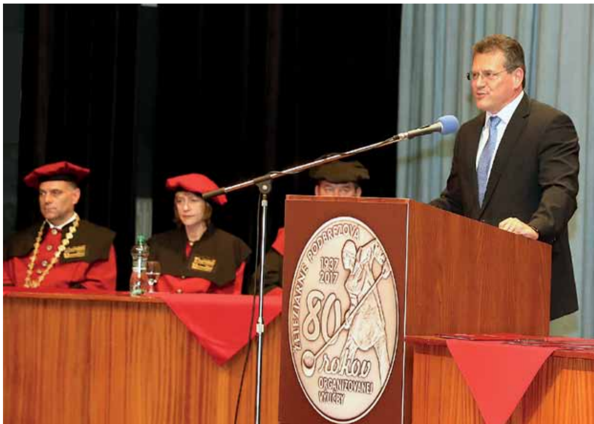
Maroš Šefčovič vo svojom vystúpení, okrem iného, konštatoval: „Model, ktorý sa tu v Podbrezovej dlho rozvíjal, je niečo, čo budeme musieť dobudovať na celom Slovensku.“