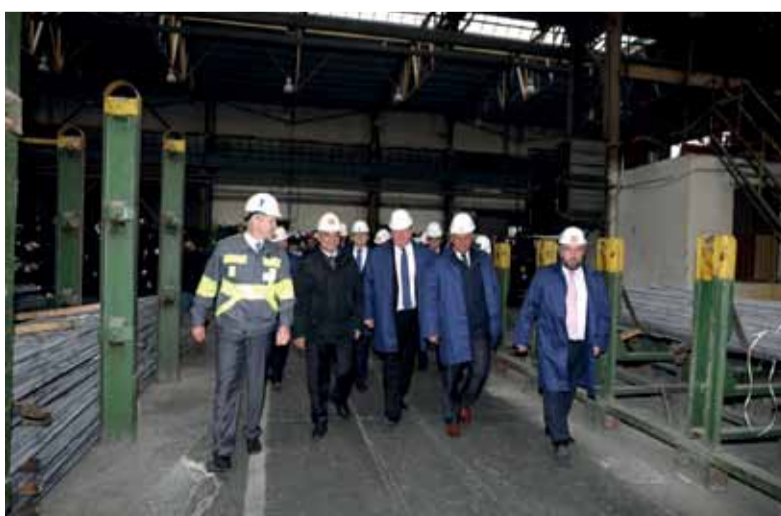
a oboznámili sa aj s výrobou v ŽP, kde žiaci získavajú odbornú prax