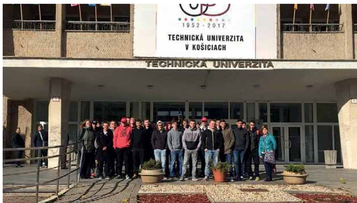
Maturanti súkromných škôl ŽP na návšteve v TUKE

Na ceste domov niektorí živo diskutovali o tom čo videli a ako to na nich zapôsobilo, preto verím, že sme žiakom pri ich budúcom rozhodovaní pomohli a mnohí už začali po tomto dni uvažovať nad štúdiom na fakulte.