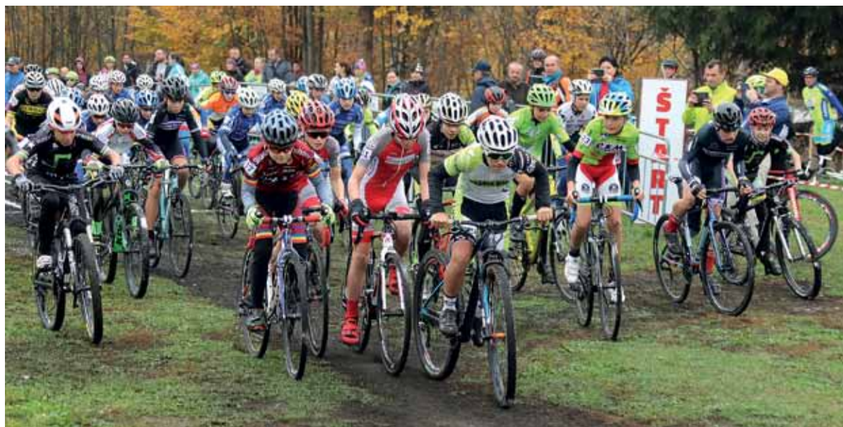
Na štart sa postavilo 231 pretekárov.