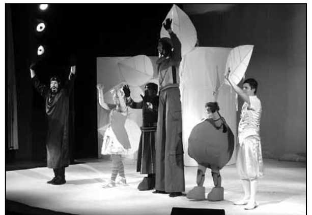
Dlhý, široký a bystrozraký zabavili aj naše deti na záver školského roka v Dome kultúry ŽP 27. júna popoludní.

S láskou a úctou spomínajú manželka, deti s rodinami a priatelia