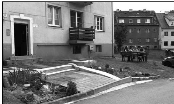
Ak je okolo domu poriadok, aj na lavičke vládne pohoda...