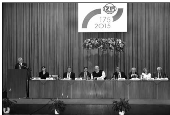
Dvadsať tretie valné zhromaždenie