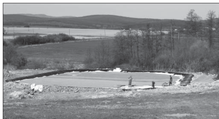
Sanácia miesta uloženia odpadov z výroby generátorového plynu