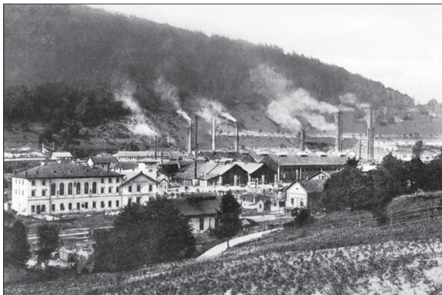
Pohľad na podbrezovské železiarne.

pri vysokopečnej prevádzke zotrúvalo pri drevenom uhli a vode, ako zdroji pohybovej energie, do hospodárskej krízy v roku 1857 sa naozaj podarilo zvýšiť produkciu surového železa 2,5 krát, a to rekonštrukciou vysokých pecí v Tisovci a Pohronskej Polhore. Tisovec dostal „pilierovú pec“ so silným valcovým dúchadlom poháňaným vodným kolesom a pražiarne rudy. Bola to jedna z najväčších pecí na Slovensku. Do nevýhody sa však dostali vysoké pece v Ľubietovej a v Ponikách, ktoré spracúvali málo kvalitnú rudu (výťažok predstavoval 21,25 percenta z rudy v ponickéj peci a 20,6 percenta v Ľubietovskej peci). Hospodárska kríza (1858 – 1861) a zlé vyhladky na zväčšenie železorumnej základne a dopravu kvalitnej rudy až k peciam, podkopali vysokú pec v Ponikách, ktorá začala byť veľmi stratovou. Erár v období krízy vsadil na vysoké pece v Hronci, ktoré boli v rokoch 1858 – 1862 zrekonštruované na tzv. „škótsky spôsob“. Došlo k ich zvýšeniu z pôvodných 9 na 12,5 metra, mali dúchadlá na parný pohon (tri parné stroje a ich kotly sa vykurovali kychťovými plynmi). Pece mali k dispozícii šesť pražiarní. Výrazne sa tak umožnilo šetrenie uhlím, od roku 1862 sa pri obidvoch zmodernizovaných peciach v Hronci miešalo drevené uhlie s drevom, čím klesali výrobné náklady. Počas ďalšej hospodárskej krízy, ktorá sa začala v roku 1873 vyhasla vysoká pec v Pohronskej Polhore, ktorej prevádzka sa pre vysoké náklady na dopravu železnej rudy z Gemera ukázala nerentabilnou.