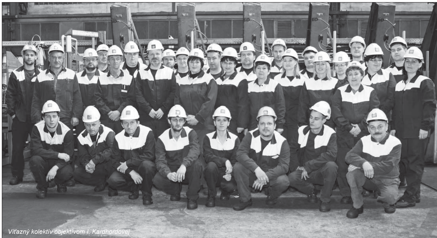
Vítazný kolektív