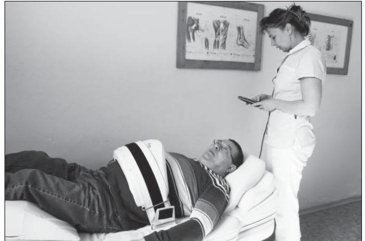
Špeciálny terapeutický postup - anulácia