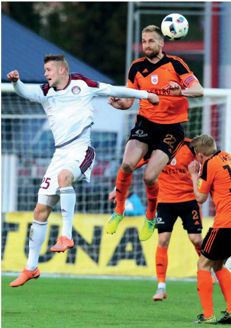
Naši hráči opäť využili domáce prostredie a predviedli proti Ružomberku peknú hru