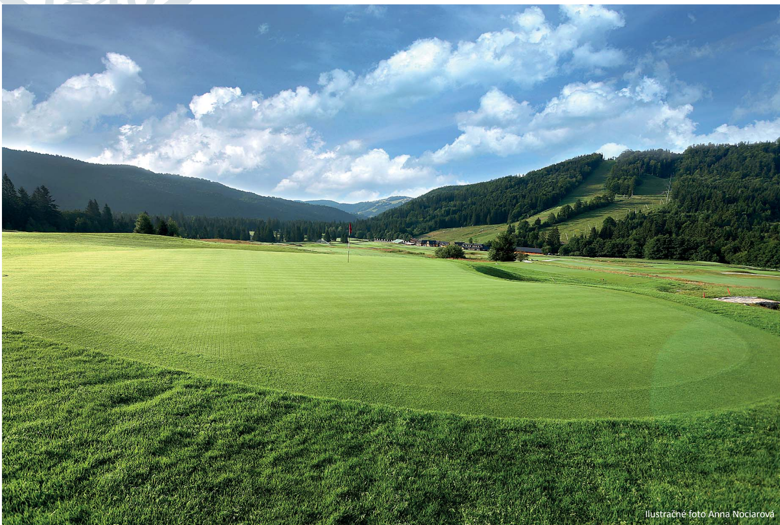
Ilustračné foto Anna Nociarová