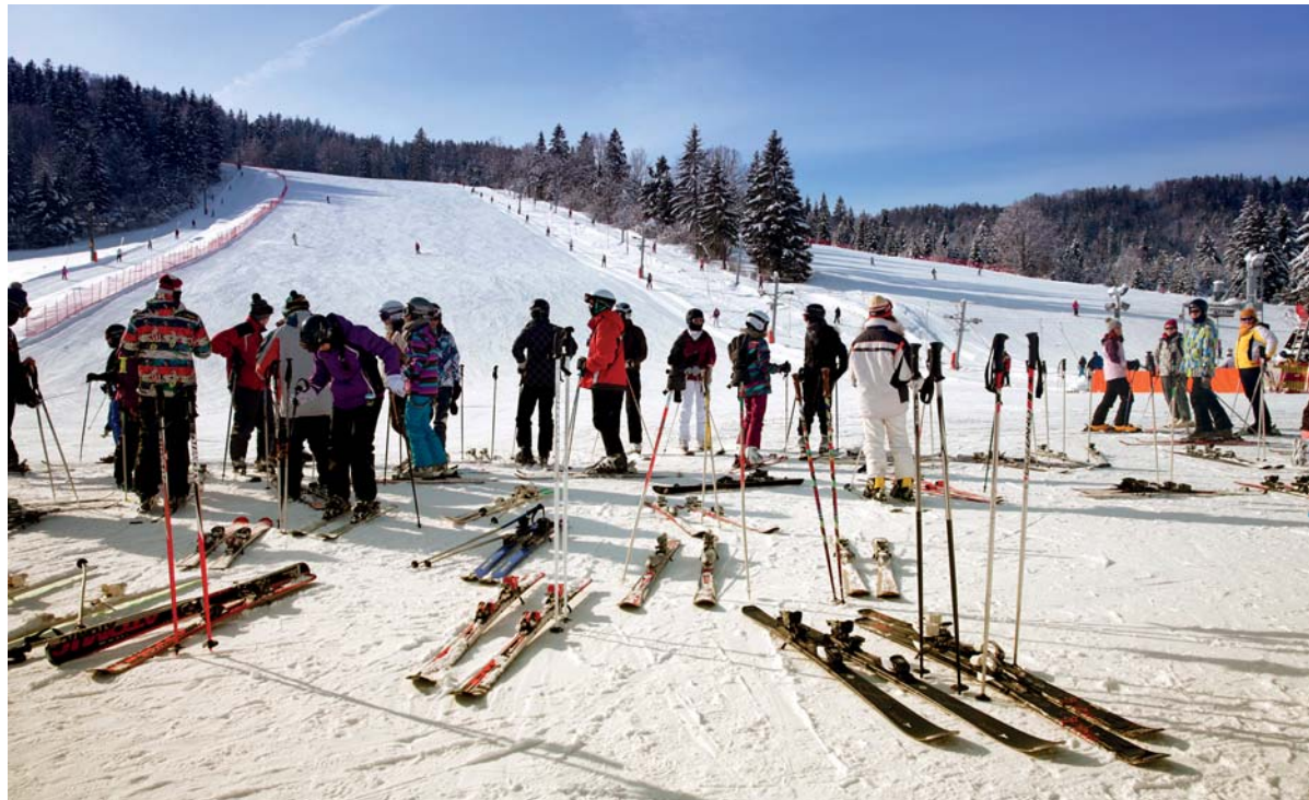
Zima na Táfoch

- Tak, ako nepochybne všetci, ktorí sa cestovným ruchom zaoberajú, želim si, aby si konečne kompetentní uvedomili, aký je u nás potenciál cestovného ruchu pre národné hospodárstvo. Možno by sme si mali uvedomiť, že tradičné destinácie, akými sú Egypt, Tunisko..., začínajú byť pre turistov nebezpečné. Vláňajšie štatistiky zaznamenali, že na Slovensko prišlo až o 78 percent viac turistov z Čiech, ako rok predtým. Chvalabohu, Slovensko patrí medzi bezpečné destinácie a je úžasné. Musíme si však uvedomiť, že mať krásnu prírodu dnes už nestačí. My musíme ponúkať kvalitné služby, vybudovanú infraštruktúru a bez pomoci štátu to zabezpečiť nedokážeme. Som presvedčený, že Slovensko by si mohlo nájsť stále miesto na mape cestovného ruchu. Potenciál na to nesporne má.