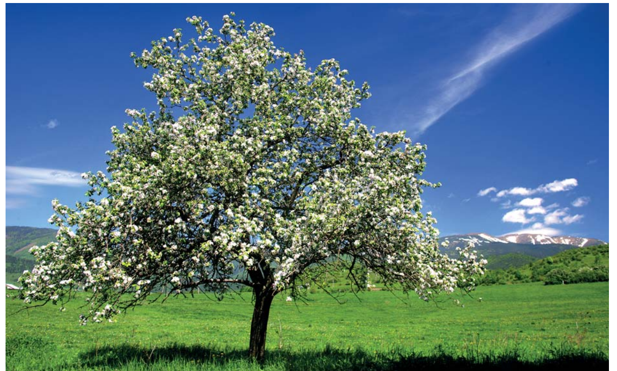
Ilustračné foto A. Nociarová

S májom sa spája množstvo práností a veľa je aj rôznych zvyklostí. Pre nás je predovšetkým mesiacom lásky, rozkvitnutej prírody, sviežej zelene a príležitosti na prejav úcty a vďaky svojim najbližším. Aj keď ste nestihli bozk pod rozkvitnutou čerešňou, želáme vám veľa čistej a úprimnej lásky, aby ste prežívali nielen májové dni, ale aj všetky nasledujúce v šťastí a s úsmevom na tvári.