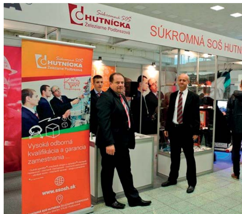
Študenti našich súkromných škôl sa zúčastnili prezentačno – predajnej výstavy. Čítajte na 4. strane