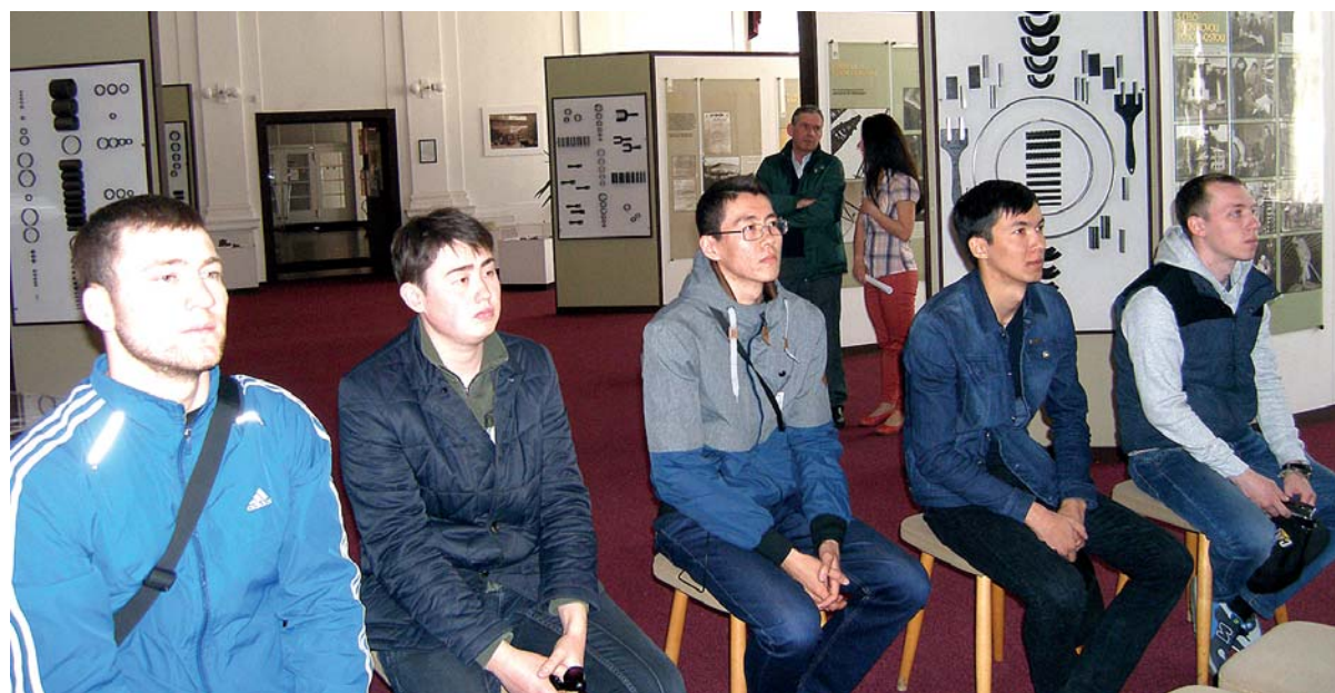
Študenti z Kazachstanu pri prehliadke hutníckej expozície objektívom V. Kúkolovej