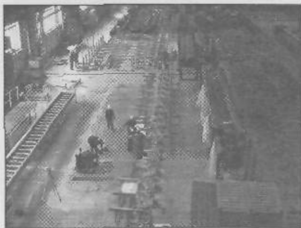
Montáž LKR prvej akostnej skupiny vo valcovni bezšvíkových rúr, v decembri uplynulého roka.

V centrálnej údržbe bol aj tohtoročný január veľmi rušný. V rámci prijatia novej organizačnej štruktúry, platnej od 1. januára 2008, totiž prebieha druhá etapa jej centralizácie. V čom spočíva a ako hodnotíte jej priebeh?