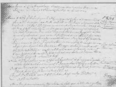
Historia Dómus 1838 – najstaršia zmienka o hudobných nástrojoch.