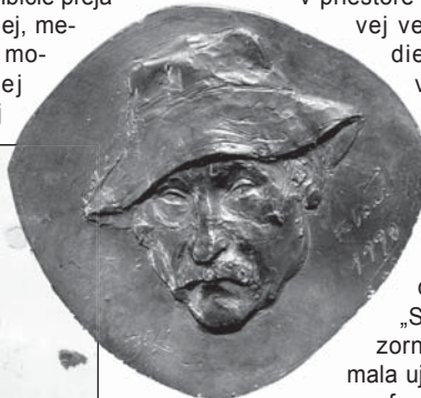
Autoportrét J. Kulicha, bronz