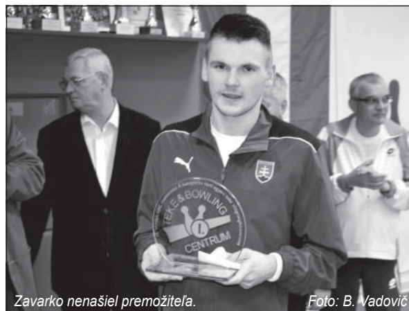
Zavarko nenašiel premožiteľa.