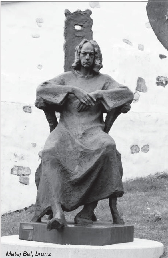
Matej Bel, bronz