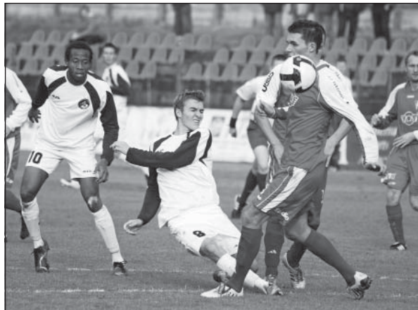
Podbrezovský 2. ligový tím prvý v tabuľke

livých činností, na rozširovanie rodiny partnerov ŽP Športu, ktorí budú ochotní podporiť dlhodobé snaženie Železiarni Podbrezová