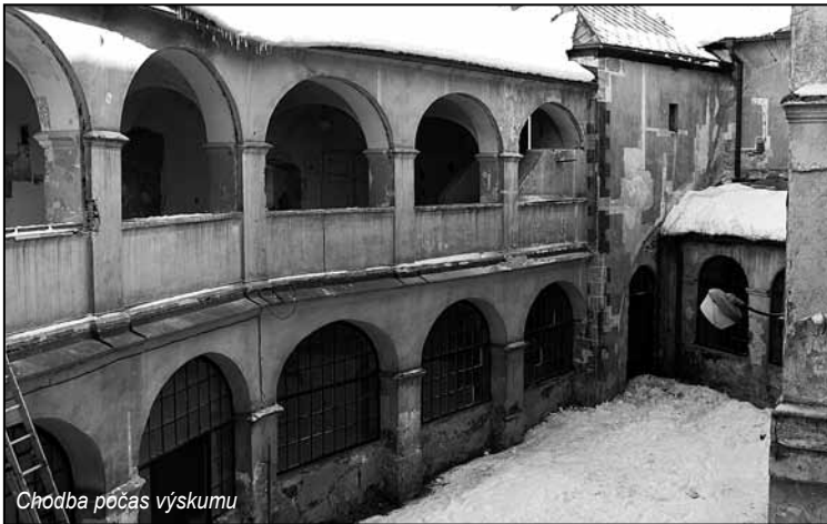
Chodba počas výskumu