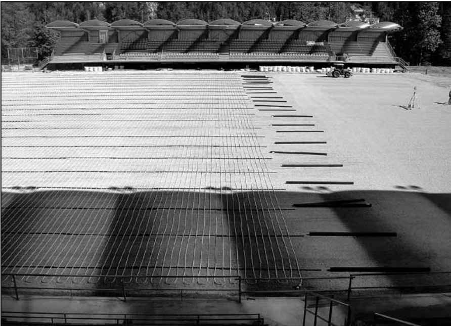
Montáž vykurovania, rozšírená severná tribúna, zatiaľ bez sedačiek.