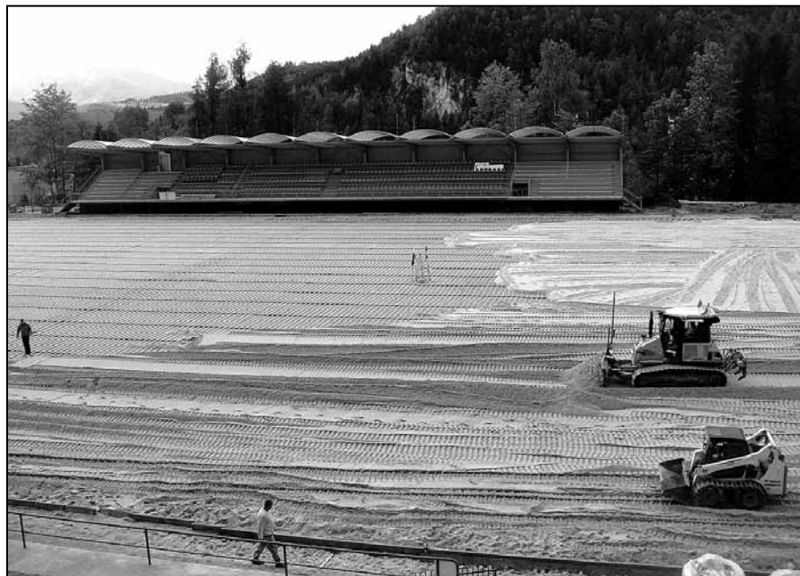
Rozprestieranie spodnej koreňovej vrstvy..

Nového, čím privíta futbalový štadión svojich návštevníkov, je skutočne dosť. Zostane už len v nohách našich futbalistov, aby umocnili v tých, ktorí im vytvárajú všetky podmienky, ale aj vo fanúšikoch, ktorí túžia vidieť dobrý futbal, skutočný pocit, že si to všetko zaslúžia.