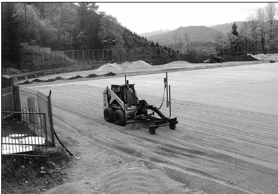
Výstavba celoplošnej odvodňovacej sústavy...