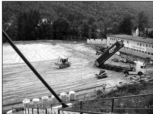
Dovoz materiálu na spodnú koreňovú vrstvu...

Medzi kritériami sú nepochybne aj ďalšie bezpeč-