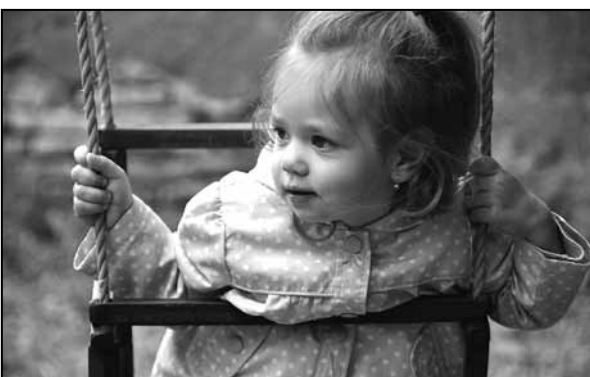
Tak to som zvedavá, či mi pripravíte prekvapenie na MDD