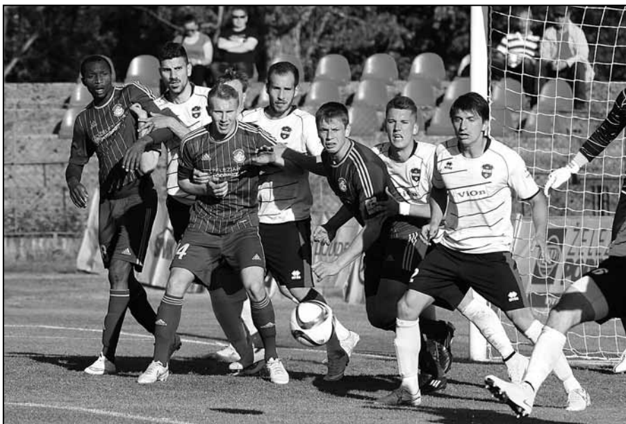
Z domáceho zápasu s ViOn Zlaté Moravce