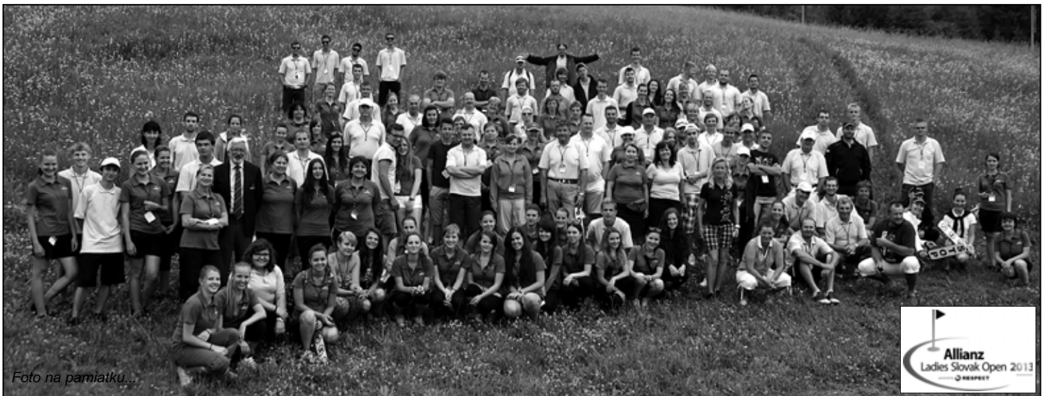
Foto na pamiatku...