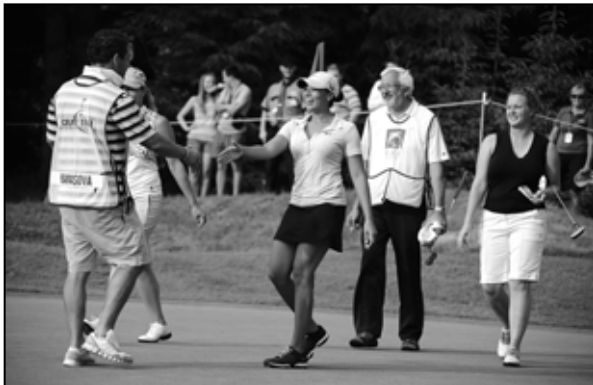
Veľkú pozornosť pútala americká golfistka Cheynne Woodsová