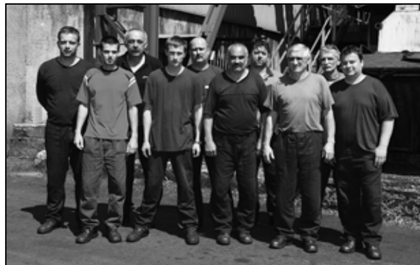
Kolektív zmeny A vo valcovni rúr

zariadenia, tak aj vyhodnotenie plnenia ukazovateľov sa robilo podľa jednotlivých prevádzkarní. V minulom roku sa víťaz