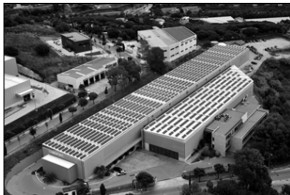
Nove priestory v Arenys de Mar