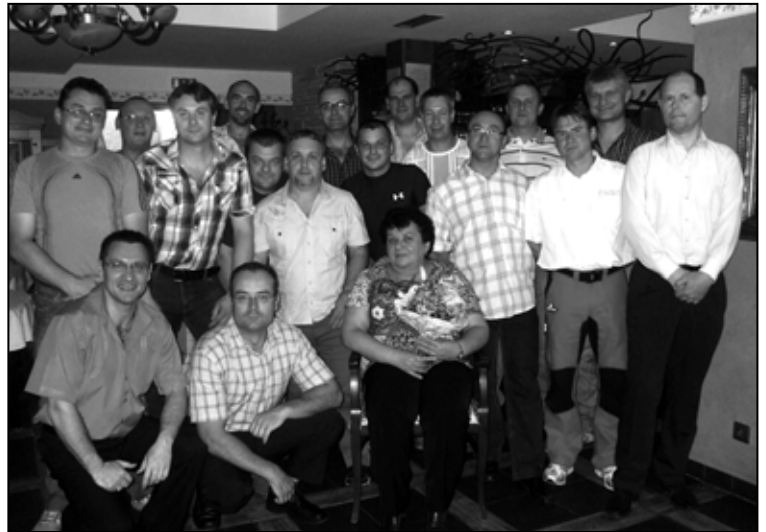
Dnes na prahu štyridsiatky...

Keď sme v máji 1992 maturovali v SOUH Podbrezová – Lopej, odbor: hutník operátor pre tvárnenie kovov, ani sme nad tým nerozmýšľali či a kedy sa chceme stretnúť po rokoch. Tak som sa rozhodol, že by už bolo načase a 8. júna v reštaurácii Alžbetka v Brezne sme sa stretli po dvadsaťjeden rokoch. Neprišli všetci, no na prvýkrát to bola