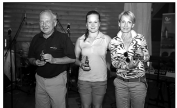
V ProAm obsadili tretie miesto.