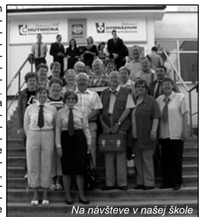
Na návšteve v našej škole

sa dvoch vyučovacích hodín spolu s našimi študentmi. Vyskúšali si interaktívne tabule, nazreli do učebníc a zošitov, oboznámili sa s novými metódami vyučovania. Ich prítomnosť oživila a spríjemnila vyučovanie, ktoré obohatili aj svojimi vedomosťami. Pri prehliadke škôl mali možnosť nahliadnuť do učební, tried a dielni odborného výcviku, vyskúšali si posilňovacie stroje aj golfovú trenážer. Neobišli ani školskú jedáleň, v ktorej si vychutnali obed. Počas besedy so študentmi spomínali na svoje žiacke časy, predstavili svoje aktivity v Dennom centre, priniesli množstvo