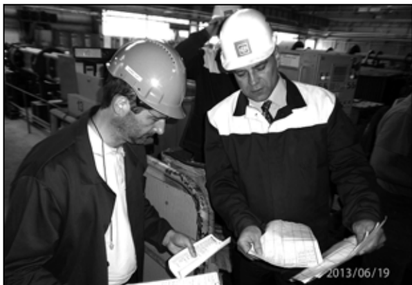
Preverovanie výrobného procesu v ťahárňach rúr