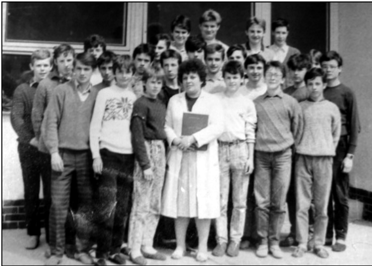
Ešte mladí študenti...