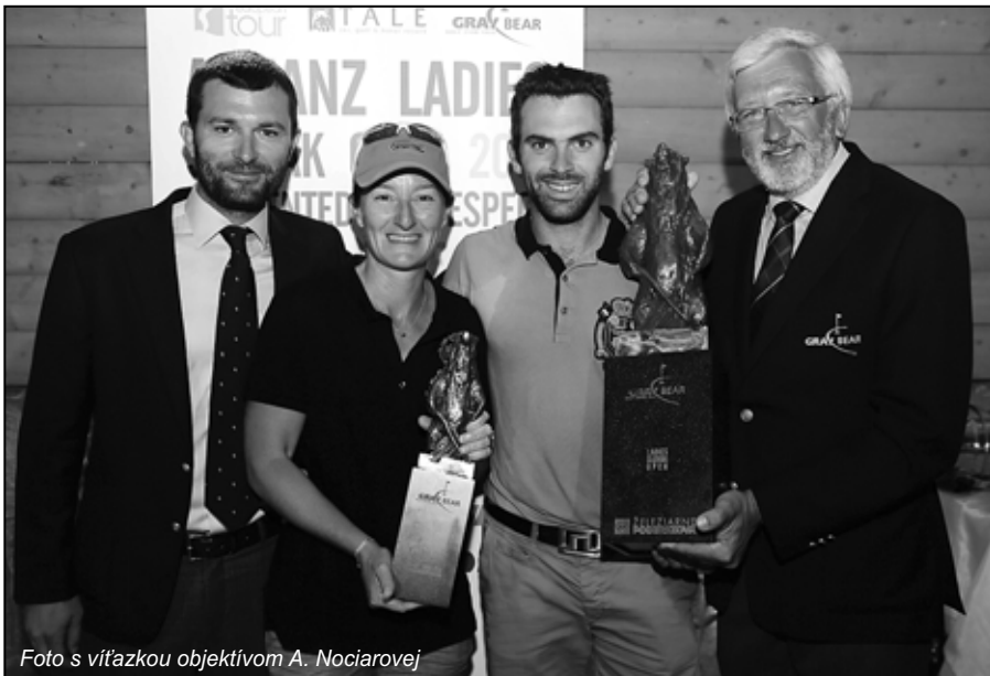
Foto s víťazkou