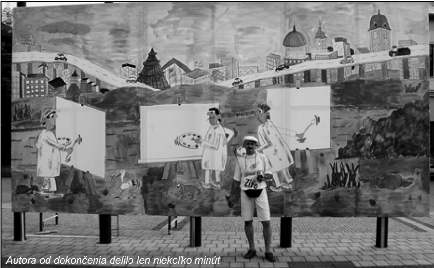
Autora od dokončenia delilo len niekoľko minút