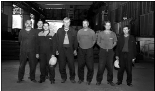
Kolektív zmeny C v oceliarni