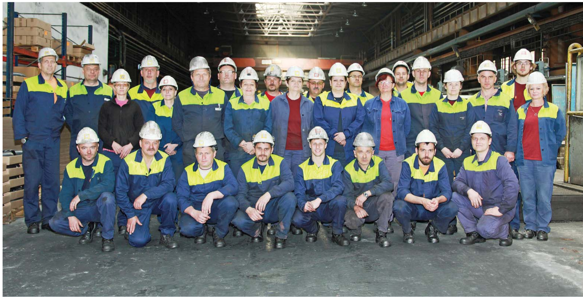
Víťazná zmena B strediska oblúkareň

“ Postupne by mohlo dochádzať k zlepšeniu a oživeniu trhových podmienok.