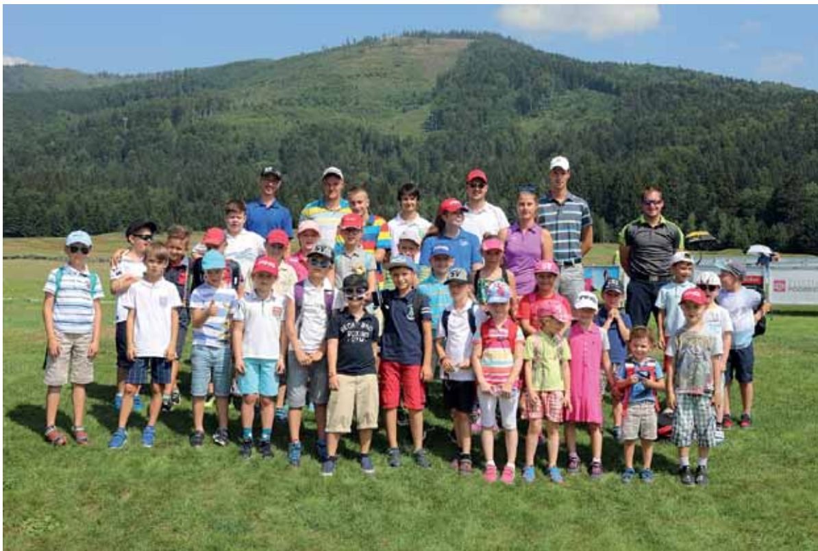
Účastníci golfového tábora.