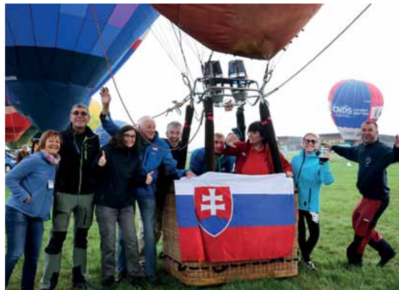
Pred štartom posledného kola (to sme ešte boli vo vedení súťaže) s domácimi fanúšikmi.

bola medzinárodná súťaž. Našej posádke sa darilo viesť priebežné poradie až do záverečnej disciplíny. Tá im bohužiaľ už nevyšla, skončili na 9. mieste. Stali sa však súčasťou vytvorenia nového svetového rekordu, veľkolepého masového štartu 456 teplovzdušných balónov zo sedemdesiatich krajín sveta.