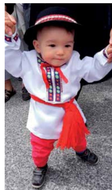
Mám už kroj. Je rusnácky, klobúčik mám goralský, asi budem folklorista.

Železiarne Podbrezová čítajte na 8. strane