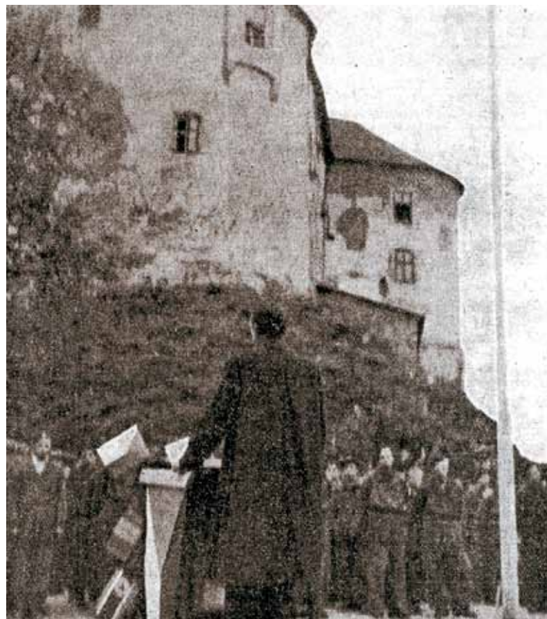
Otvorenie strediska pracujúceho dorastu na hrade Ľupča.

Správne odpovede posielajte do redakcie Podbrezovan do desiatich dní od vydania. Nezabudnite uviesť kontakt. Žrebovanie o lákavú cenu sa uskutoční na konci súťaže. Podmienkou je účasť vo všetkých súťažných kolách.