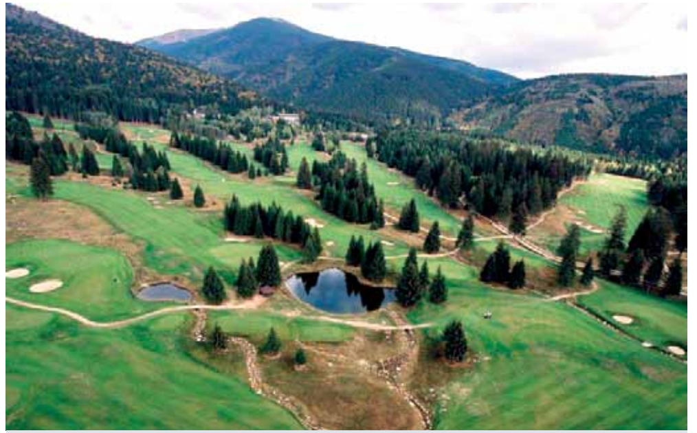
A takto dnes.