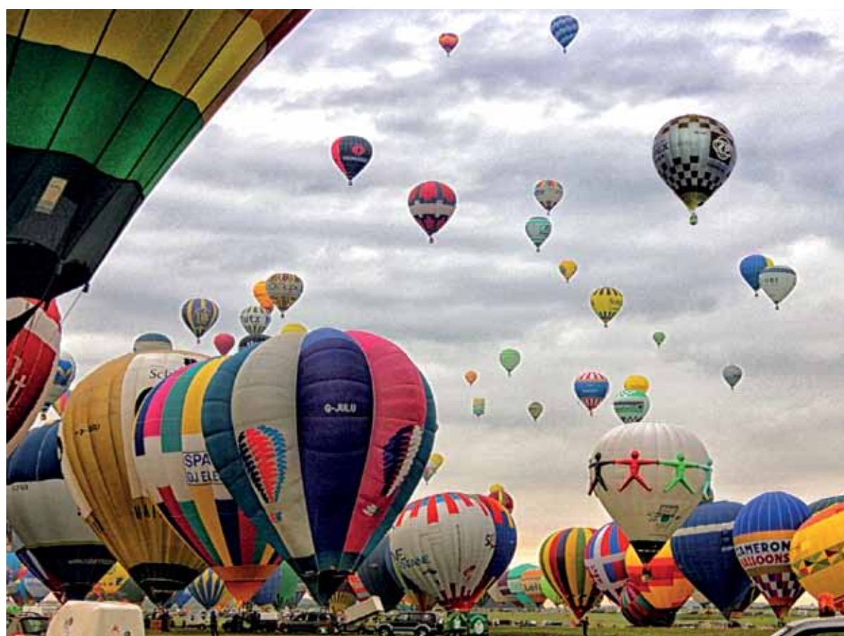
Na najväčšom podujatí teplovzdušných balónov v Európe.

Liečebné procedúry: relaxačný program na dve noci 3 procedúry za pobyt (1x termálny kúpeľ – zrkadlisko, 1x čiastočný bahenný zábal, 1 klasická masáž – čiastočná), tri noci 4 procedúry za pobyt (1x termálny kúpeľ – zrkadlisko, 1 čiastočný bahenný zábal, 1 klasická masáž – čiastočná, 1x hydroterapia), štyri noci 6 procedúr za pobyt (1x termálny kúpeľ – zrkadlisko, 1x čiastočný bahenný zábal, 1x klasická masáž – čiastočná, 1x hydroterapia/perličkový kúpeľ, 1x soľná jaskyňa/oxygenoterapia, 1x severská chôdza/skupinový telocvik), päť nocí 8 procedúr za pobyt (2x termálny kúpeľ – zrkadlisko, 1x čiastočný bahenný zábal, 2x klasická masáž čiastočná, 1x hydroterapia/perličkový kúpeľ, 1x soľná jaskyňa/oxygenoterapia, 1 severská chôdza/skupinový telocvik), šesť nocí 9 procedúr za pobyt (2x termálny kúpeľ – zrkadlisko, 1x čiastočný bahenný zábal, 2x klasická masáž čiastočná, 1 hydroterapia/perličkový kúpeľ, 1x soľná jaskyňa/oxygenoterapia, 2x severská chôdza/skupinový telocvik), sedem nocí 11 procedúr za pobyt (2x termálny kúpeľ – zrkadlisko, 1x čiastočný bahenný zábal, 2x klasická masáž čiastočná, 3x hydroterapia/perličkový kúpeľ, 1x soľná jaskyňa/oxygenoterapia, 2x severská chôdza/skupinový telocvik).