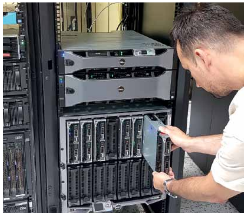
Inštalácia servera v novej infraštruktúre