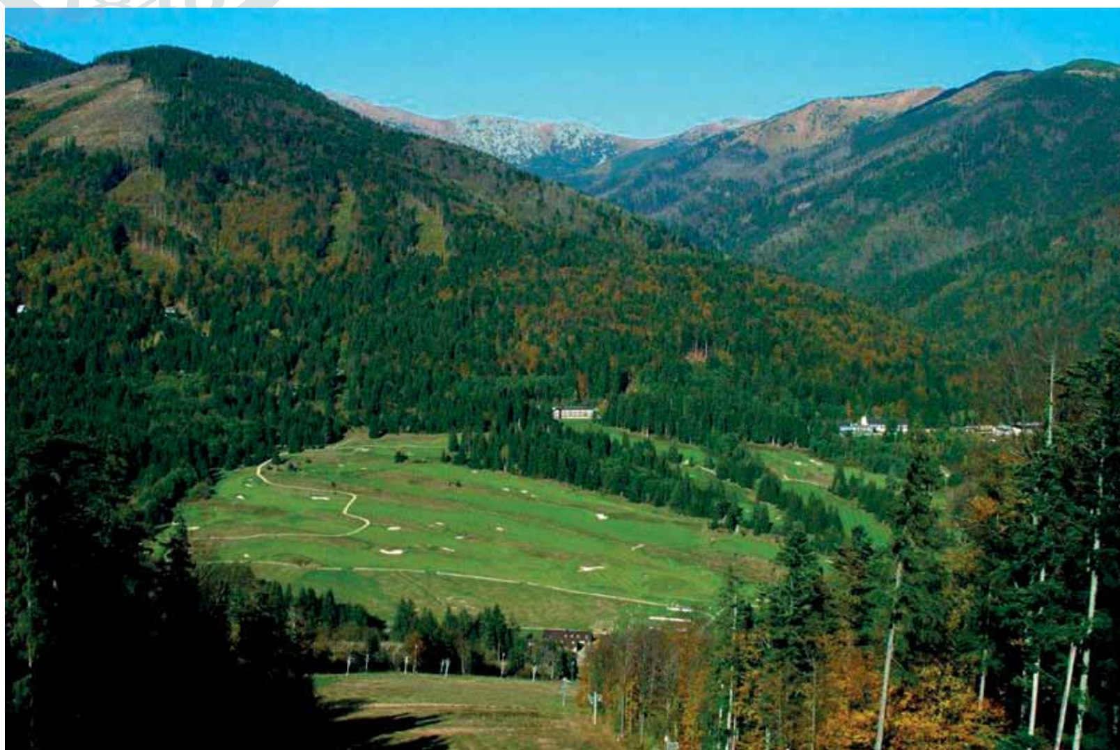
Železiarne Podbrezová vybudovali komplex, ktorý víta návštevníkov v každom ročnom období.