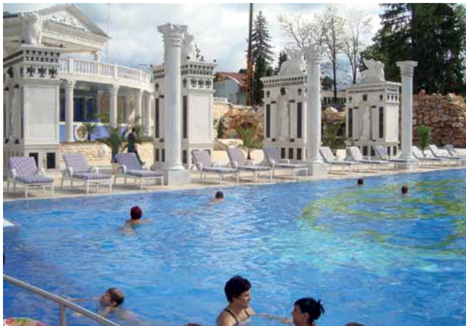
Rajecké Teplice

Pri pobyte v Aphrodite a Aphrodite Palace je voľný, neobmedzený vstup do vodného a saunového sveta, aj do fitnes.