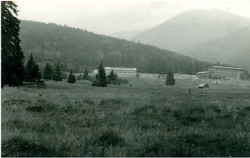
Takto to vyzeralo na Táľoch v roku 1965.