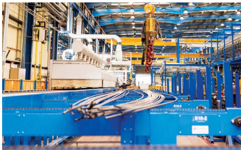
Vstupný dopravník do žihacej pece.

Nemecké oceliarske odvetvie vidí v tomto roku významné riziká pre oceliarsku konjunktúru. Pre rok 2017 ráta odvetvový zväz WV Stahl s ľahkým zvýšením výroby surovej ocele o zhruba 1,0 percento na 42,7 milióna ton, pripomína však, že situácia je aj naďalej veľmi nebezpečná. Z vysokého súčasného vyťaženia nie je možné robiť ešte žiadne závery na bezprostrednú hospodársku situáciu. Konjunktúrny výhľad je spojený s neobčyčajne vysokou neistotou. K tomu prichádza ešte aj vysoká volatilita na surovinových trhoch, hlavne pri surovinách, ako je železná ruda a koksovateľné uhlie.