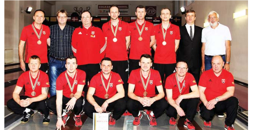
Mužstvo kolkárov ŽP Šport po zisku tretieho miesta v tohtoročnom Final four Ligy majstrov.

V prvom semifinále na seba narazili maďarský Szeged a chorvátsky Zaprešić. Po lepšom začiatku Chorvátov zápas Maďari v druhej polovici rýchlo otočili a mohli sa radowať z postupu do finále, po víťazstve 6:2. V druhom semifinále nastal očakávaný súboj nemeckého šampióna zo Zerbstu proti domácej Podbrezovej. Vo vyrovnanom zápase videli diváci v zaplnenom Dome športu ŽP napínavý zápas až do posledných hodov, ktoré nakoniec tesne rozhodli o víťazstve Zerbstu 5:3. V súboji o 3. miesto