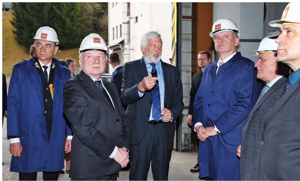
Pri prehliadke výrobných prevádzkárň

„Veľmi si vážim, že vedenie tejto spoločnosti myslí aj na región.“