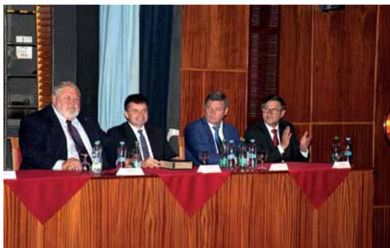
Zo slávnostného aktu odovzdávania vysvedčení úspešným absolventom našich súkromných škôl a ich prijatia do rodiny železiarov