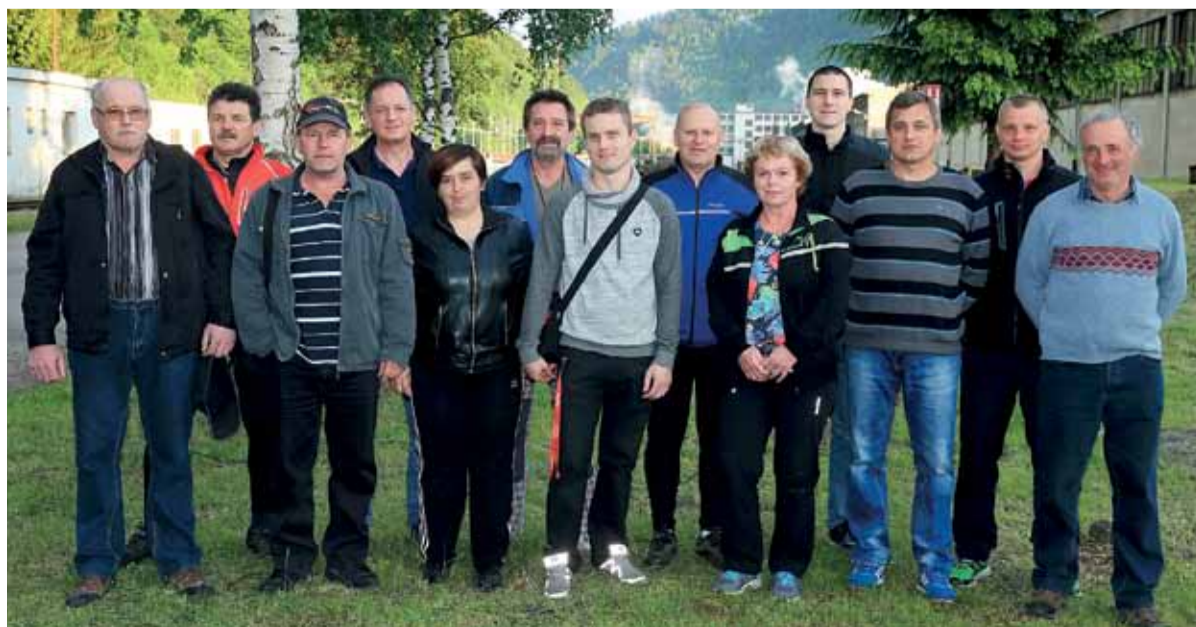
Víťazná zmena