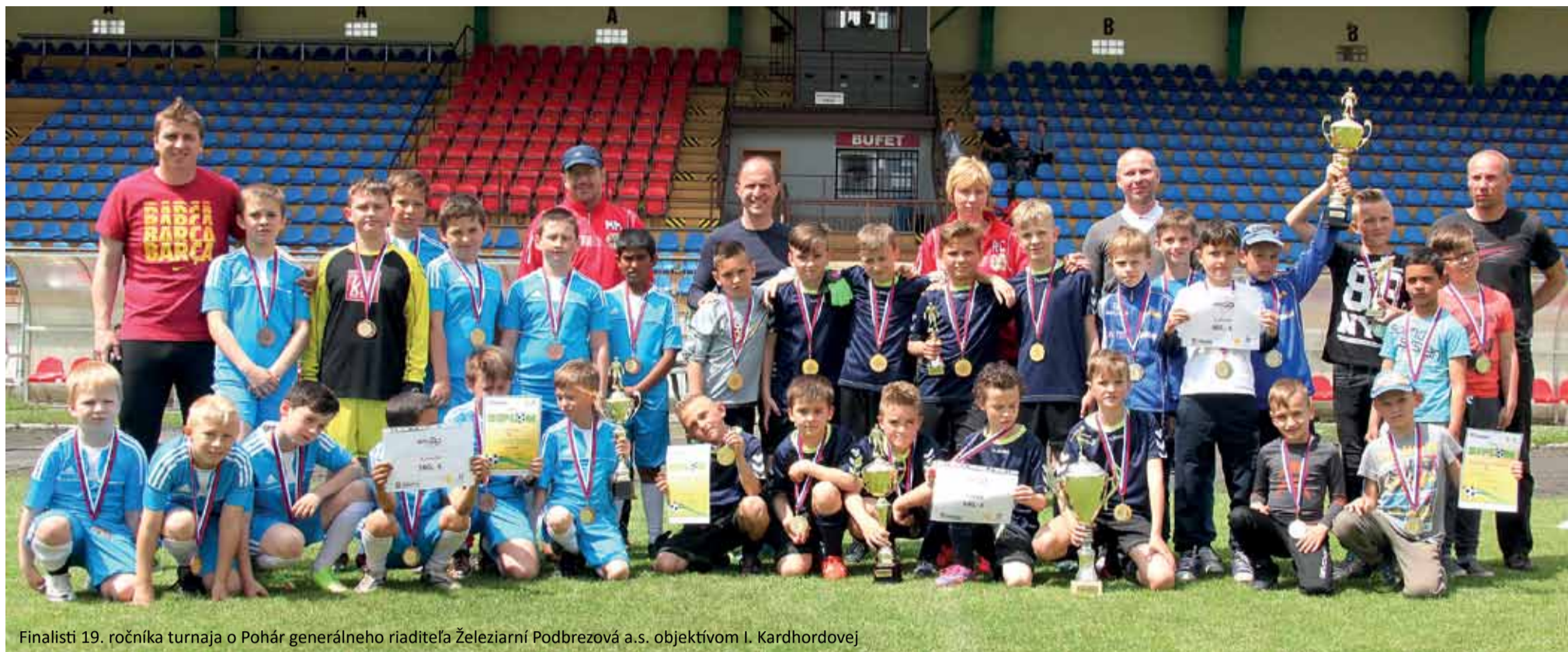
Finalisti 19. ročníka turnaja o Pohár generálneho riaditeľa Železiarní Podbrezová a.s.

Ocenení boli finalisti, aj každá zúčastnená základná škola