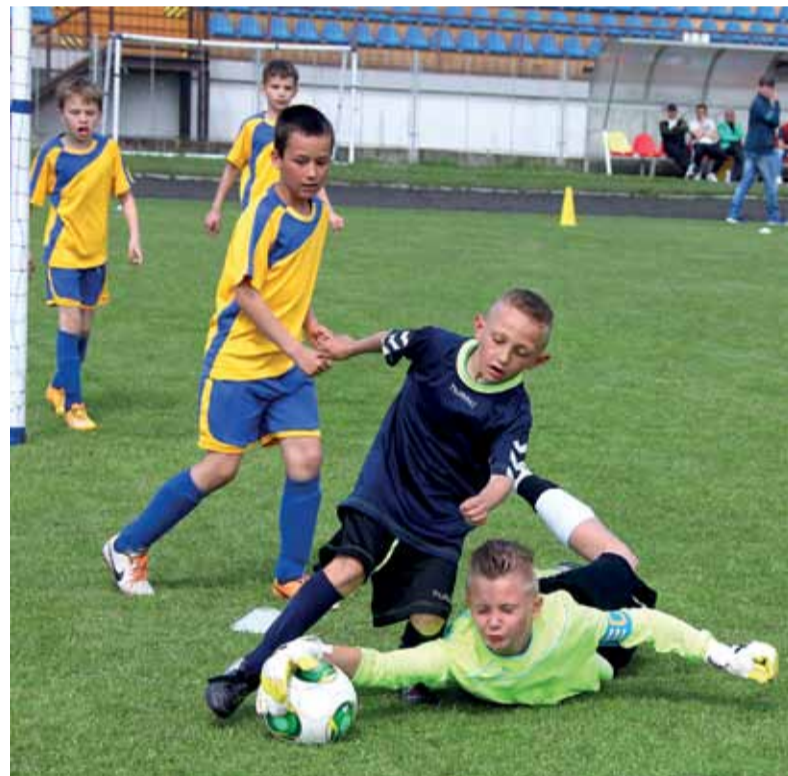
Stalo sa už pravidlom, že ten lepší z duelu medzi ZŠ Pionierska 2 (tmavé dresy) a ZŠ K. Rapoša sa stáva aj víťazom turnaja

- Ako rozhodca pôsobím už 25 rokov a aj v tomto turnaji možno patrí k najstarším aktívnym účastníkom, veď som tu každoročne od jeho nultého ročníka. Pracovať s týmito deťmi, to je pre mňa zábava. Chlapci, ktorí začínali pred niekoľkými rokmi sú už ďaleko v súťažiach a je pekné, že sa na Horehroní našli talenty, ktoré dokázali zúročiť svoje snaženie nielen v našom regióne, ale aj vo vyšších súťažiach. Som rád,