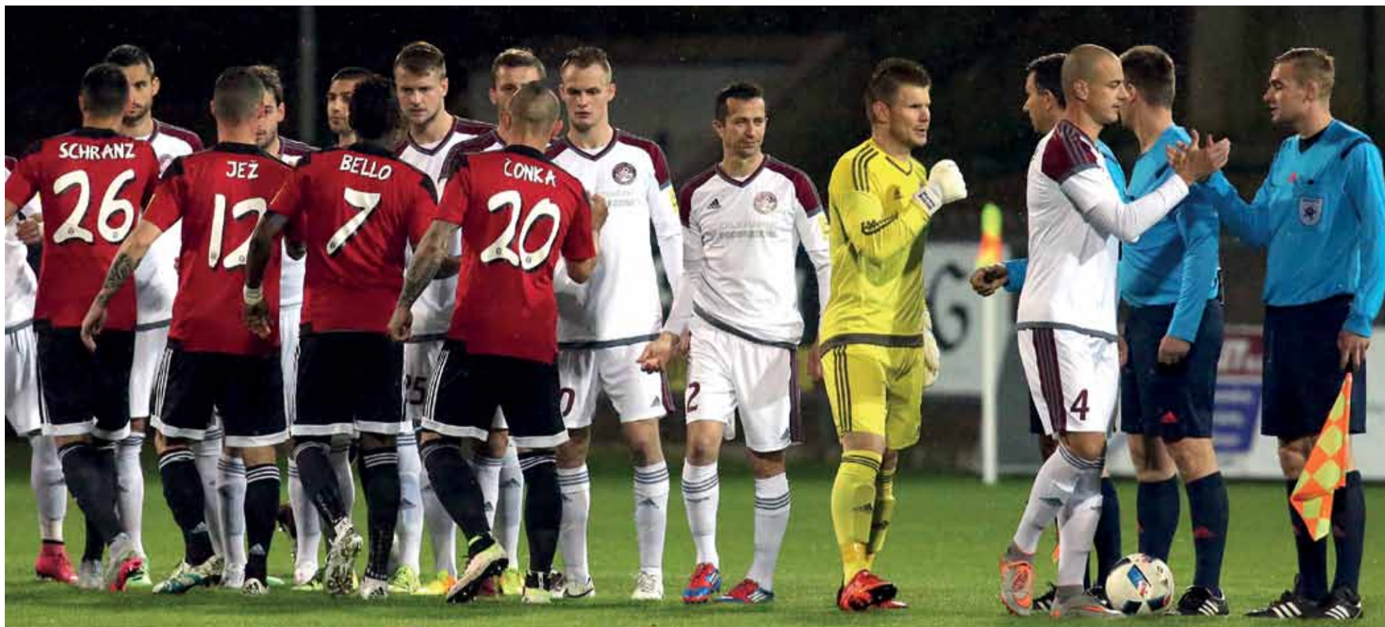
V 32. kole železiar doma naplno bodoval so Spartakom Trnava (3:0).