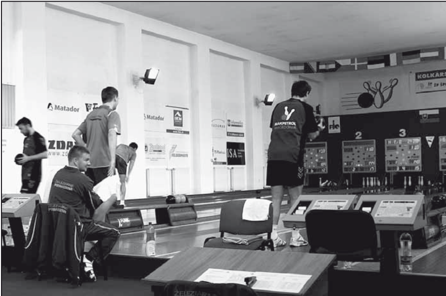
Prvé kolo Ligy majstrov objektívom I. Kardhordovej