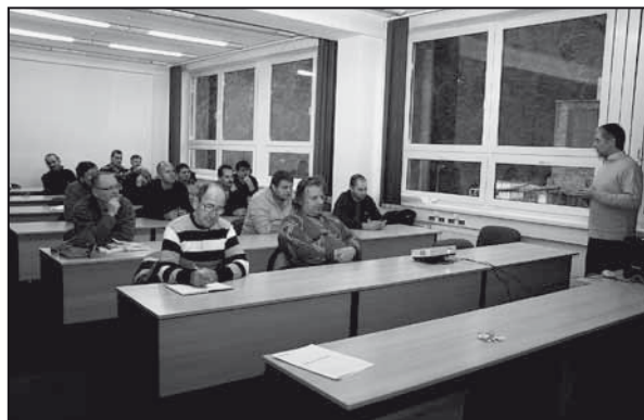
Školenia k novelizácii smernice prebiehali koncom novembra a začiatkom decembra v starom i novom závode.

cel! Svojou činnosťou nesmiem vyrábať nekvalitný výrobok, a ani ohrozovať seba, svoje zdravie, alebo zdravie iných osôb!