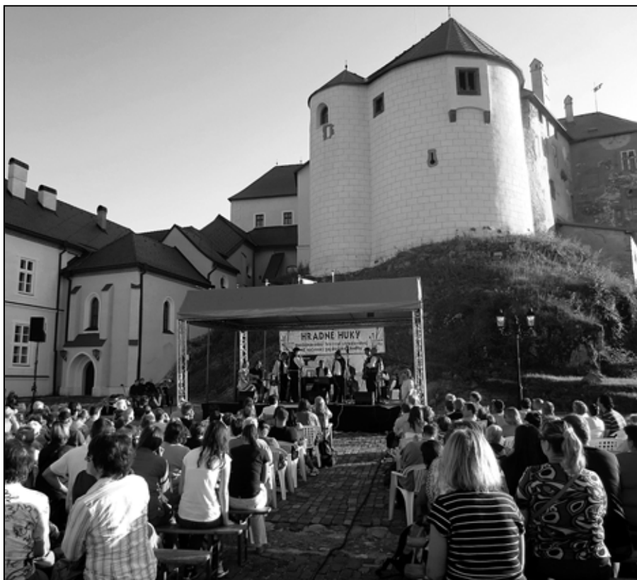
Na Hrade Ľupča zazneli uplynulý víkend opäť zvuky gájd. Čítajte na 7. strane.