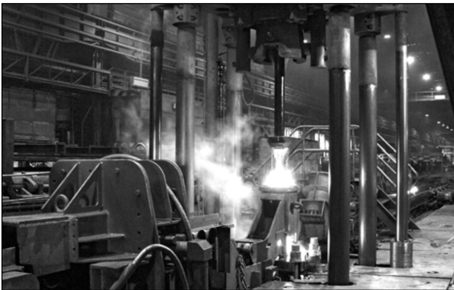
Lisovanie polotovaru v hydraulickom dierovacom lise.