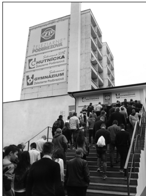
Čo prináša nový školský rok? Čítajte na 2. strane.