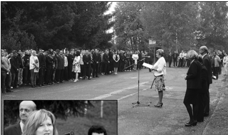
V súkromných školách ŽP v tomto roku študuje 447 žiakov, z toho v gymnáziu 151 a v strednej odbornej škole hutníckej 296