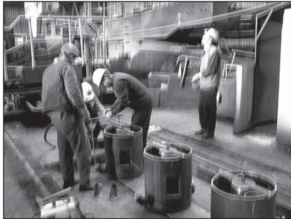
Montáž termoizolačných boxov na plošine ZPO zamestnancami centrálnej údržby

- V rámci investičného plánu sme v novembri pokračovali s prácami na príprave výroby nových dielcov a na úpravách telies kryštalizátorov a segmentov sekundárneho chladenia pre plánované skúšobné liatie nového formátu kvadrátu 125 milimetrov. Termín skúšobného liatia je predbežne