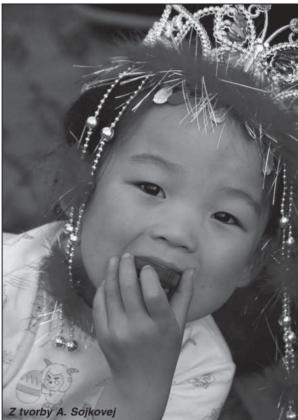
Z tvorby A. Sojkovej