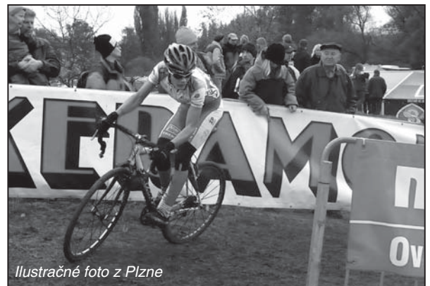
Ilustračné foto z Plzne