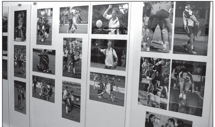
Na výstave Stretnutie prezentovali naše fotografky svoju tvorbu z oblasti športu

A touto cestou sa chcem poďakovať svojej rodine a svojmu zamestnávateľovi, že mi to umožňujú. Ďakujem.