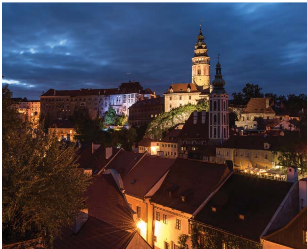
Nočný Český Krumlov