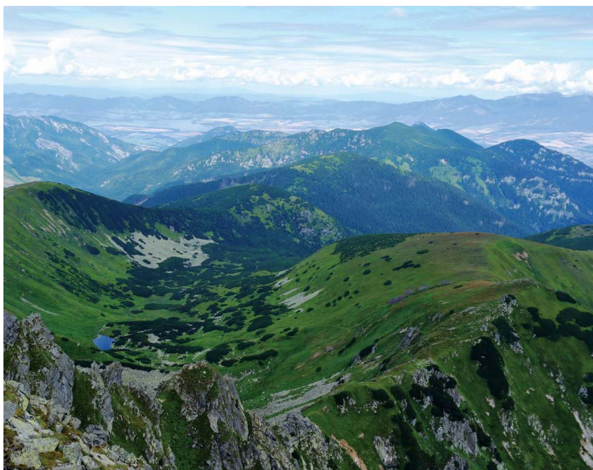
Nízke Tatry