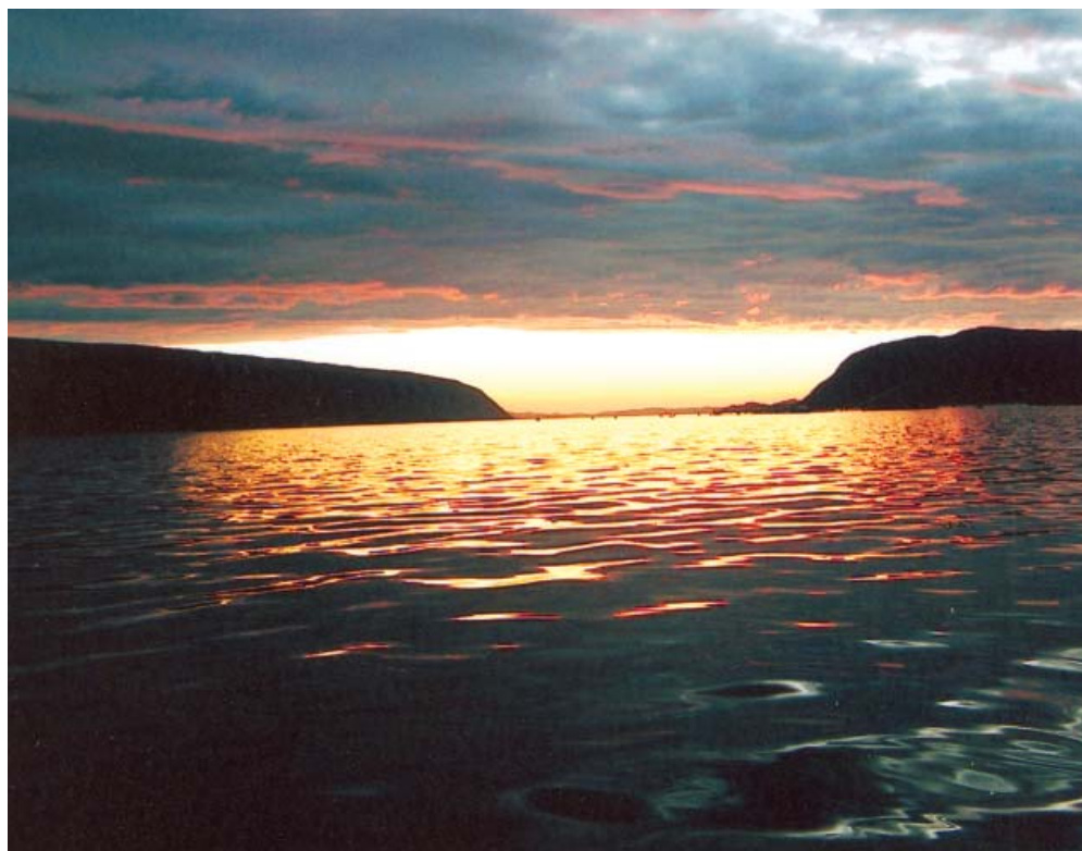
Nočné ráno v nórskom fjarde