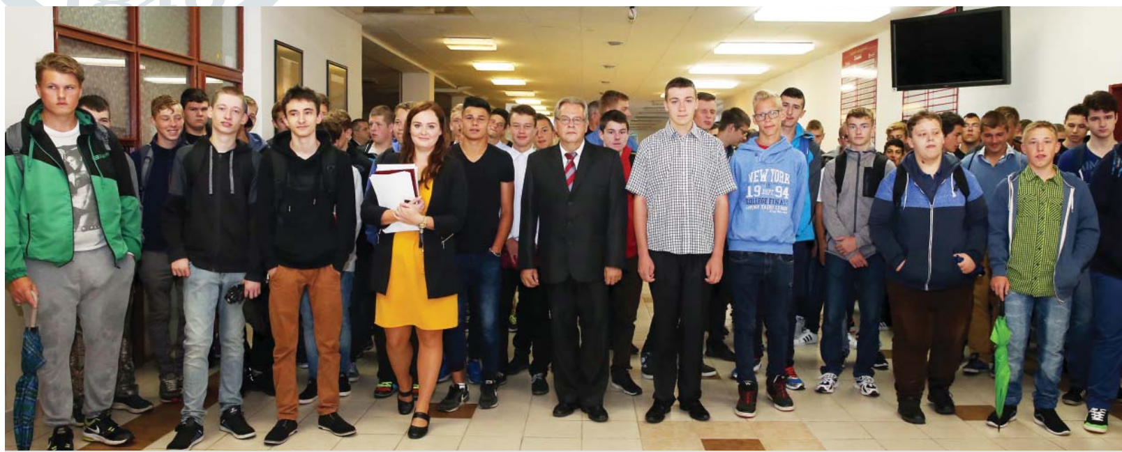
Prváci mali spočiatku zmiešané pocity