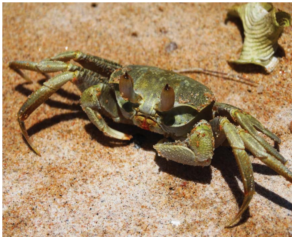
Plážový router (Egypt 2016)