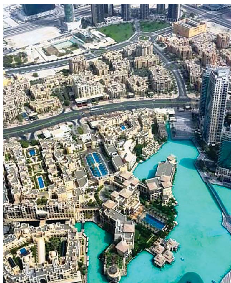
Výhľad z najvyššej veže sveta Burj Khalifa v Dubaji (SEA)