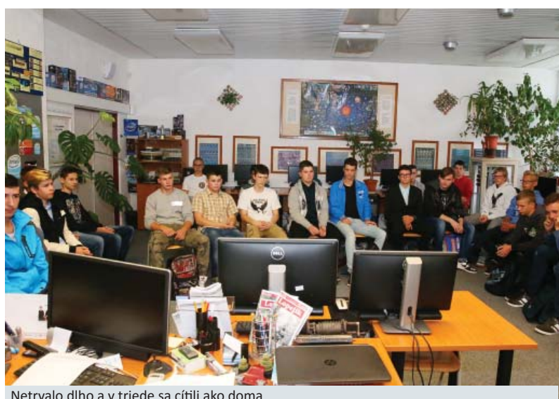
Netrvalo dlho a v triede sa cítili ako doma