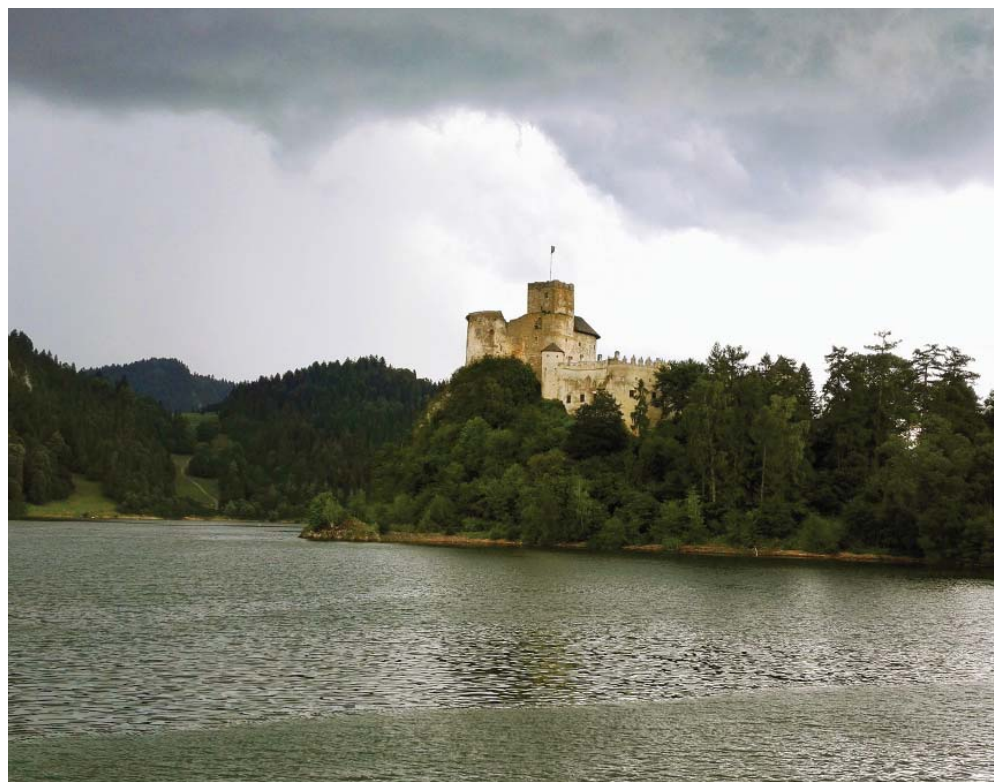
Chvíľa pre búrkou v Niedzici (Poľsko)