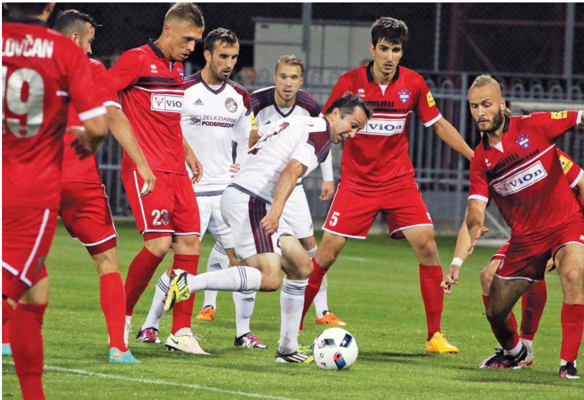
So Zlatými Moravcami objektívom I. Kardhordovej