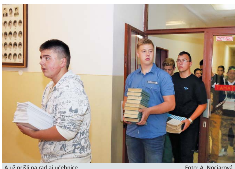
A už prišli na rad aj učebnice.