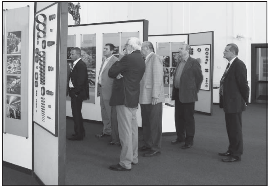
Z návštevy členov Predstavenstva Slovenskej obchodnej a priemyselnej komory 17. mája 2012

Vyvrcholením plánovaných podujatí bol 12. máj, v ktorom boli brány hutníckeho múzea otvorené pre všetkých. Už tradične sa ho zúčastnili naši