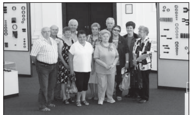
Deň otvorených dverí Hutníckeho múzea ŽP bol príležitosťou nielen načrieť do histórie, ale aj milých stretnutí s bývalými kolegami a zaspomínať si na zašlé časy...