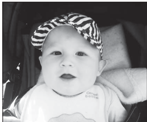
Dnešný deň patrí deťom a my im k ich medzinárodnému dňu želáme hlavne veľa rodičovskej lásky