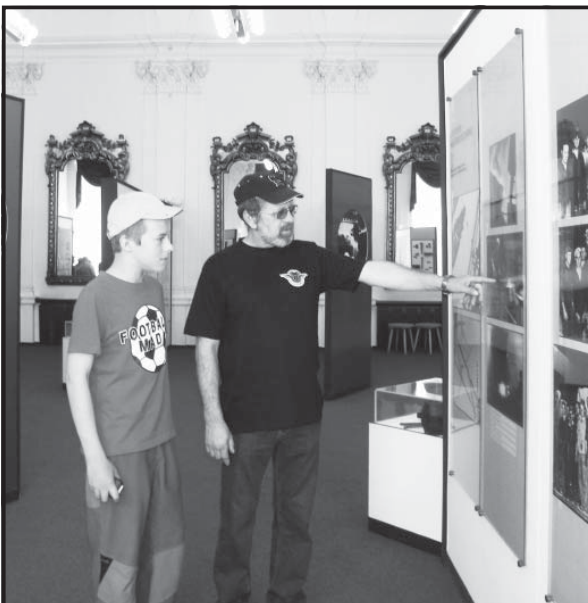
Vidíš, takto to tu vyzeralo pred sedemdesiatimi rokmi...