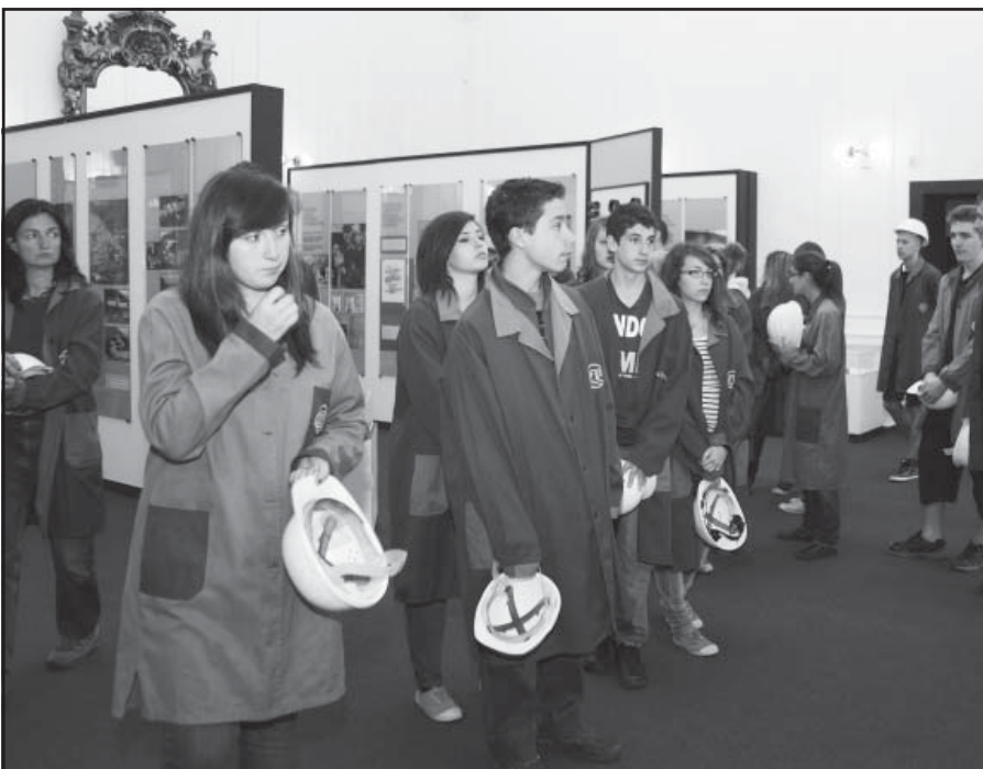
Privítali sme aj francúzskych študentov