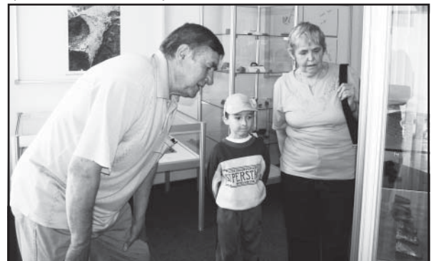
Vnúčika zaujímalo, kde robil jeho prastarý a starý otec, tety, ujovia a v súčasnosti aj otec