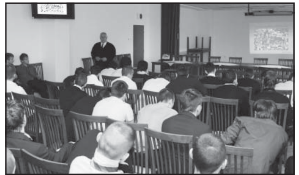
Besedy prebiehali v našich súkromných školách 23. a 27. apríla a v ZŠ Podbrezová 7. mája 2012