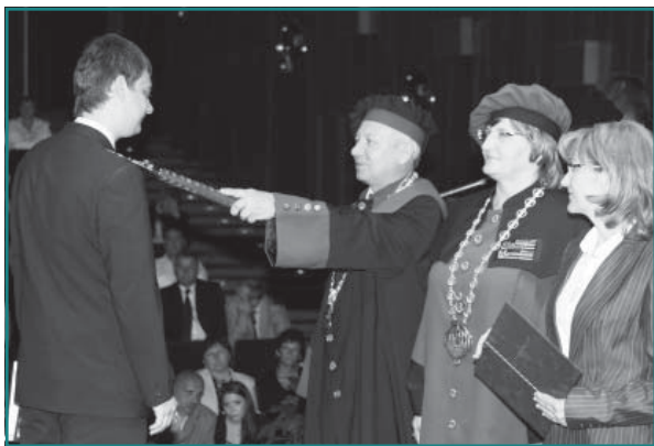
„Pasovanie“ do rodiny železiarov...