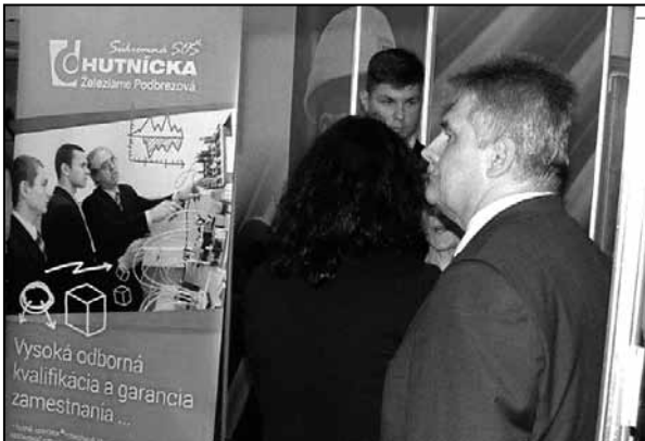
Minister PSVaR v našom stánku

V dňoch 28. až 30. apríla 2015 sa Súkromná stredná odborná škola hutnícka Železiarne Podbrezová, Súkromné Gymnázium Železiarne Podbrezová a Železiarne Podbrezová a.s., zúčastnili na 23. ročníku celoštátnej predajno - prezentačnej výstavy stredných odborných škôl v areáli výstaviska Agrokomplex Výstavníctvo Nitra. Zúčastnilo sa jej celkovo 132 škôl, ktoré vychovávajú budúcich zamestnancov pre zamestnávateľov a ktoré predstavili výrobky svojich žiakov.