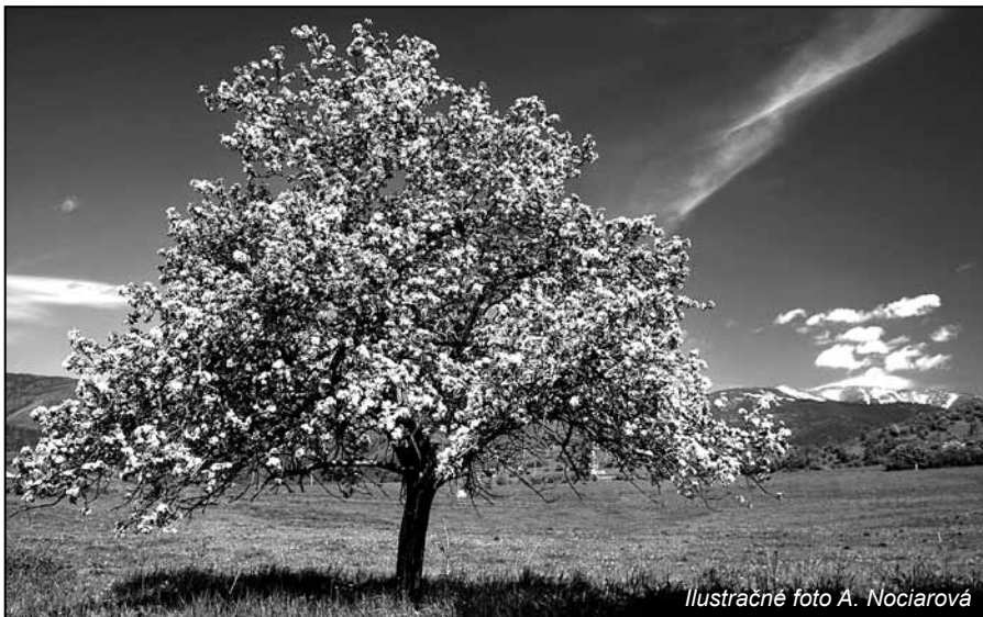
Ilustračné foto A. Nociarová

Slovensko si pripomína Deň víťazstva nad fašizmom. Dátum 8. máj sa vzťahuje na výročie kapitulácie nacistického Nemecka. V niektorých štátoch sa tento deň označuje aj ako Deň víťazstva nad fašizmom v Európe. Čítajte na 7. strane. ok