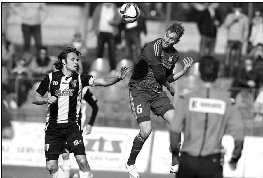
V stredu, v dohrávke 24. kola s Myjavou si domáci vybojovali cenné tri body.