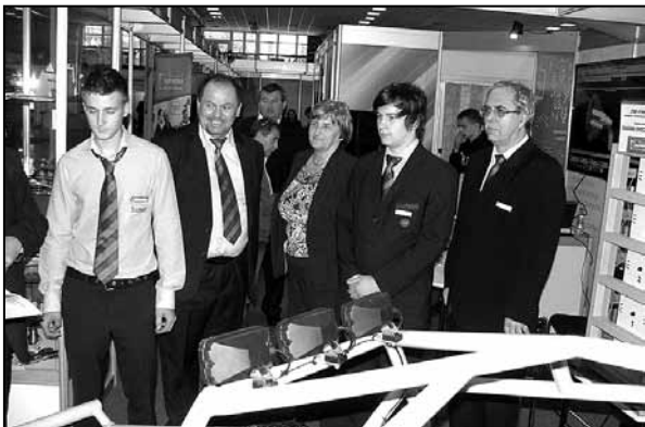
Pri hodnotení prác...