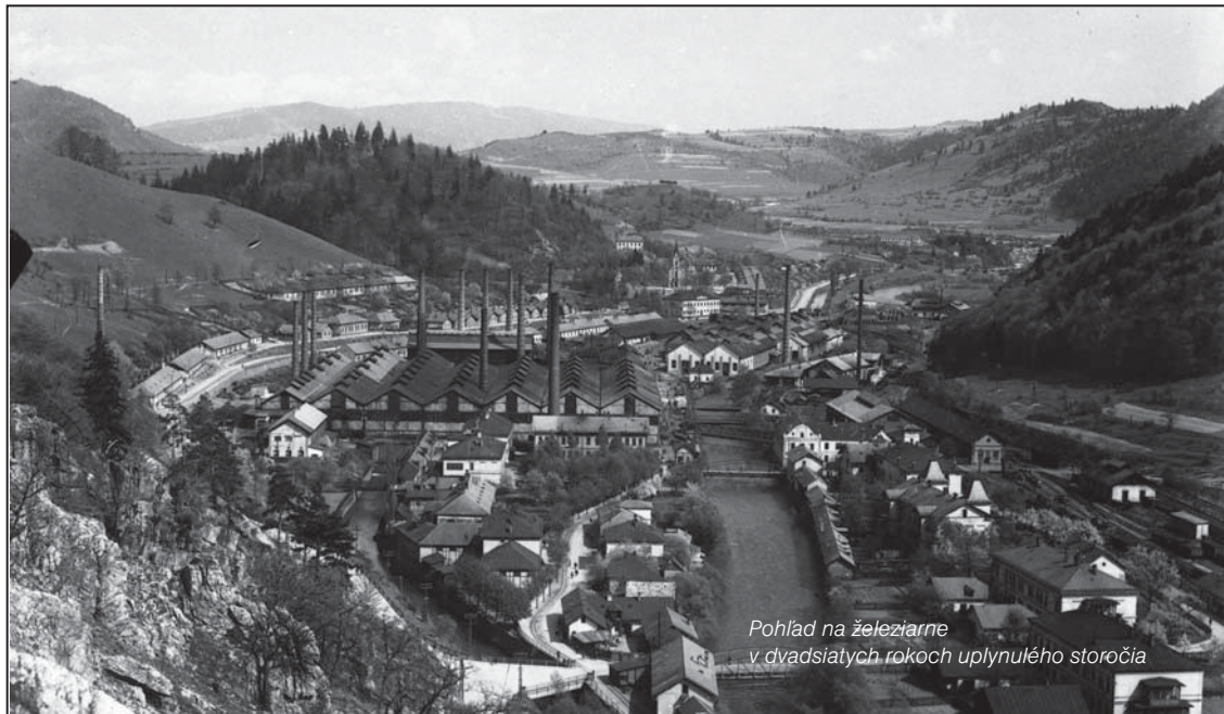
Pohľad na železiarne v dvadsiatych rokoch uplynulého storočia

Hoci v Uhorsku Slovensko tvorilo jeho najpriemyselnejšiu oblasť, po vzniku Československa vystúpil do popredia náskok českého