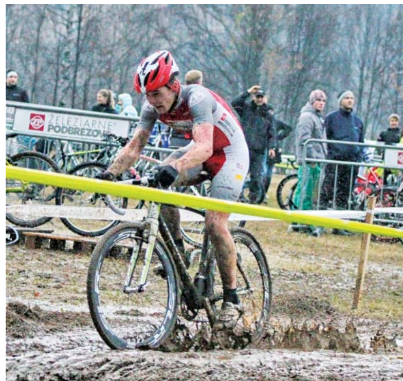
Jedno z kôl Slovenského pohára sa opäť uskutočnilo v Podbrezovej.

“ Vo všeobecnosti sa dá povedať, že v športe sa nám darí a s výsledkami môžeme byť spokojní.