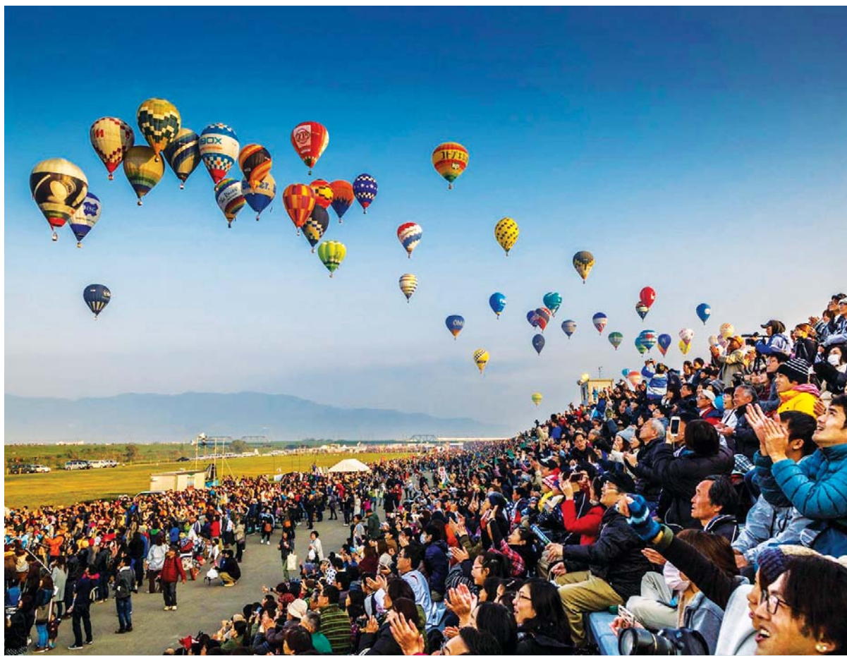
Majstrovstiev sveta v japonskej Sage sa zúčastnila aj posádka balónového oddielu ŽP Šport