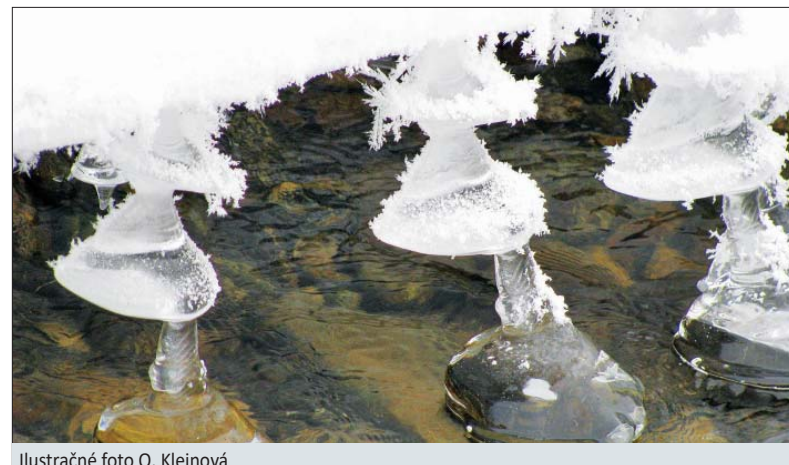
Ilustračné foto O. Kleinová

K naplneniu cieľov stanovených na rok 2017 všetkým kolegom prajem veľa zdravia, vytrvalosti a pozitívnej energie.