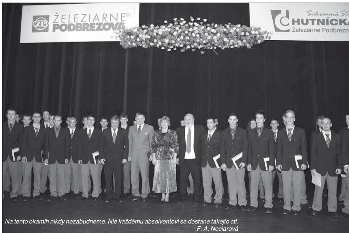
Na tento okamih nikdy nezabudneme. Nie každému absolventovi sa dostane takejto cti. F. A. Nociarová

V procese prípravy na budúce povolanie zohrávajú nezastupiteľné miesto inštruk-