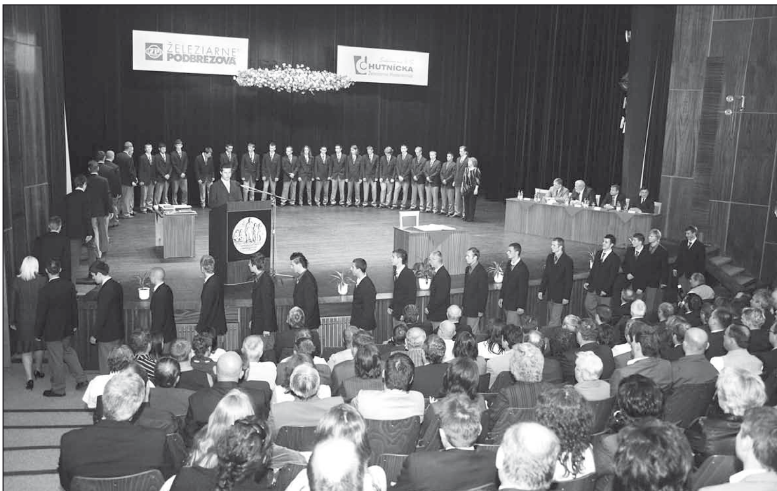
Slávnostný nástup úspešných absolventov.