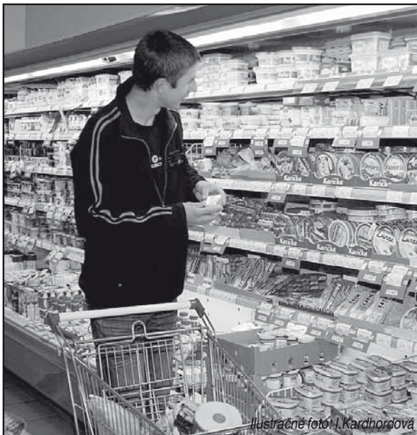
Ilustračné foto: I. Kardhordová

– Návšteva lekára sa pre účely poskytnutia stravného nepovažuje za odpracovanú zmenu. Ak ste však vykonávali prá-