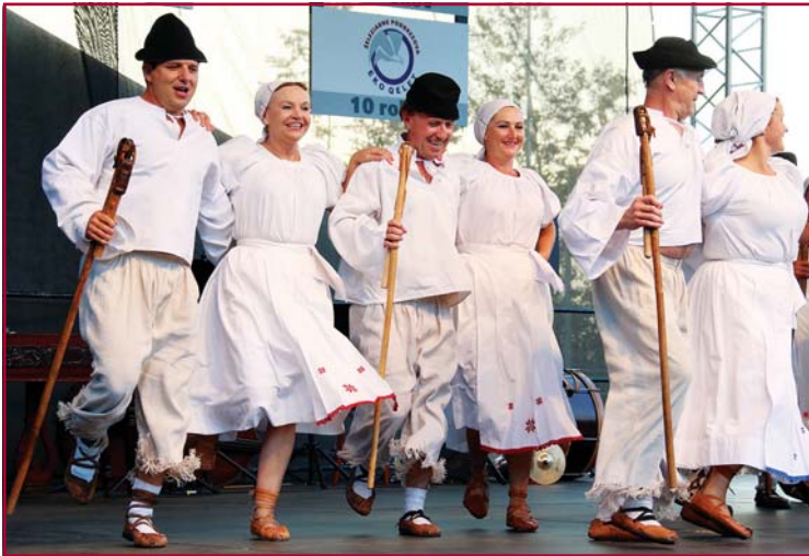
Hlavný program