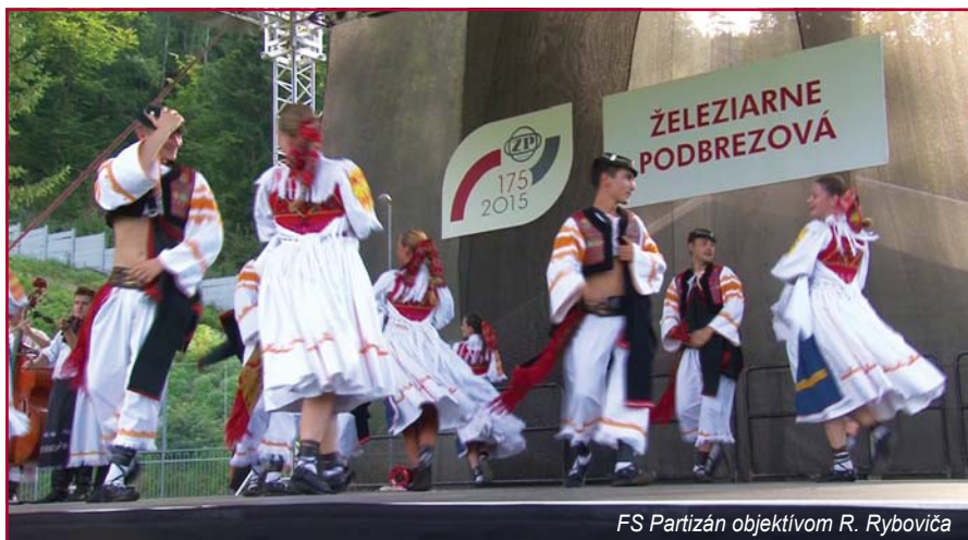
FS Partizán objektívom R. Ryboviča

Tisíc osemsto bývalých zamestnancov podbrezovských železiarní – dôchodcov, prijalo pozvanie na tohtoročné oslavy. Hoci ich program začal o 15. hodine, už o pol druhej sme videli domácich, ale i tých cezpoľných vykračovať v krásnom slnečnom počasí smerom do vynovenej ZELPO ARÉNY. Po prevzatí balíčkov s občerstvením ich pri príchode na futbalový štadión vítala Dychová hudba Železiarní Podbrezová. Celou trasou sme vnímali rozžiarené tváre, srdečné podania rúk a objatia tých, ktorí sa nevideli už niekoľko rokov. Otázkam a odpoveďami nebolo konca kraja a tok ich rozhovorov prestihli až moderátori, ktorí otvorili slávnostný program a srdečne privítali najstaršiu generáciu na pôde ich dlhoročného, pre niektorých jediného zamestnávateľa.