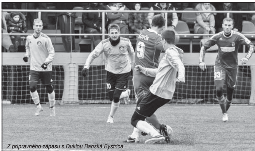
Z prípravného zápasu s Duklou Banská Bystrica