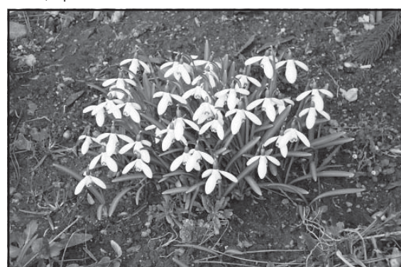
Prebúdajúca sa príroda v predposledný februárový týždeň