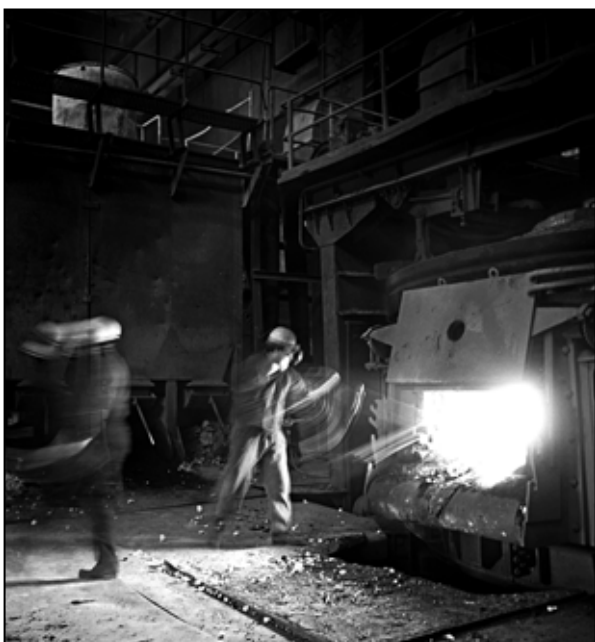
Ručné podávanie feroprisad do EOP