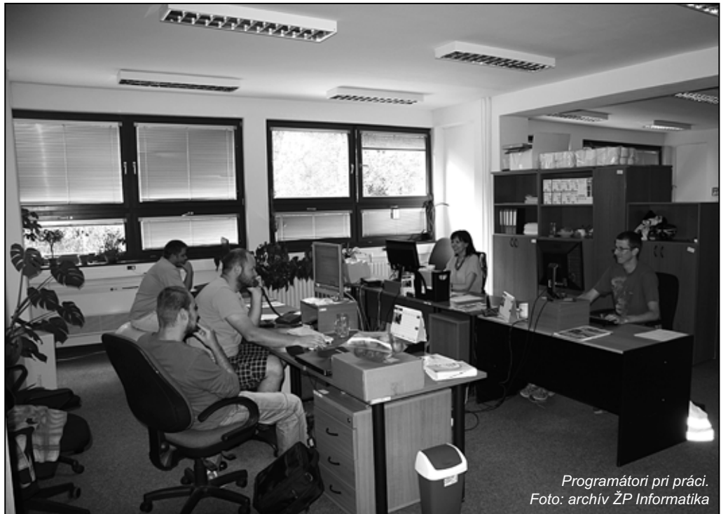
Programátori pri práci.