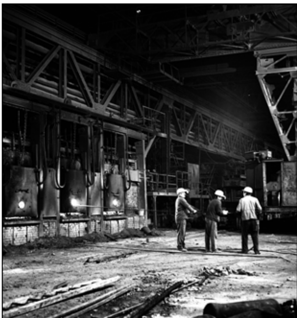
Osádka kontroluje tavenie ocele v SM peci