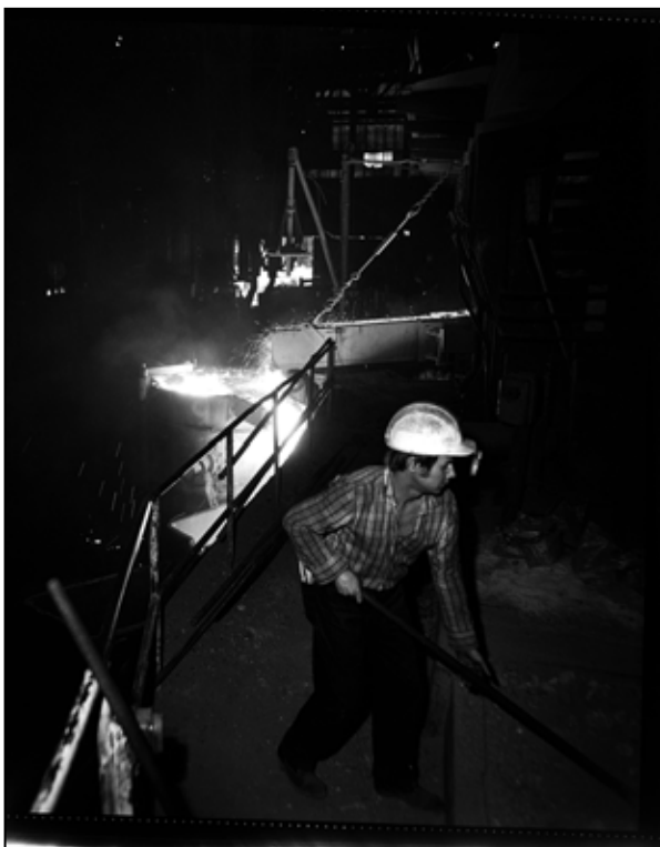
Odpich ocele zo SM pece