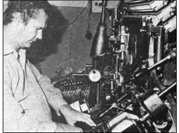
Strojny sadzač prepisal texty a odliat z olova písmo

V príprave novín prevzal úlohu metér, človek, ktorý mal pred sebou predlohu zrkad-