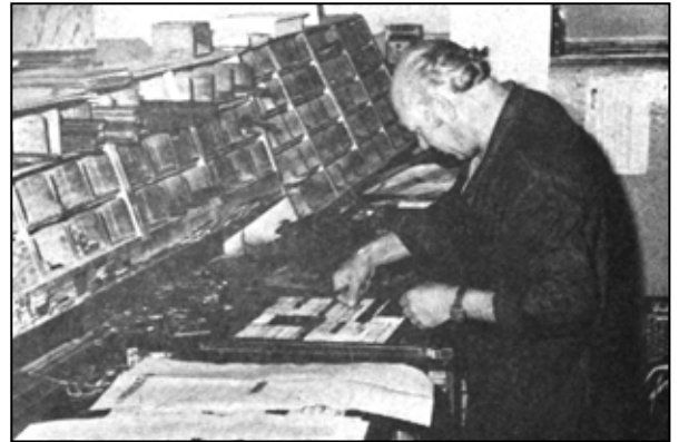
Metér podľa zrkadla kompletizoval texty

lovo obrátenú, dokázal čítať články sprava doľava a hore nohami. Články dostali titulky, fotografie svoje miesto a keď bolo všetko hotové, ďalší pracovník tlačiarne urobil obťah novín jednotlivých strán, čiže prvý ručný výtlačok.