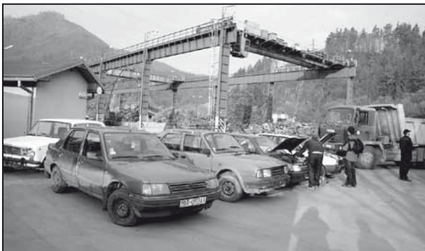
Jedným zo zberných miest bola aj pobočka v Podbrezovej