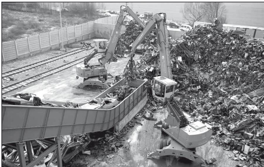
Toto špičkové zariadenie garantuje kvalitu.

„Metódou spracovania starých vozidiel štrôrovaním sme schopní v budúcnosti zvládnuť organizačne, kapacitne, i technologicky,