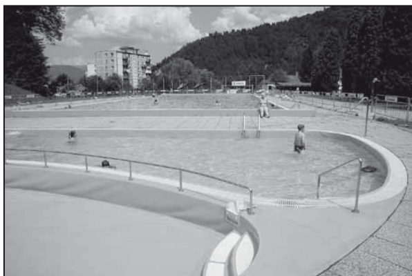
V prvé dni otvorenia letnej sezóny na kúpalisku bola návštevnosť slabá, čo ovplyvnila najmä nestálosť počasia.