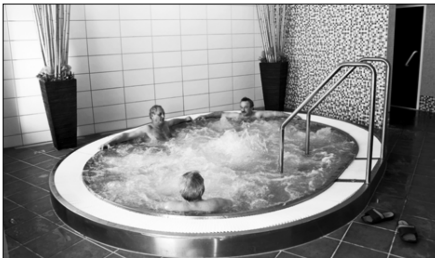
Rekondičných pobytov v akciovej spoločnosti Tále (v spolupráci s kúpeľmi Brusno) sa v prvom polroku zúčastnilo 127 zamestnancov našej firmy.

úradom verejného zdravotníctva z Banskej Bystrice.