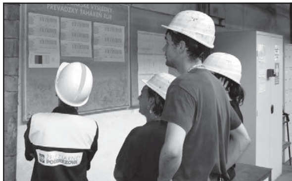
Zamestnanci medzioperačného delenia, výroby 1, ťahárne rúr sú tiež zapojení do súťaže.