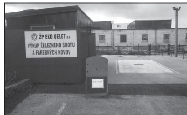
Zberňa Komárno je situovaná v areáli lodeníc pri hlavnej bráne SLKB v Komárne