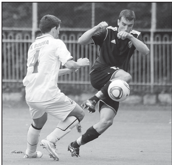
V zápase s Moldavou Podbrezová zvíťazila 7:0.