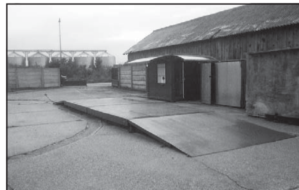
Zberňa vo Veľkom Mederí je otvorená neďaleko železničnej stanice