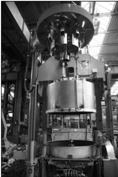
Vulkanizačný lis 85" pre USA

sov do USA, dvadsaťjeden do Bieloruska, šesť pre nemeckú firmu Harburg Freudenberger, v spolupráci so ŽDAS a.s. bola uzatvorená zmluva na dodávku kovacího lisu 45/50 MN do Číny, pre Constellium Děčín máme zákazky na modernizáciu vytlačovacích lisov. Pre ruského zákazníka sme dodali kompletne zariadenie pre modernizáciu kovacího lisu 120 MN. Montáž a uvedenie do prevádzky zákazník z prevádzkových dôvodov odsunul na apríl budúceho roka.