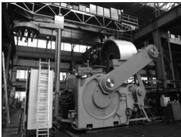
Vulkanizačný lis 100" pre USA

Na druhej strane efektívnosť zrealizovaných kontraktov v tomto roku nie je na úrovni, s ktorou by sme boli spokojní. Vzhľadom k dosiahnutým cenám pri tendrových riade-