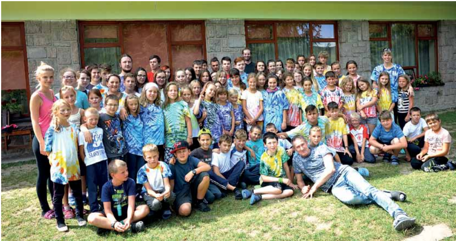
Na bielych tričkách vytvorili abstraktné vzory, v ktorých prevládali farby ich svetov. Pohľad na účastníkov tábora