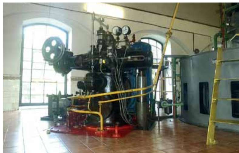
Starý regulátor pre G2 HC Dubová

opravou v oceliarni a je plánovaný tak, aby odstávka technologického zariadenia kyslíkárne čo najmenej ovplyvnila zabezpečenie plyných médií kyslíka a dusíka pre výrobné prevádzkarne.