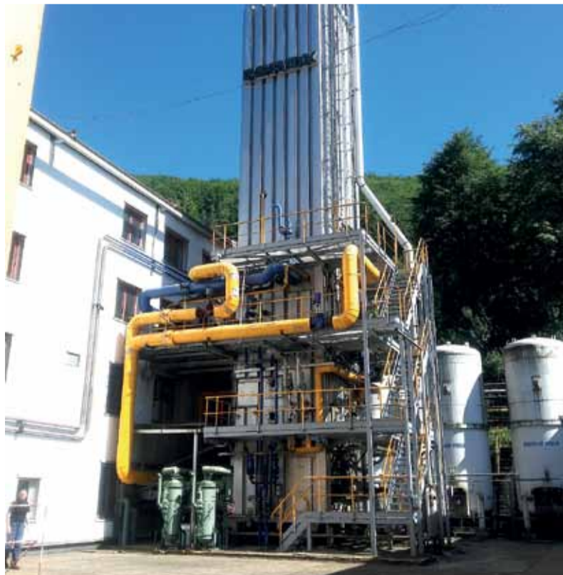
Nízko- teplotný deliaci blok S 1000/100.