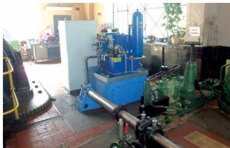
Nový regulátor pre G2 HC Jasenie