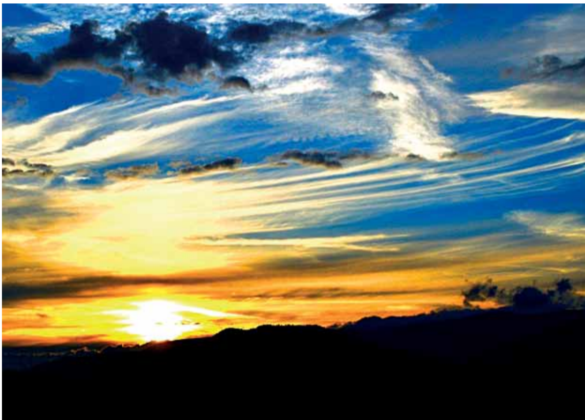
Západ slnka – pohľad od Zuberštiny