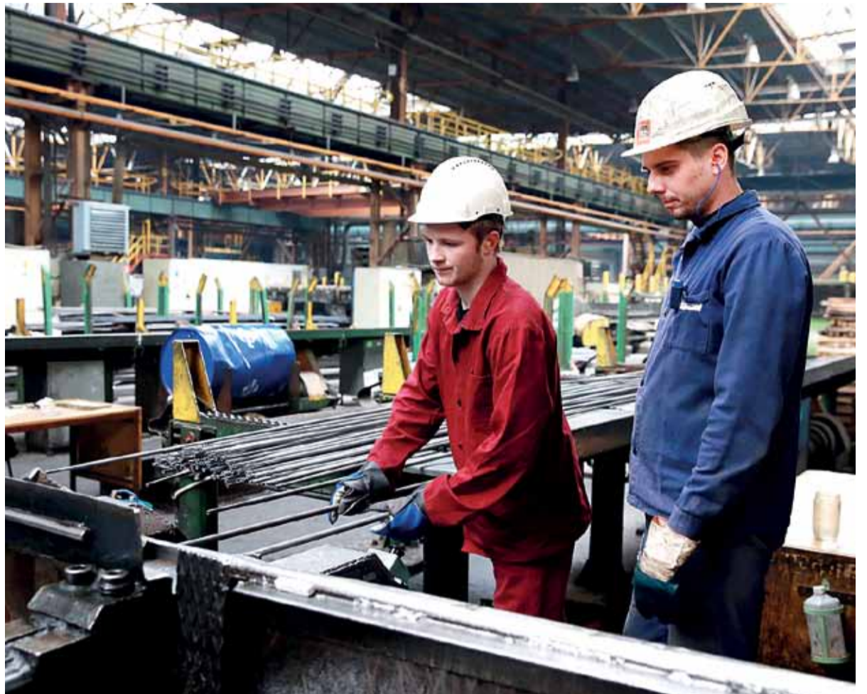
Žiaci získavajú prax pod vedením inštruktora.

- Tí, ktorí odchádzajú, majú iste svoje dôvody, ale nemyslím si, že práve bývanie je ten kľúčový. Skôr mladým nevyhovuje nepretržitý pracovný režim, chcú mať cez víkendy voľno a tu to vždy nie je možné.