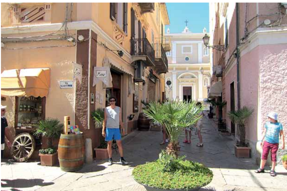
Stredomorský ostrov La Madalena