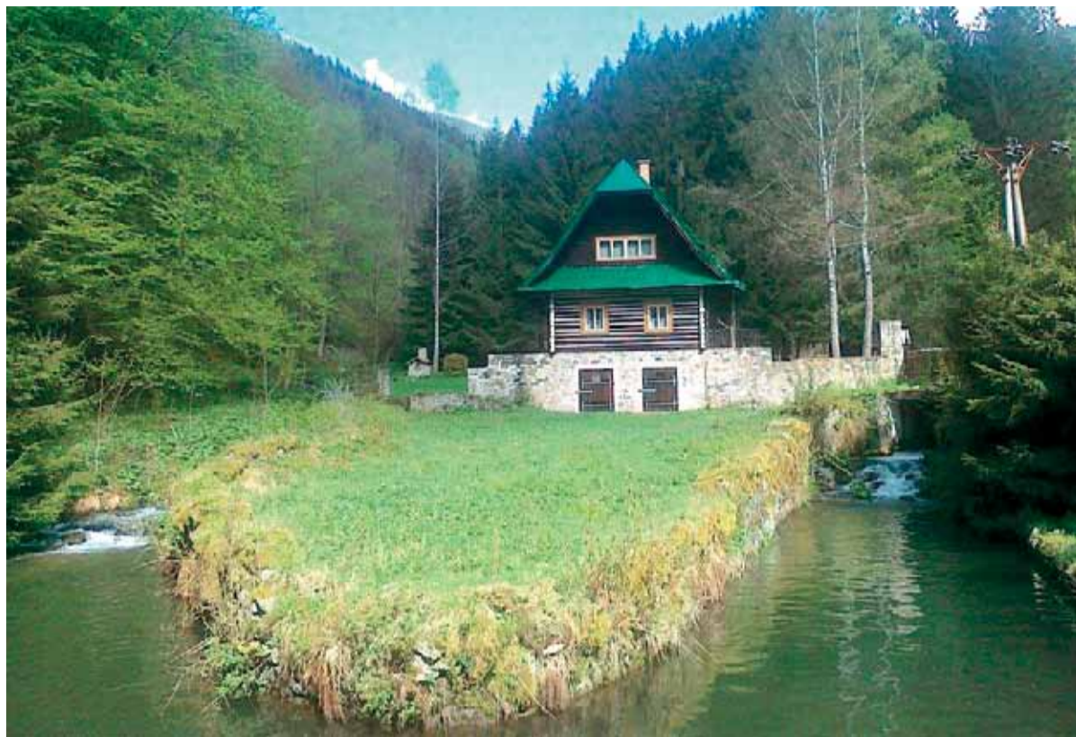
Hladina vody v privádzači na Baukovej