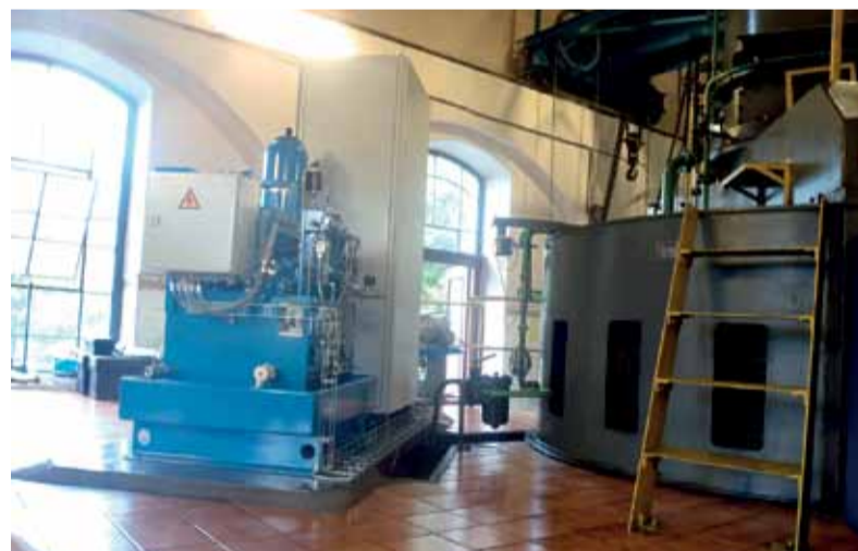
Nový regulátor pre G2 HC Dubová