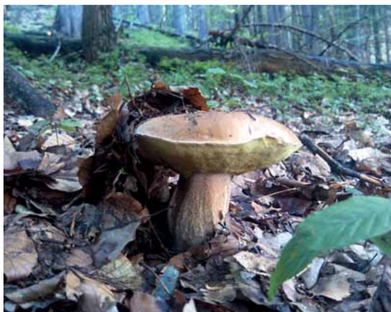
Hubárska sezóna je v plnom prúde.