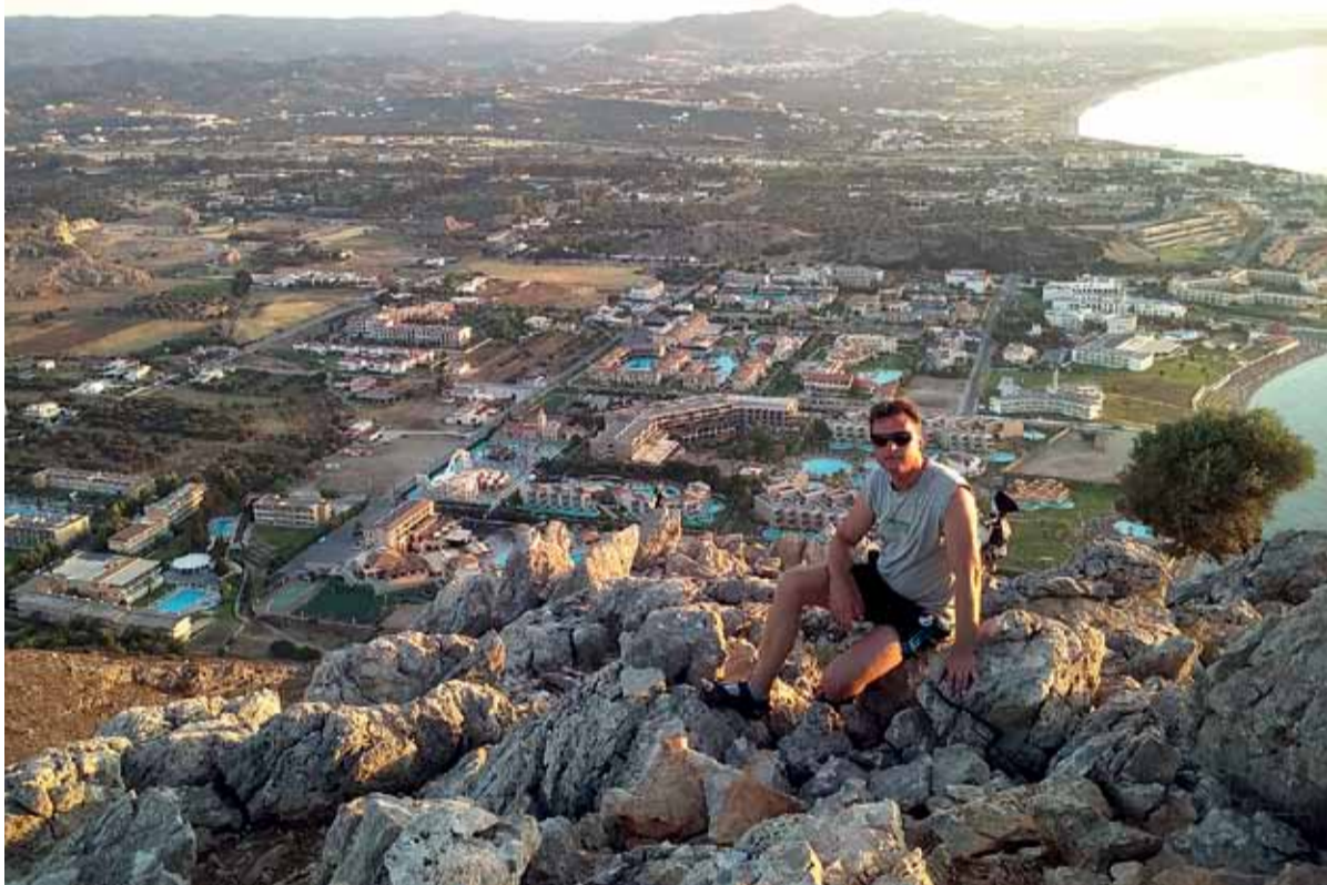
Stredisko Kolymbia – ostrov Rodhos