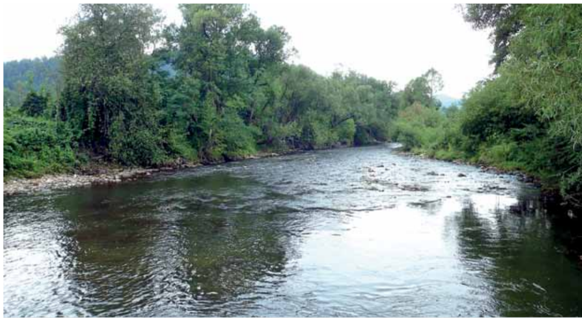
Nízka hladina vody rieky Hron

ne a ostatných vodných tokoch. Hoci výroba elektriny bola na mesačných maximách, v apríli sme splnili plán výroby na 101,15 percenta, v máji sme plán už nespĺnili a plnenie bolo na úrovni 94,27 percenta. A nasledujúci mesiac bol ešte slabší. Málo vody, nedostatok dažďa, to sa odrazilo na júnovom výsledku, kedy plnenie výroby