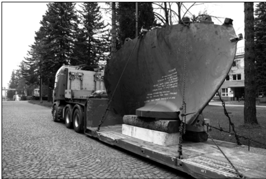
Dopraviť lopatku Kaplanovej turbíny pre firmu IMPSA Argentína znamená prevoz na ťahači do nemeckého prístavu (foto) a odtiaľ loďou do Južnej Ameriky

Prvá dodávka do tejto vzdialenej destinácie, určená pre argentínskeho zákazníka firmu IMPSA, ešte ukončená nebola. Viac – menej všetkých dvadsaťpäť kusov lopatiek pre Kaplanove turbíny bolo už odoslané zákazníkovi, ktorý bol s dodávkou spokojný.