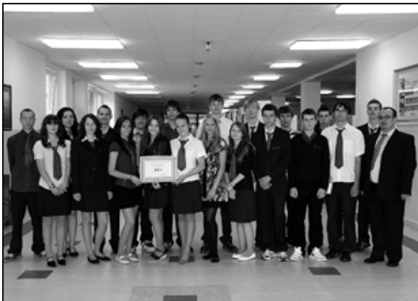
Za druhé ročníky bola odmenená 2.H SG ŽP