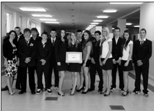
Za prvé ročníky bola odmenená 1.H SG ŽP