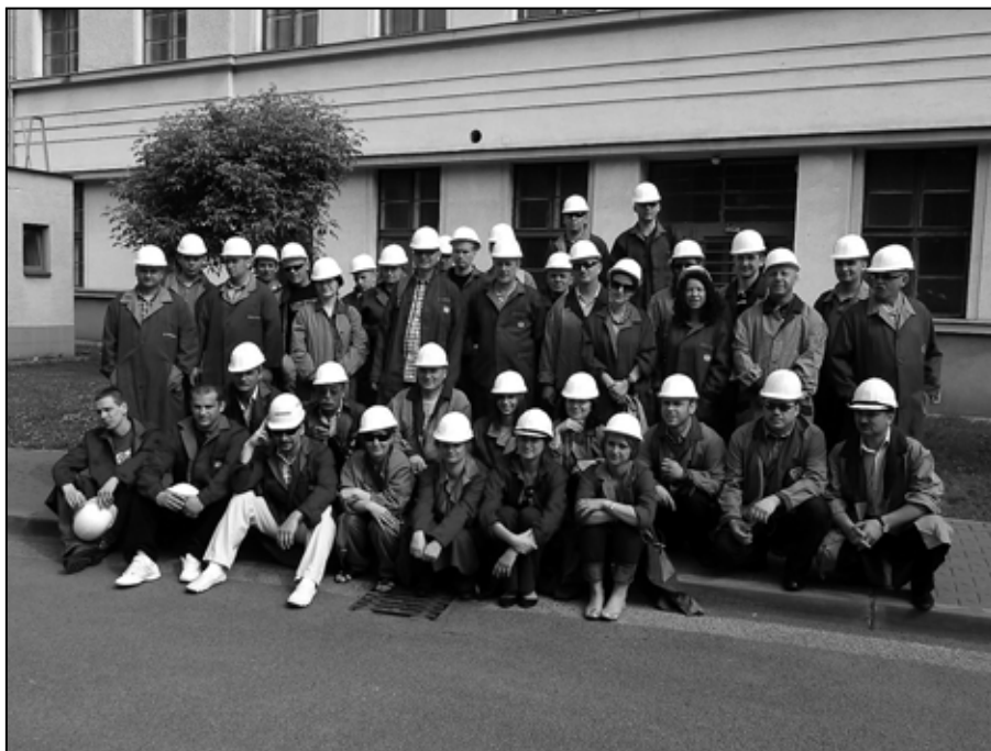
Dňa 27. mája 2011 sa v Železiarniach Podbrezová a.s. uskutočnilo školenie a exkurzia pre pracovníkov našich poľských odberateľov, spoločnosti MARGO Stalowa Wola, SONINGSTAL, Racizbor a EVRO, Krakow