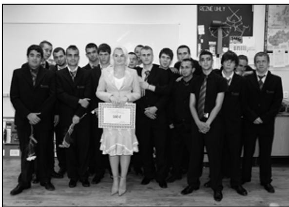
Za tretie ročníky bola odmenená 3.E SSOŠH ŽP