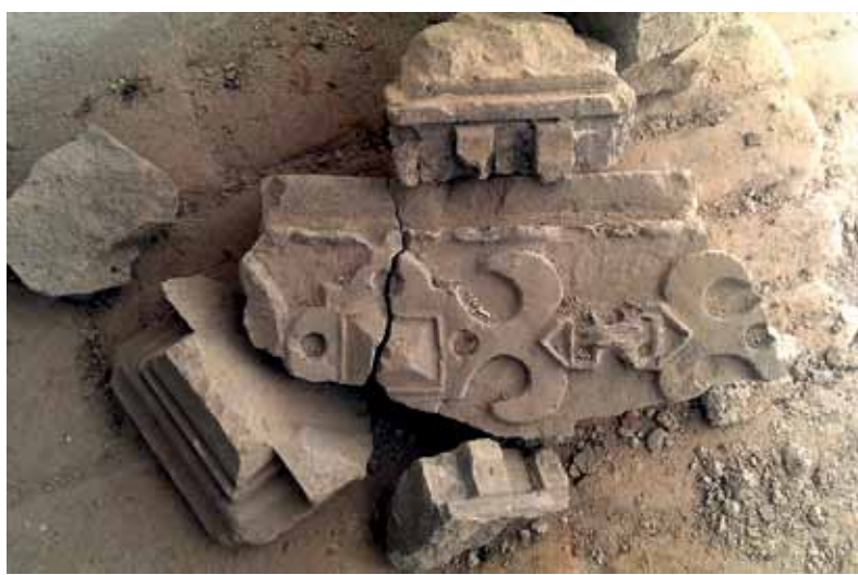
Nálezy kamenných článkov

Výskum pozostával zo šestnástich sond, ktorých situovanie záviselo od potrieb realizácie zemných prác a úprav terénu v rámci obnovy horného nádvorja podľa príslušnej projektovej dokumentácie. Jednotlivé sondy boli kopané ručne po vrstvách, situácia v nich bola dokumentovaná fotograficky a všetky boli geodeticky zamerané. Výskum prebiehal v priestore, ktorý bol značne sterilizovaný výkopmi inžinierskych