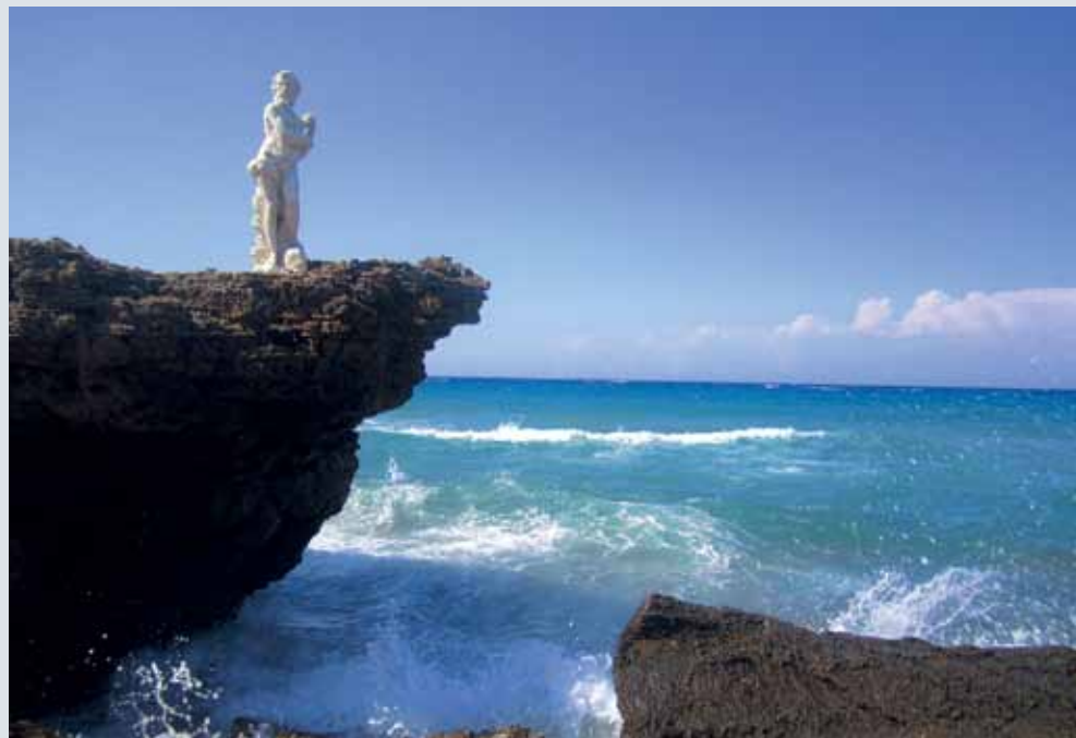
Poseidon na ostrove Zakynthos v Chorvátsku