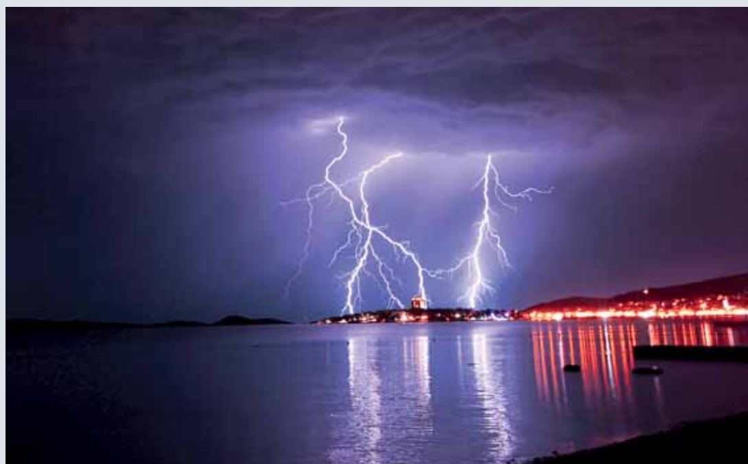
Chorvátsko – Vodice