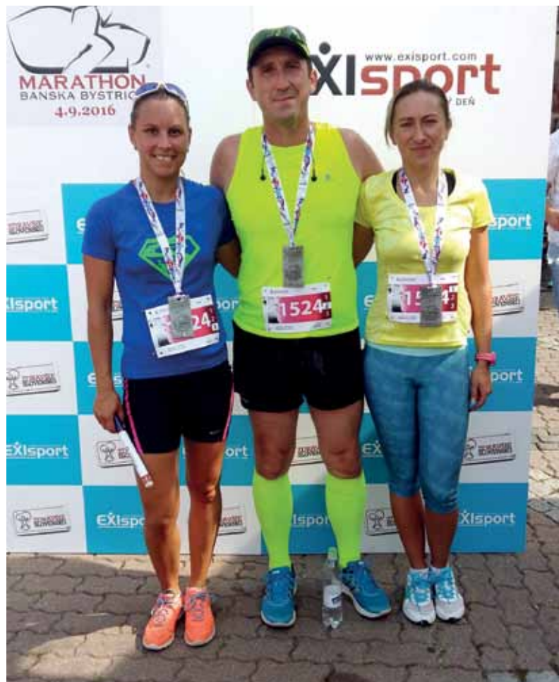
Zmiešaná štafeta štartovala s číslom 1524