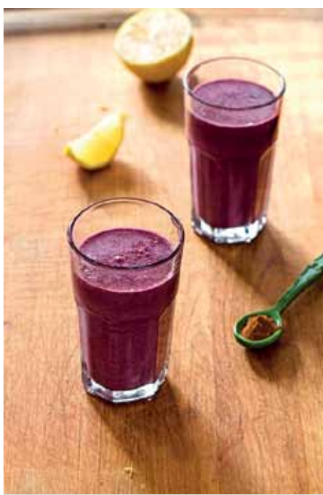
Zdravý nápoj posilní váš organizmus

kyslíka do mozgu, odvádza z tela prebytočné tekutiny a škodlivé látky. Spolu so sodíkom udržiava správny tlak v tkanivách a rovnováhu kyselín a zásad v tele.