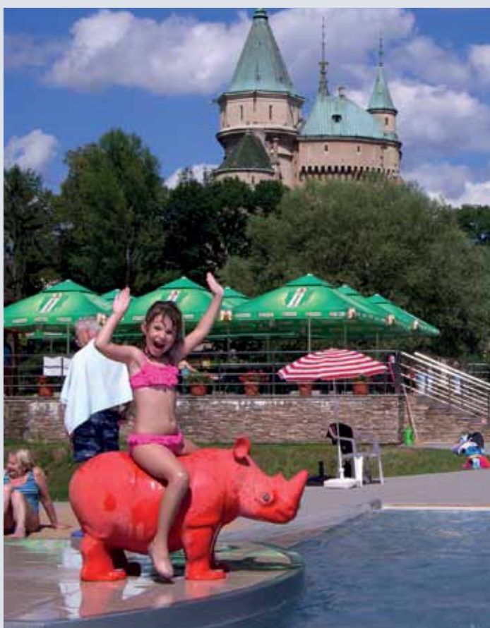
Miška na kúpalisku v Bojniciach