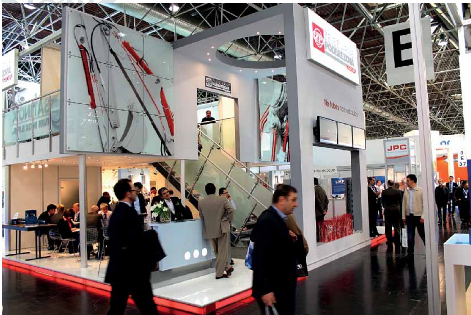
Ak je veľtrh správne pripravený, je pre firmu ideálnym komunikačným nástrojom.