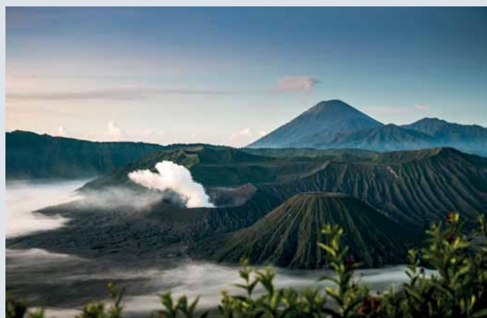
Sopka Mount Bromo – východná Java Indoné- zia objektívom Ondreja Ťažkého