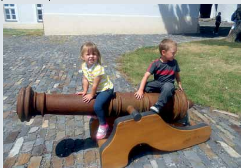
Na hrade Ľupča objektívom T. Flocha