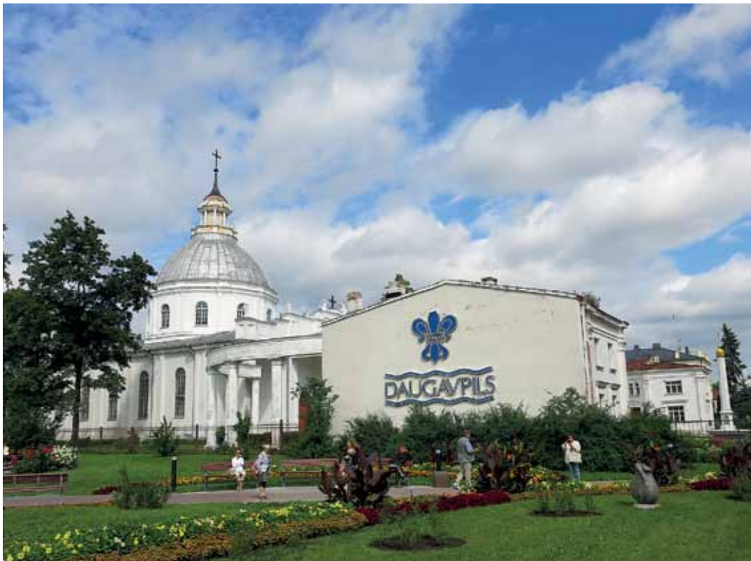
Daugavpils - po Rige druhé najväčšie mesto v Lotyšsku