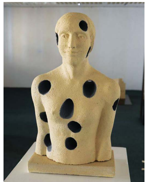
...a vystavené, ako súčasť prezentácie prác Keramického sympózia.