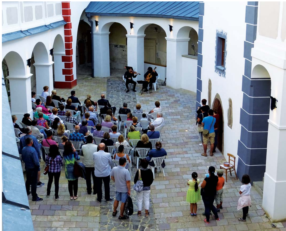
Hradné nádvorie