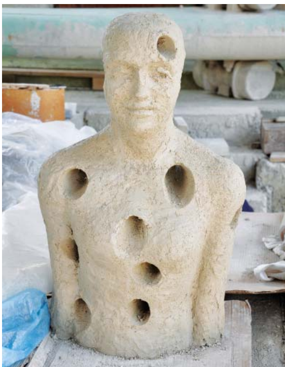
Dielo s názvom „Ubúdanie“ pred vypálením vo veľkokapacitnej peci...