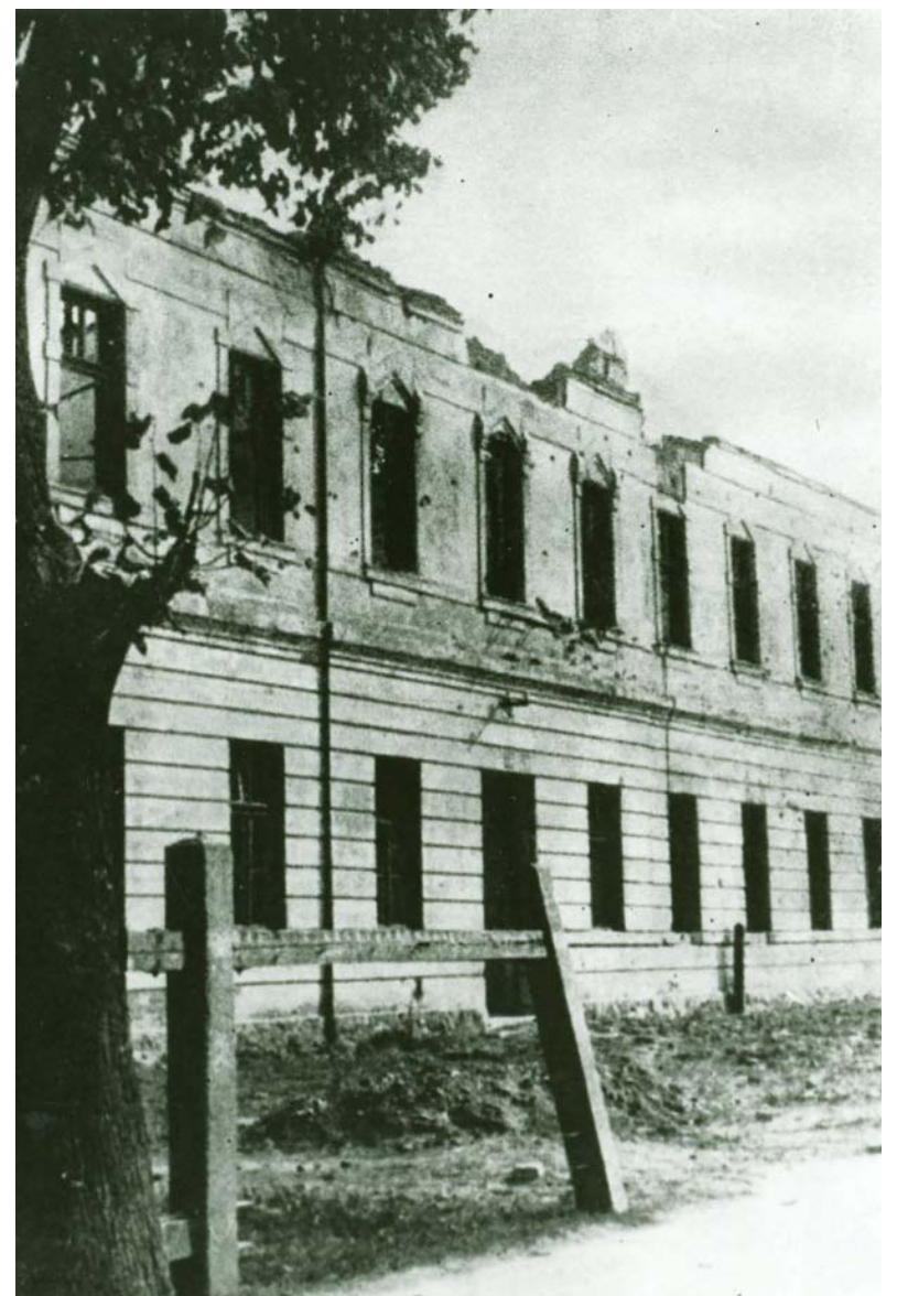
Teoretické vyučovanie bolo v Meštianskej škole v Podbrezovej.

Správne odpovede posielajte do redakcie Podbrezovan do desiatich dní od vydania. Nezabudnite uviesť kontakt. Žrebovanie o lákovú cenu sa uskutoční na konci súťaže. Podmienkou je účasť vo všetkých súťažných kolách.