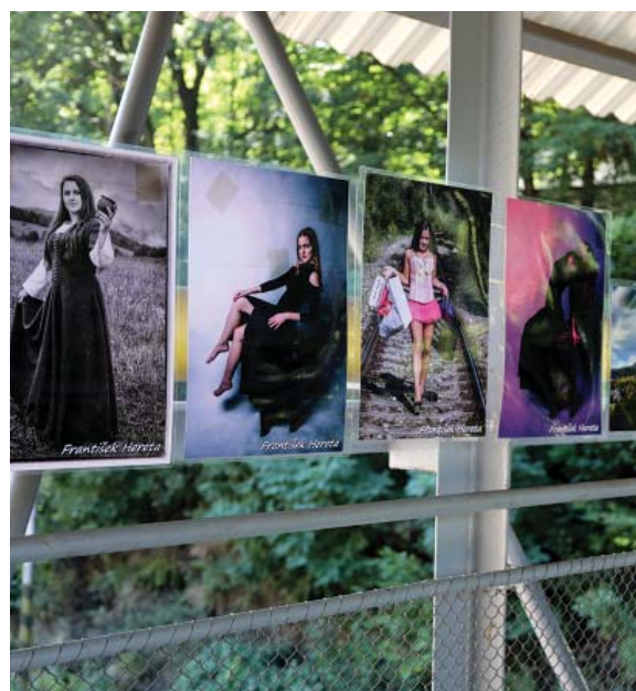
Počas uplynulého víkendy bola na prechode cez železničné priecestie v Podbrezovej netradične inštalovaná výstava fotografií z tvorby členov fotoklubu GRANUS.

Sústredenie bolo prvou skúškou pred Majstrovstvami sveta v koloch kategórie U23, ktoré sa uskutočnia v rumunskom meste Kluž od 14. do 19. mája 2018.