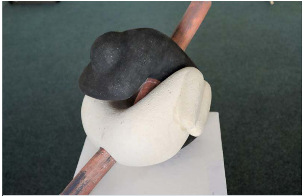
Vystavené dielo „Spojenci“ v priestoroch Novohradského múzea a galérie v Lučenci.