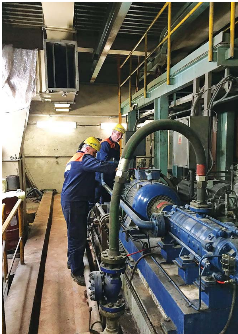
Zamestnanci centrálnej údržby pri oprave hydrauliky pece EAF v oceliarni.

“ S nasadením technikov pri identifikácii poruchy a následnom riešení vzniknutého stavu, som sa presvedčil o sile a ume kolektívu zamestnancov ŽP a.s.”