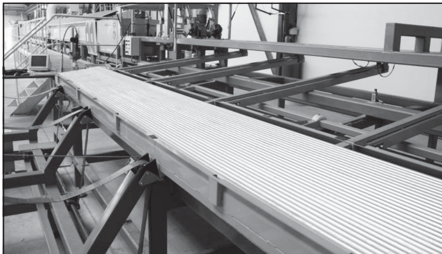
O galvanizované rúry záujem rastie.

do úvahy fakt, že firma Benteler by v októbri mala po požiari obnoviť prevádzku. Z hľadiska cenovej politiky treba povedať, že ceny našich výrobkov sú priamoúmerne závislé od ceny vstupných materiálov. Cena oceľového šrotu sa zatiaľ drží na rovnakej úrovni, mierne pohyby ak sú, tak smerom dolu. Očakáva sa, že po nábehu