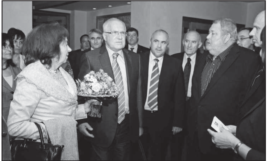
ok Uvítanie prezidentského páru Českej republiky v hoteli Stupka na Táloch