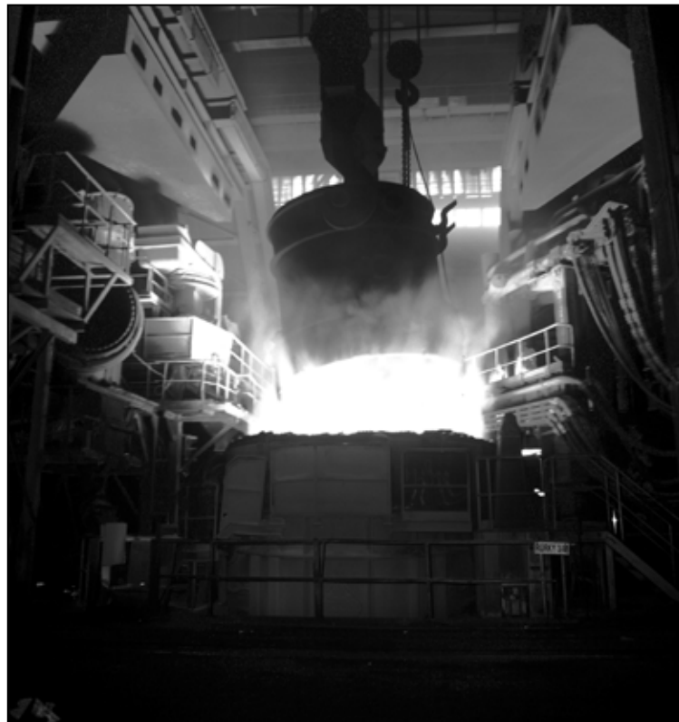
Spustením 60 – tonovej EOP bol dobudovaný uzavretý výrobný cyklus.