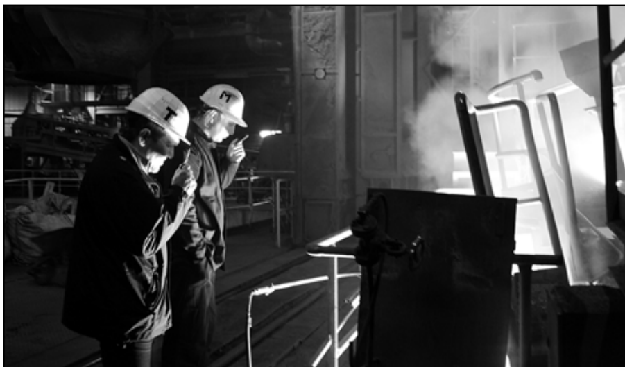
Osemnásť rokov po spustení 60 – tonovej UH pece do prevádzky, 9. apríla 2011 zaznamenali oceliari významný moment, odliali päťmiliónu tonu ocele. K 20. výročiu (24. februára 2013) odliali 5 692 875 ton ocele.