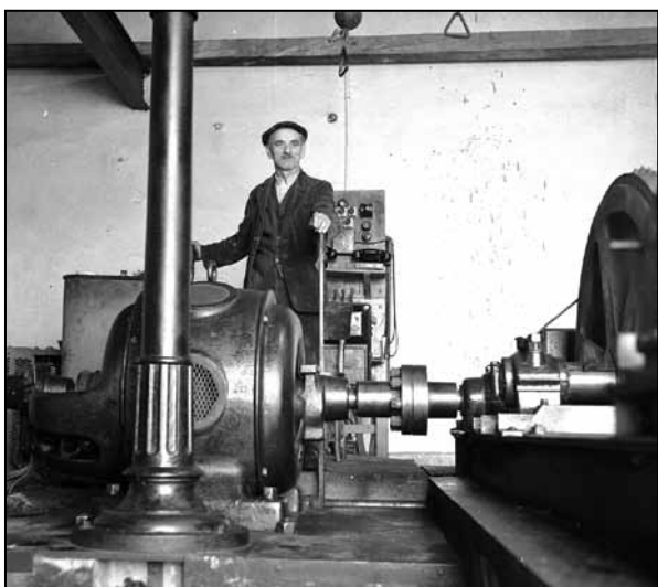
Interiér strojovne, kde posun huntíkov riadil aj pán Kováč.