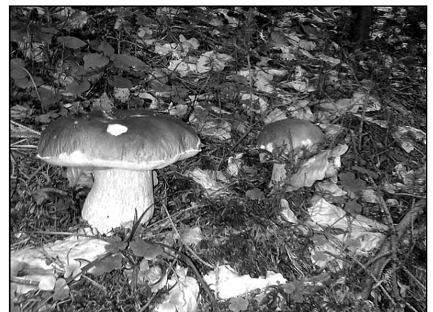
Jedni tvrdia nerastú, druhí, že rastú. Pravda je taká, že na určitých miestach sa dubáky vyskytujú, čoho dôkazom je snímka M. Mikloška z minulého týždňa.