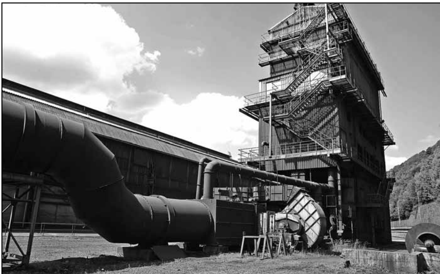
Snímka A. Nociarovej z októbra 2015 je dnes už historická – toto je posledný pohľad na kompletne zariadenie pred likvidáciou