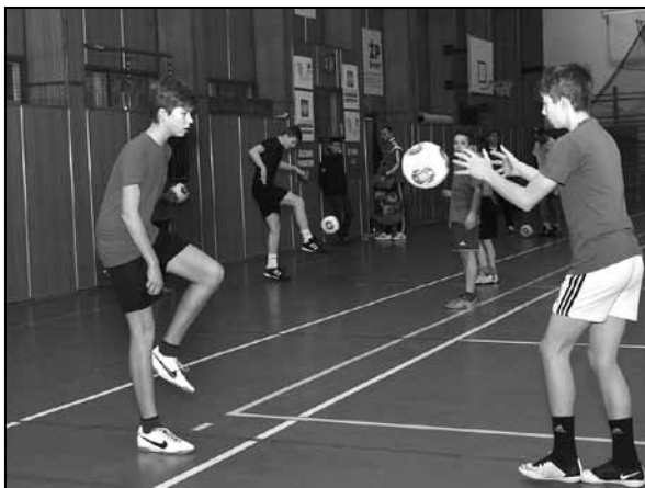
Tréning družstva U14 v telocvični na Štiavničke

2.- Zimnú prípravu sme odštartovali 11. januára a bude trvať do 5. marca, kedy hráme prvé kolo odvetnej časti súťaže. Všetky tréningy v zimnom prípravnom období absolvujeme v domácich podmienkach a počas ôsmich týždňov odohráme sedem prípravných