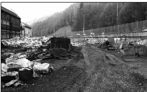
Na snímke I. Kardhordovej z decembra 2015 zostali po stavbe už len drobné pozostatky zo základov

Všimli ste si, že v starom závode už nie je budova, ktorá zaujala najmä tým mohutným potrubím ústiacim do „veže“? Stála tu od roku 1985 a jej účelom bolo odprášenie exhalátov od elektrických oblúkových pecí. V roku 1993 bolo odprášenie zrekonštruované, aby ďalej slúžilo svojmu účelu napojením na novovybudovanú 60 – tonovú elektrickú oblúkovú pec. V roku 2013 ho nahradilo nové odprášenie, a tak to pôvodné stratilo opodstatnenie. S jeho likvidáciou sa začalo v októbri uplynulého roka a v decembri už bolo minulosťou. OK