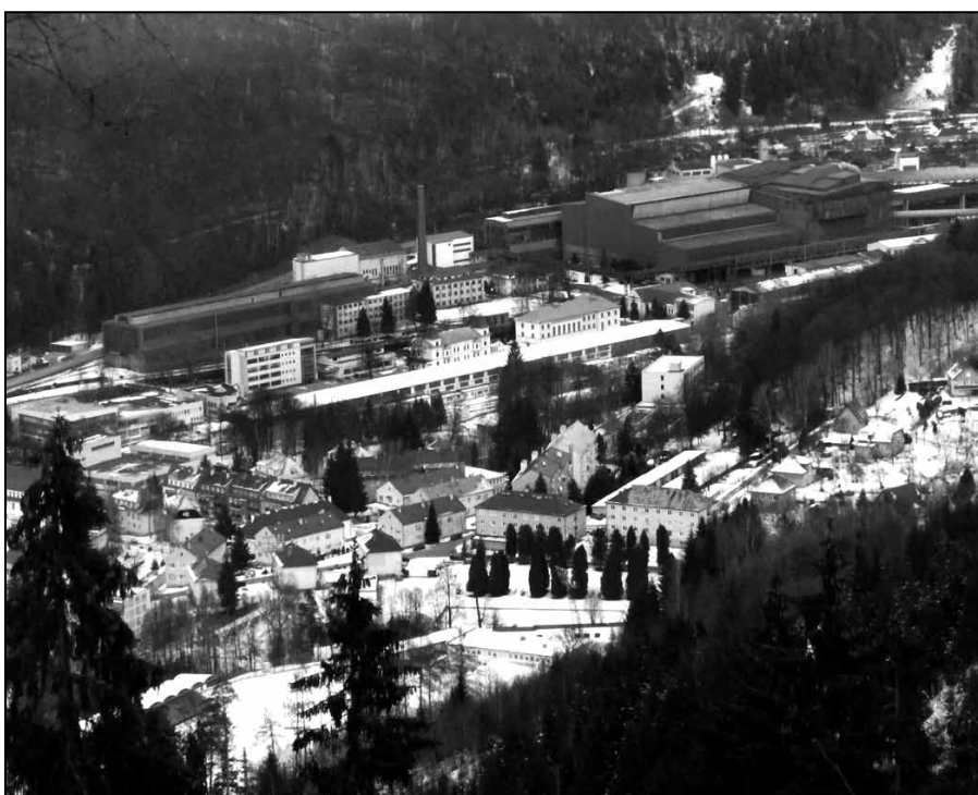
Zima v Podbrezovej