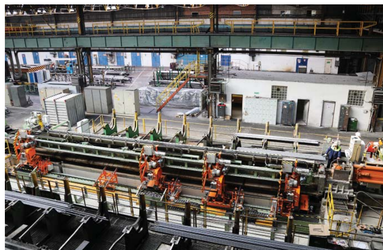
V piatok, 13. októbra, bolo v prevádzkarni ťahárne rúr prevzaté do skúšobnej prevádzky zariadenie na delenie rúr priamo na ťažnej stolici 400 kN s interným značením 3-01.

konštrukcia strechy v požadovanej výške zafixovaná. V 41. týždni boli urobené práce priamo súvisiace so zdvihnutím strechy a to úprava dĺžky medzistĺpov a zmena ukotvenia obslužnej lávky v úrovni +28,960 metra nad podlahou. Všetky práce boli vykonávané bez prerušenia alebo obmedzenia výrobného procesu v hale ZPO. Z dôvodu zaistenia bezpečnosti pohybujúcich sa zamestnancov ŽP a.s. v priestore pod dvíhanou strechou boli práce riadené v spolupráci s koordinátorom z prevádzkarne oceliareň a s odborom Pbžp. Za spoluprácu, hladký a bezpečný priebeh prác v máji a v októbri, ďakujeme všetkým zúčastneným, aj pracovníkom, ktorých pri pracovných povinnostiach v hale táto investičná akcia ovplyvnila.