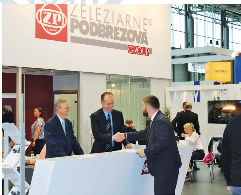
Pohľad na stánok ŽP GROUP