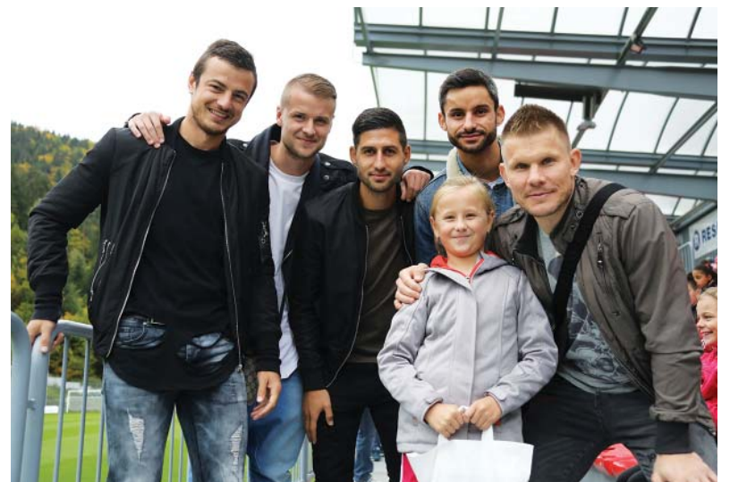
Deň otvorených dverí objektívom I. Kardhordovej