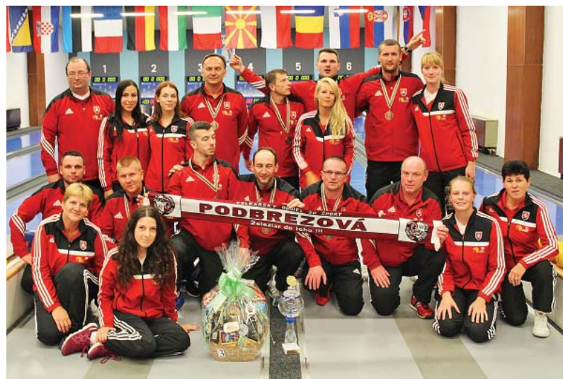
Ženské a mužské družstvo Kolkárskeho oddielu ŠK ŽP v Svetovom pohári v českom Blansku

Z víťazstva v turnaji sa v ženskej časti tešili hráčky nemeckého SKC Victoria Bamberg a v mužskej časti hráči maďarského ZTK Zalaegerszeg. Obidve družstvá Podbrezovej si svojimi umiestneniami zabezpečili účasť v tohtoročnej edícii Ligy majstrov. V prvom kole bol mužom prísúdený rakúsky súper KSV Wien a ženám rakúske družstvo SK FWT Composites Neunkirchen.