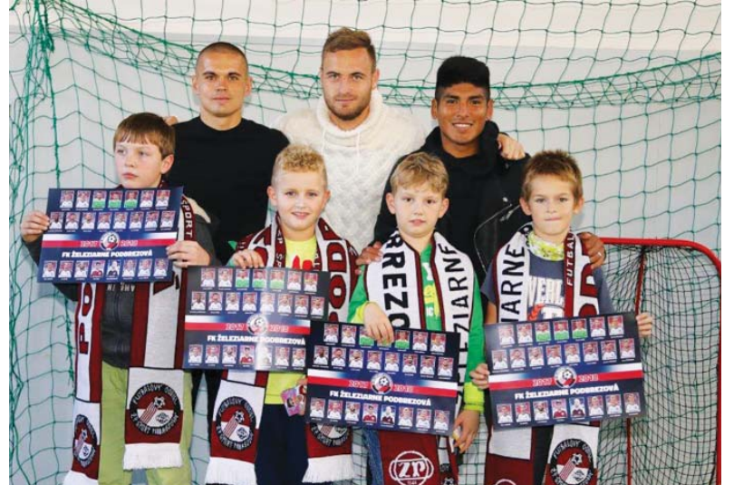
Najaktívnejší žiaci besedy spolu s hráčmi A mužstva

do rodinného sektoru Zelpo arény a my pevne veríme, že minimálne v rovnakom počte sa s deťmi stretne aj v ďalších domácich stretnutiach. Železiar do toho!