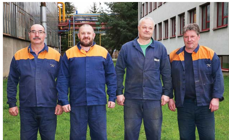
V ťahárni rúr zvíťazila zmena B prevádzkovej strojnej údržby a elektroúdržby.