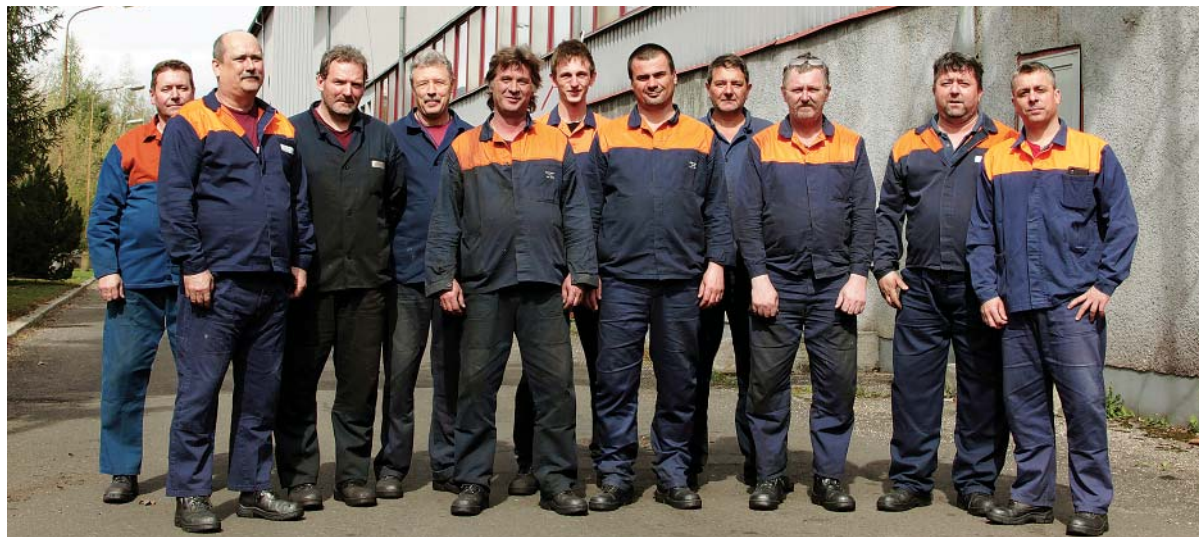
Vo valcovni rúr zvíťazila zmena A prevádzkovej strojnej údržby a elektroúdržby.