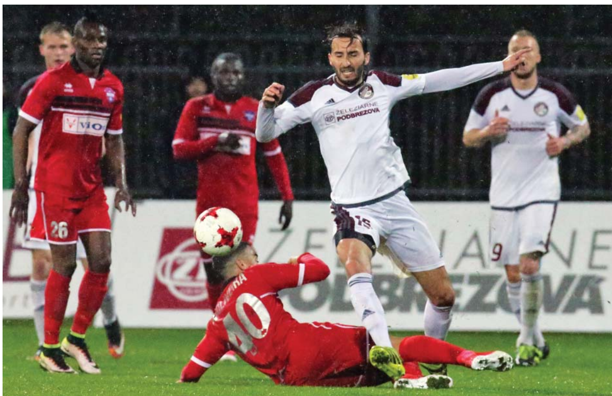
V zápase Podbrezovej proti Zlatým Moravciam siahli naši hráči na dno síl, no odmenou im boli tri body za prvé tohtoročné víťazstvo v pomere 2:0.

FO ŽP Šport: Kuciak – Turňa, Krivák, Kupčík, Djordjevič – Vajda, Podio – Polievka (72' Mikuš), Kochan (92' Kuzma), Viazanko – Bernadina.