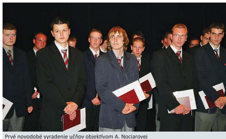
Prvé novodobé vyradenie učňov

Kedy a po koľkých rokoch bola obnovená tradícia slávnostného ukončenia štúdia? Správne odpovede posielajte do redakcie Podbrezovan do desiatich dní od vydania. Nezabudnite uviesť kontaktné údaje. Žrebovanie o lákavú cenu sa uskutoční na konci súťaže. Podmienkou je účasť vo všetkých súťažných kolách.