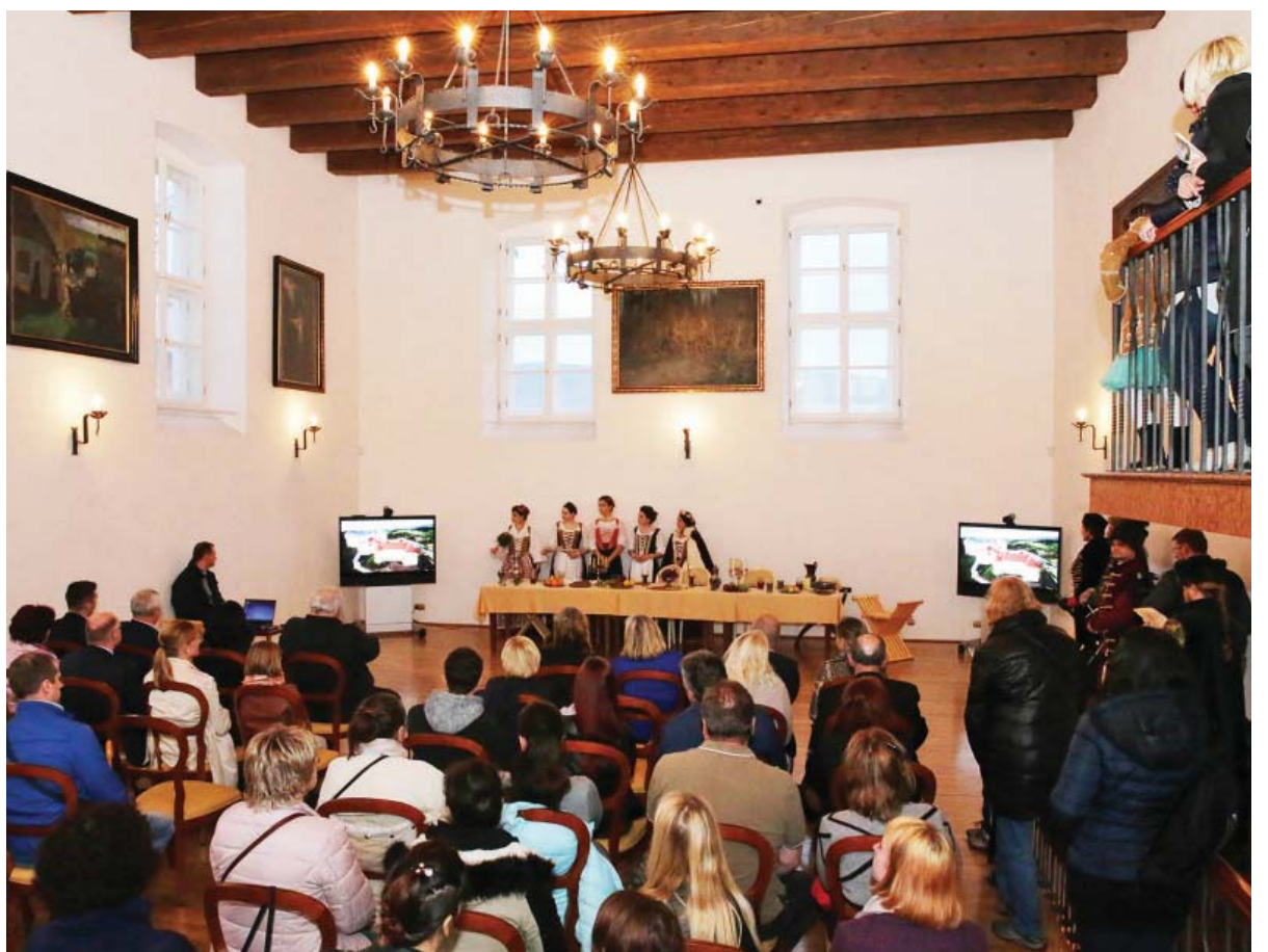
Ukážka stolovania zo sedemnásteho storočia