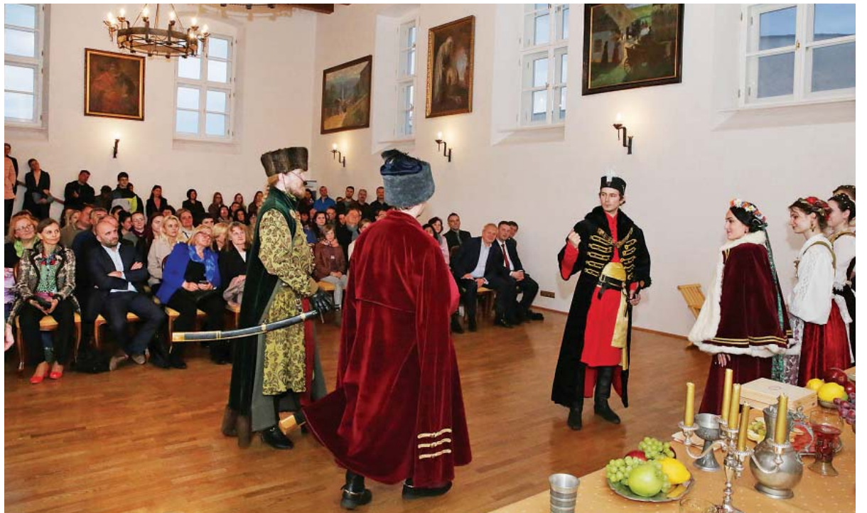
Rekonštrukcia svadobného obradu