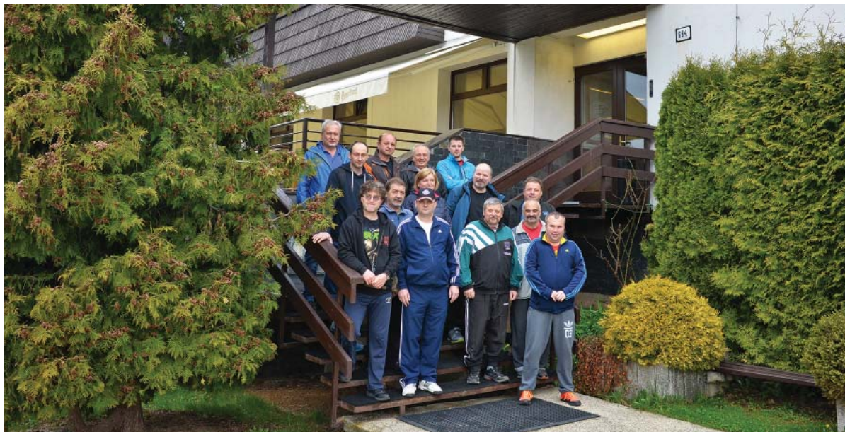
Spoločné foto

Počas posledného aprílového týždňa sa na Táloch zúčastnila necelá dvadsiatka zamestnancov ŽP a.s. prvého turnusu rekondičných pobytov. Do konca roka absolvuje pobyt, vyplývajúci zo zákona č. 124/2006 Z.z. o bezpečnosti a ochrane zdravia pri práci, viac ako tristo našich zamestnancov. Počas siedmich dní majú zúčastnení vypracovaný harmonogram procedúr, ktorých sa musia denne zúčastniť, aby tak naplnili zmysel a poslanie pobytu. Rekondičné pobyty totiž nie sú liečebnými a majú v prvom rade slúžiť ako prevencia možného poškodenia zdravia, zvyšovať fyzickú kondíciu a celkovú odolnosť zamestnancov, ktorí majú charakter práce so zvýšeným rizikom vzniku chorôb z povolania. Procedúry a cvičenia však zúčastnení vzali skôr ako výzvu pre vlastné telo a s úsmevom sa viacerí priznali, že na sebe objavili aj svaly, o ktorých prítomnosti doteraz ani nevedeli.