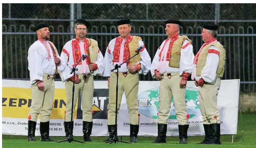
Horehronskí chlopi