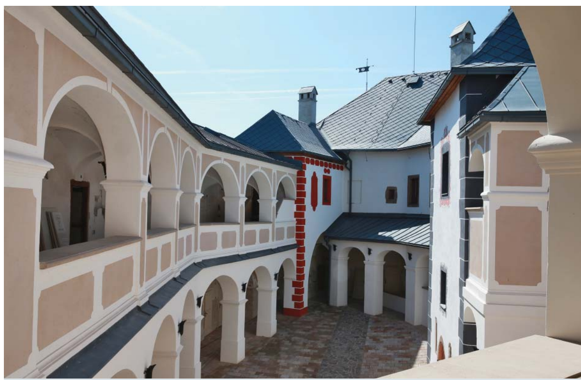
a pohľad na zrekonštruované horné nádvorie hradu Ľupča

Obnova ľupčianskeho hradu prebieha od roku 2002, postupne od opravy striech cez fortifikačný systém,