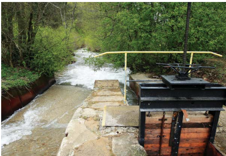
Uplynulé dni narobili starosti aj našim energetikom. V utorok však už mali všetko pod kontrolou. Situácia na hati Bystrá