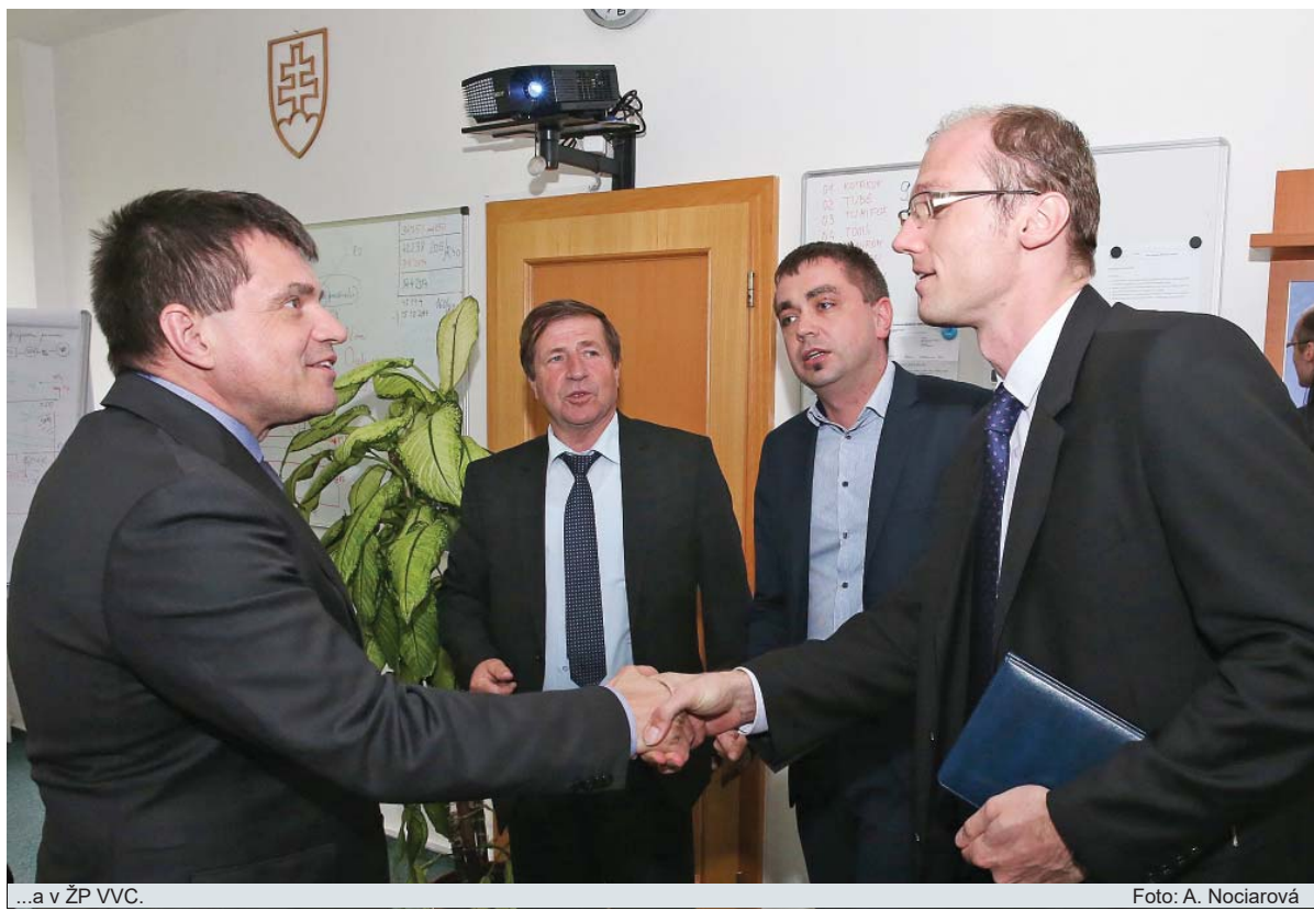
...a v ŽP VVC.

“ Odchádzam s vynikajúcimi dojmami. S ničím podobným som sa nestretol napriek tomu, že v rezorte pracujem prakticky od skončenia vysokej školy.