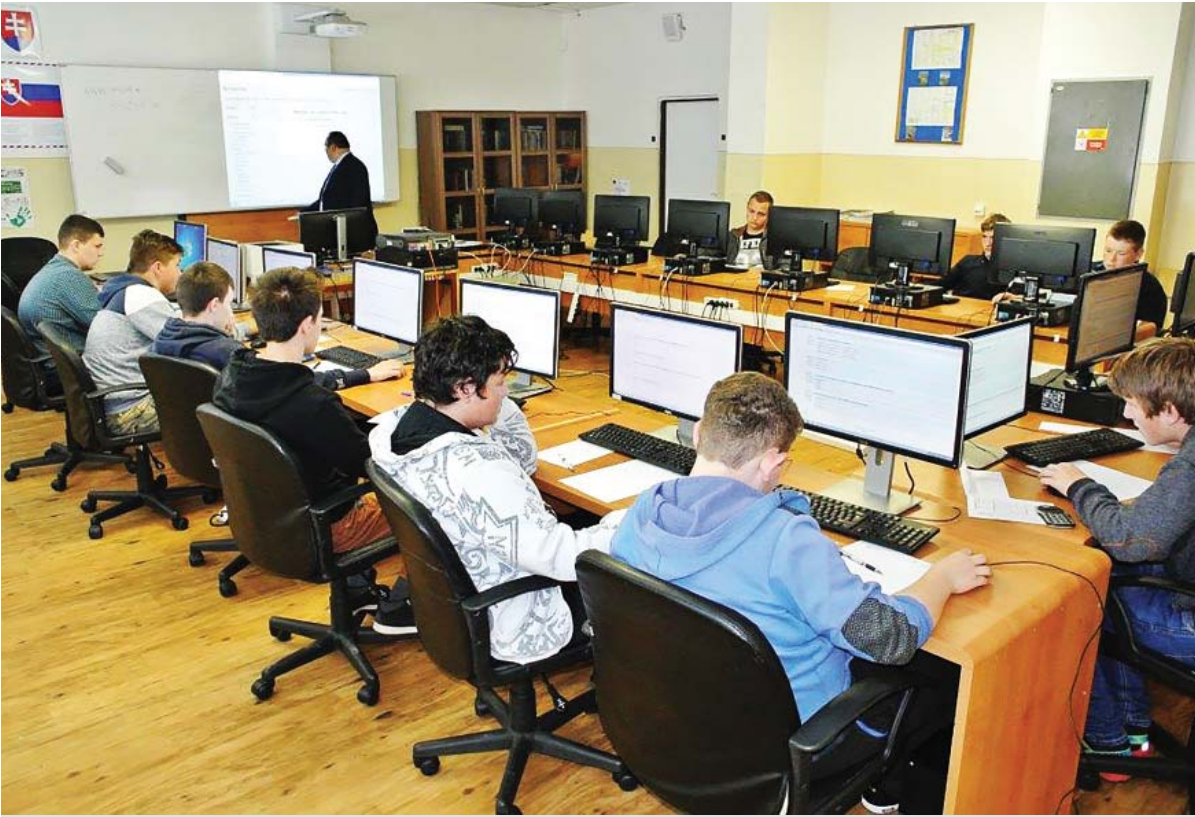
Dňa 9. mája 2016 sa v Súkromnom strednom odbornom učilišti hutníckom Železiarni Podbrezová konal prvý termín prijímacích skúšok pre uchádzačov o študijné odbory pre školský rok 2016/2017. Druhý termín bol 12. mája 2016. Uchádzači o učebné odbory boli prijatí bez prijímacích pohovorov.