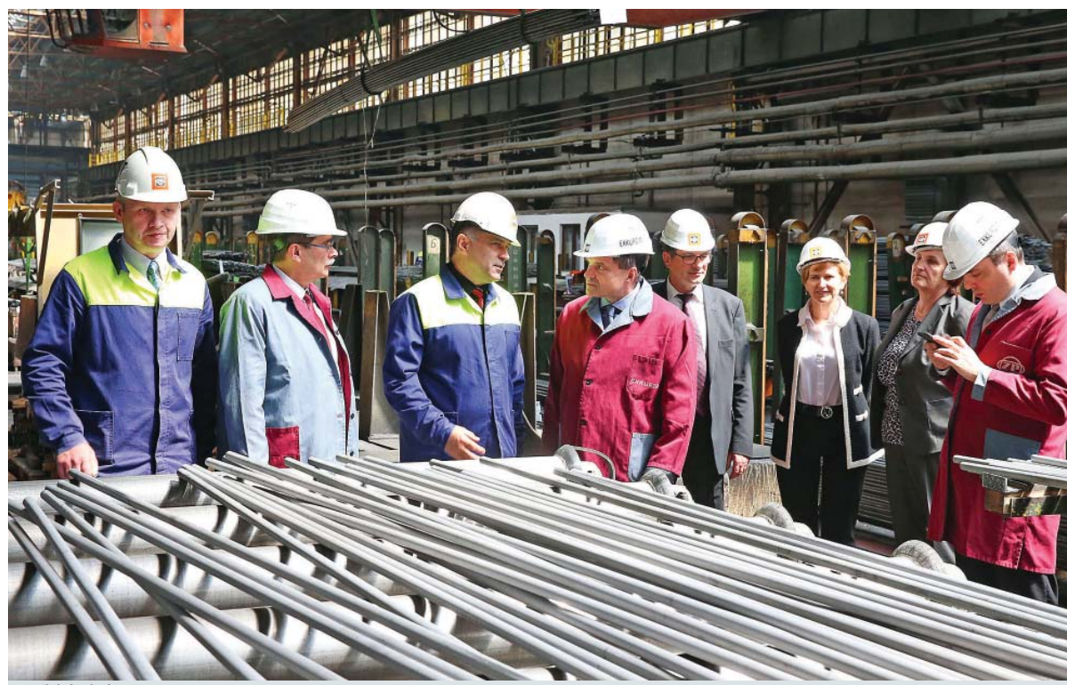
...v ťahárni rúr

Takýto model podpory mladých ľudí by som rád videl všade. Veľmi sa mi to páčilo. Vynikajúce sú moje dojmy z fabriky, aj zo školy. Ak sa niekde hovorí o duálnom vzdelávaní, tak minimálne takto by malo vyzerať. Tu totiž nejde len o prípravu mladých ľudí na povolanie. Toto je ako širšia rodina. Absolventi po skončení školy už vedia, že majú prácu, napriek tomu ich nikto do toho netlačí. Môžu sa rozhodnúť sami.