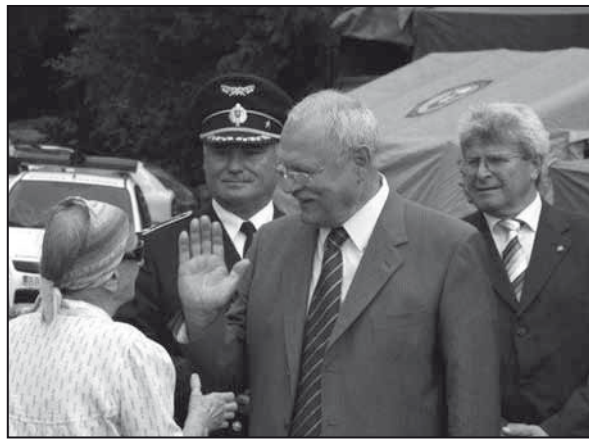
Pamätníkov prišiel pozdraviť aj prezident SR Ivan Gašparovič

Prezident Gašparovič vyjadril vďaka tým, ktorí nezabúdajú na tragédiu v Kališti, ani na tie, ktoré počas vojny postihli ďalšie obce po celom Slovensku. To, čo sa stalo aj v Kališti, označil za veľké zverstvo a ľudia si to budú navždy pamätáť. Vtedajšiu obec Kalište Nemci obklúčili a zapálili v noci zo 17. na 18. marca 1945, pričom zabilí trinásť ľudí. V roku 1940 v nej žilo dvestodevät obyvateľov. Počas Povstania sa stala jedným z centier takzvanej Partizánskej republiky v Nízkych Tatrách. Za pomoc partizánom ju nacisti prepadli a vypálili štyridsaťdva domov aj s hospodárskymi budovami. Zostalo v nej len šesť domov. Po vojne Kalište, ako jedinú z vypálených obcí na Slovensku, už neobnovili. Jej obyvateľov presídľili najmä do Ban-