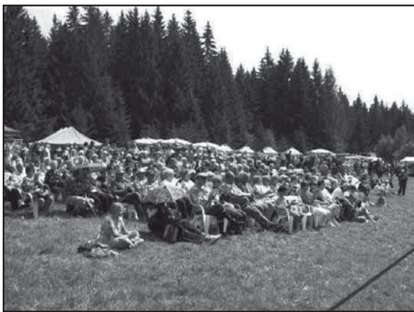
Veľký potlesk od vďačného publika

Do Kalište okrem iných prišli aj prezident SR Ivan Gašparovič a predseda Národnej rady SR Pavol Paška. Zúčastnil sa aj predseda Poslaneckej snemovne Českej republiky Miloš Vlaček, ktorý otvoril putovnú výstavu Zapomenuté Javoříčko. Približuje osud moravskej obce Javoříčko vypálenej fašistami 5. mája 1945, len niekoľko dní pred skončením II. svetovej vojny.