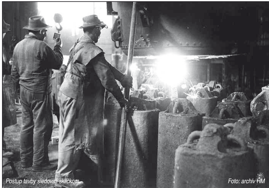
Postup tavby sledovať sklíčkom

Pozorovať život oceľiarne bolo veľmi zaujímavé, niekedy však aj neradiostné. Stalo sa, že sa prepadla klenba pece a vypukol požiar alebo sa časť šrotového poľa prepadla do vodného kanála. Ruch vo fabrike mi od soboty popoludnia do pondelka rána, kedy sa život vo fabrike zastavil, veľmi chýbal. Už vtedy mi fabrika pomaly prirastala k srdcu a to som ešte netušil, že raz budem jej súčasťou.