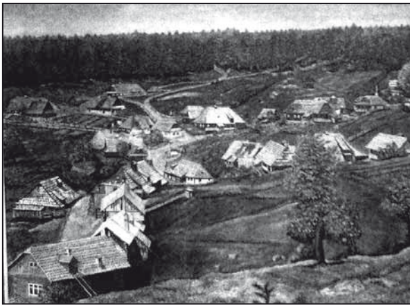
Málokto si pamätá Kalište pred vypálením