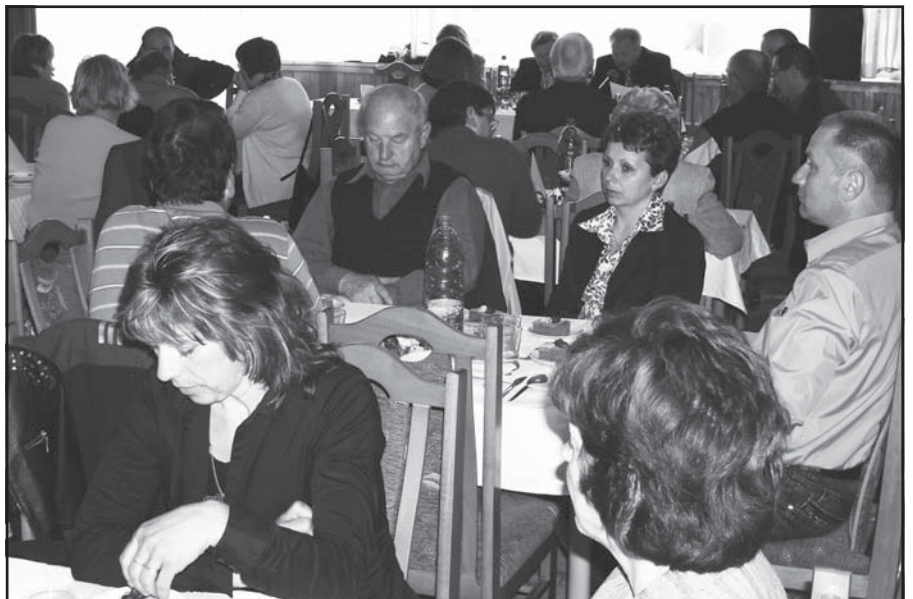
Konferencie sa zúčastnilo 62 delegátov.