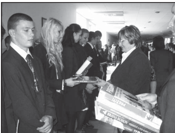
Za výborné výsledky a reprezentáciu školy boli tí najaktívnejší ocenení.