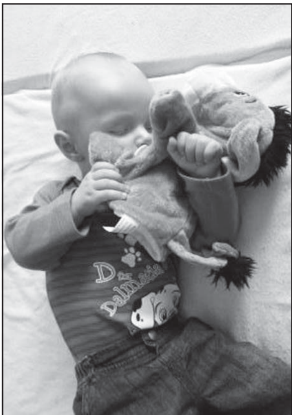
Je veľmi zle, ak sa nevie dieťa tešiť z toho čo má, ale dokáže byť smutné pre to, čo nedostalo. Najkrajším darčekom, ktorý môžete darovať svojmu dieťaťu k Medzinárodnému dňu detí, je spoločný program pre celú rodinu. Tak si to spolu užite.