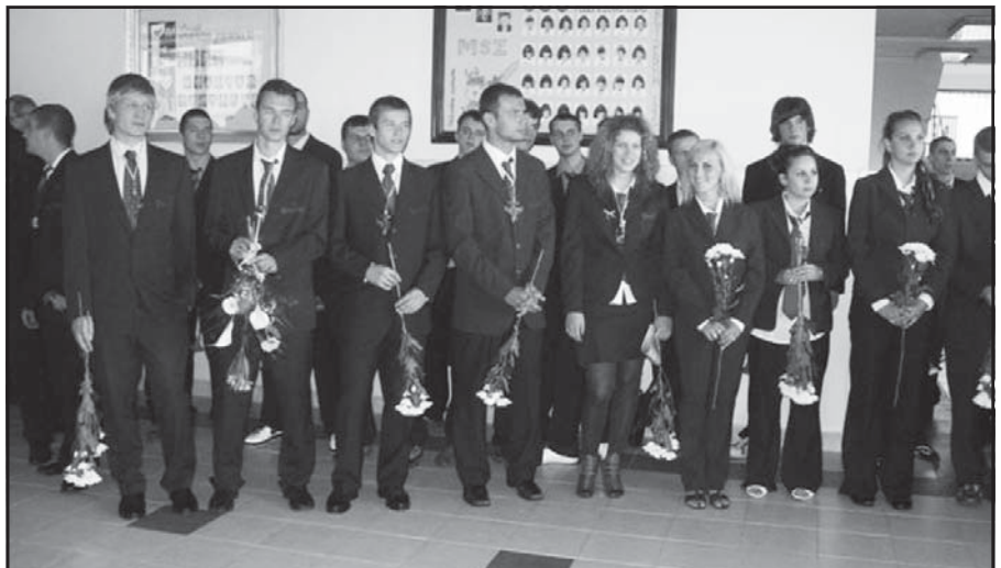
Aj študenti IV. G triedy Súkromného gymnázia ŽP sa 16. mája rozlúčili so školou.