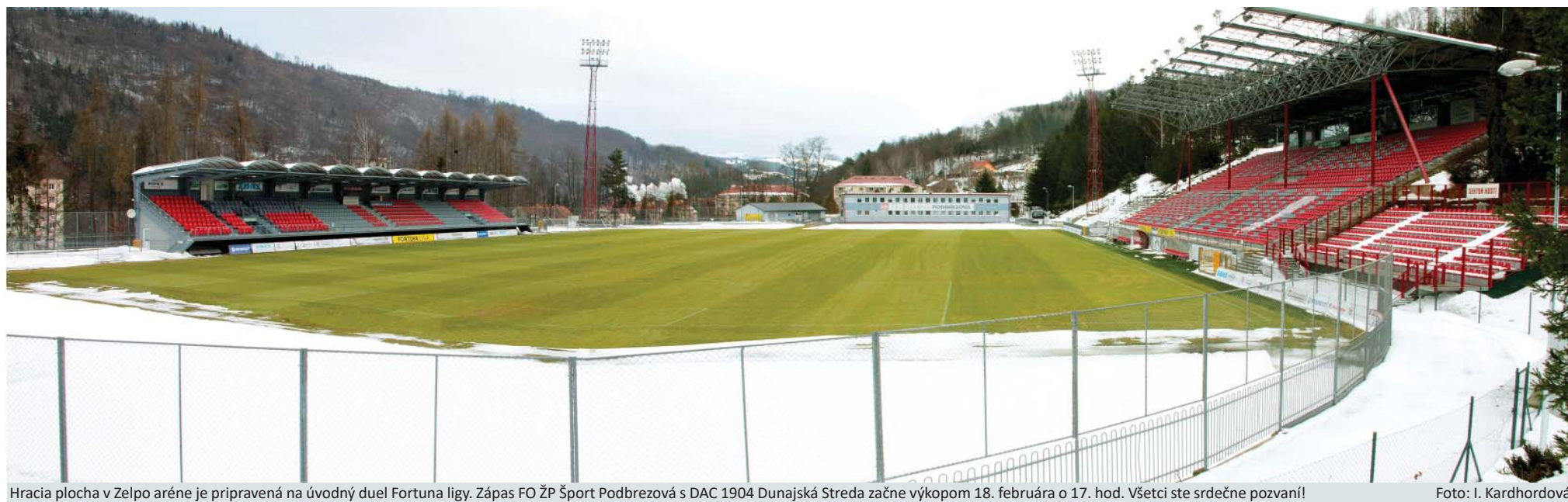
Hracia plocha v Zelpo aréne je pripravená na úvodný duel Fortuna ligy. Zápas FO ŽP Šport Podbrezová s DAC 1904 Dunajská Streda začne výkopom 18. februára o 17. hod. Všetci ste srdečne pozvaní!