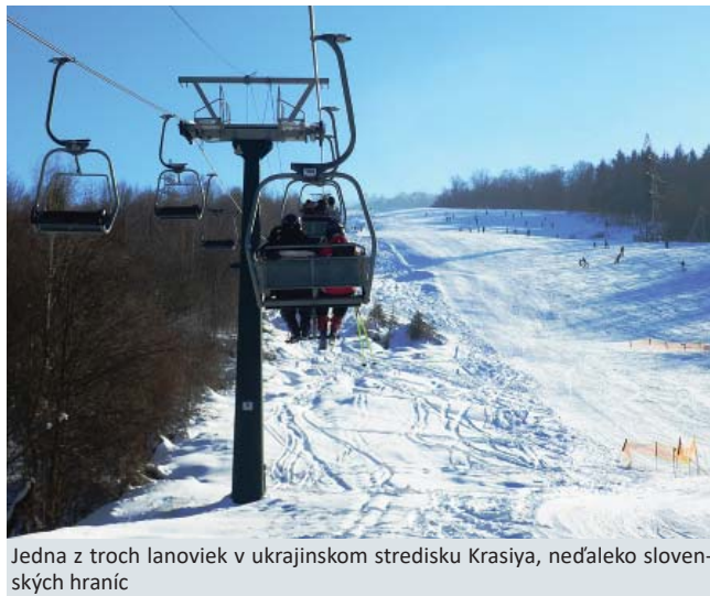
Jedna z troch lanoviek v ukrajinskom stredisku Krasia, neďaleko slovenských hraníc

okruhu v oblasti lanovej dopravy zameraného na lanovky. Zbierajú informácie o histórii jednotlivých lanových dráh na Slovensku, ich technické parametre, fotografie, realizované i nerealizované projekty výstavby lanových dráh, dobové snímky z výstavby a prevádzky lanových dráh. Mnohé dobové fotografie lanoviek, aj v zahraničí, sú poskytnuté návštevníkmi stránky. Na Slovensku je toho času vyše šesťdesiat lanoviek na prepravu osôb, z toho štyri sú dlhodobé mimo prevádzky. Ide o sedačkové lanovky Dediný – Geravy, Drienica – Lysá, Vrátna – Grúň a Chvatimech. Lanovka na Chvatimechu je prvou sedačkovou lanovkou vyrobenou na Slovensku. Do prevádzky bola uvedená v roku 1955. V súčasnosti slúži už len na prepravu nákladu. Najnovšími lanovkami sú Krupová – Kosodrevina na juhu Chopku a sedačková lanovka Oravská Lesná – Kohútik. Pre nadšencov sú z hľadiska