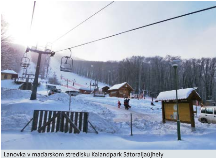
Lanovka v maďarskom stredisku Kalandpark Sátoraljaújhely

okruhu v oblasti lanovej dopravy zameraného na lanovky. Zbierajú informácie o histórii jednotlivých lanových dráh na Slovensku, ich technické parametre, fotografie, realizované i nerealizované projekty výstavby lanových dráh, dobové snímky z výstavby a prevádzky lanových dráh. Mnohé dobové fotografie lanoviek, aj v zahraničí, sú poskytnuté návštevníkmi stránky. Na Slovensku je toho času vyše šesťdesiat lanoviek na prepravu osôb, z toho štyri sú dlhodobé mimo prevádzky. Ide o sedačkové lanovky Dediný – Geravy, Drienica – Lysá, Vrátna – Grúň a Chvatimech. Lanovka na Chvatimechu je prvou sedačkovou lanovkou vyrobenou na Slovensku. Do prevádzky bola uvedená v roku 1955. V súčasnosti slúži už len na prepravu nákladu. Najnovšími lanovkami sú Krupová – Kosodrevina na juhu Chopku a sedačková lanovka Oravská Lesná – Kohútik. Pre nadšencov sú z hľadiska