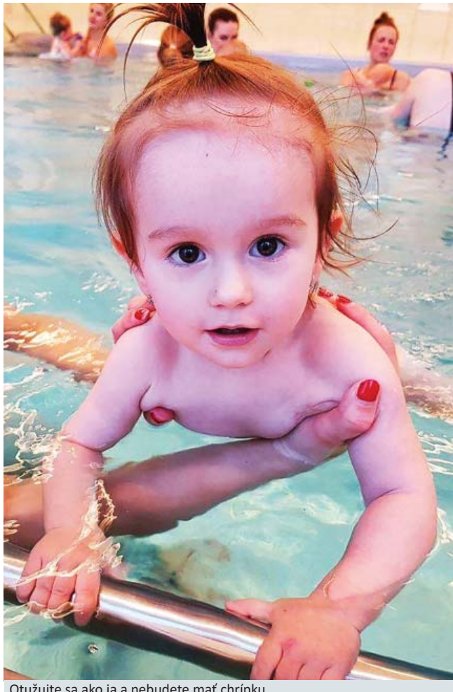
Otužujte sa ako ja a nebudete mať chrípku....

Pri vysokej teplote by ste sa nemali potiť pod perinou, ale skôr sa ochladzovať. Skúste studené zábaly alebo aspoň desaťminútovú sprchu v chladnej vode a potom sa opäť prikryte.