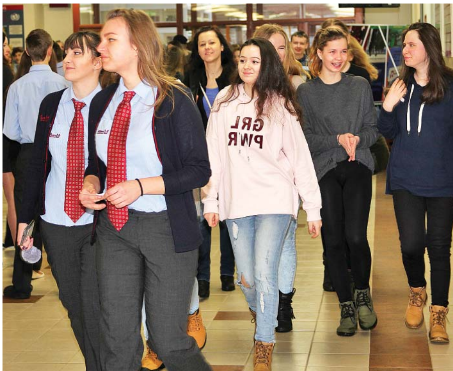
Deň otvorených dverí objektívom I. Kardhordovej