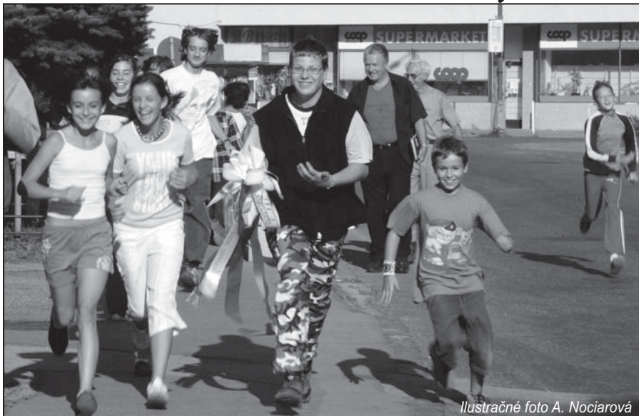
Ilustračné foto A. Nociarová

ným úradom verejného zdravotníctva vo Švajčiarsku so sídlom v Berne. Podľa odborníkov by to však nemala byť len úloha verej-