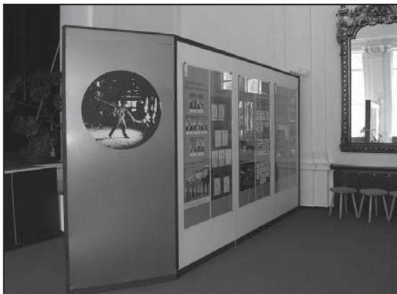
Expozícia bola doplnená o novodobú históriu